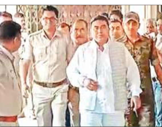
शाहजहां शेख से कोई हमदर्दी नहीं : चीफ जस्टिस

संदेशखाली के कुछ हिस्सों में अतिरिक्त बल तैनात : हालात को नियंत्रित करने के लिए संदेशखाली के कुछ हिस्सों में अतिरिक्त बल भी तैनात किया गया है और यहाँ के 49 क्षेत्रों में दंड प्रक्रिया संहिता (सीआरपीसी) की धारा 144 के तहत निषेधाज्ञा लगायी गई है।