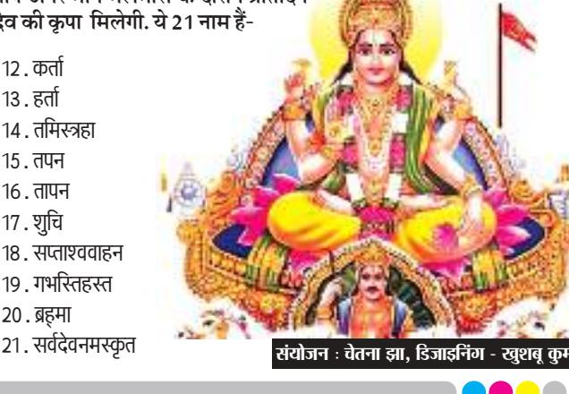
संयोजन : चेतना झा, डिजाइनिंग - खुशवंत कुमारी