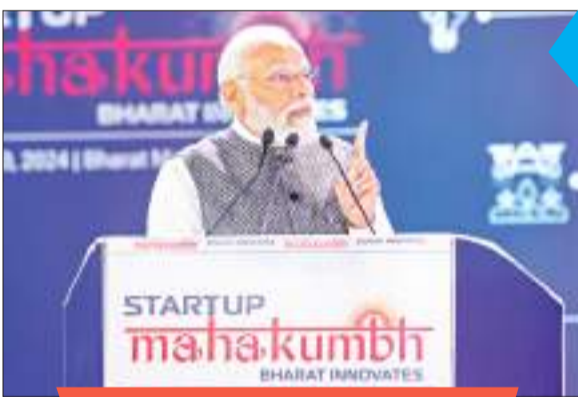
युवा अब नौकरी देने वाले बन रहे हैं

बेहतर तंत्र बनाने की तैयारी भी होगी : प्रधानमंत्री मोदी ने कहा कि भारत ने हजारों करोड़ रुपये के निवेश के साथ राष्ट्रीय अनुसंधान फाउंडेशन बनाने का फैसला किया है और स्टार्टअप के वित्तपोषण के लिए एक बेहतर तंत्र बनाने की तैयारी भी कर रहा है। उन्होंने कहा, देश ने हजारों करोड़ के निवेश के साथ