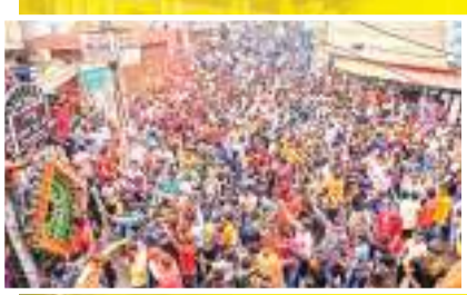
वाराणसी में रंगभरी एकादशी के अवसर पर बुधवार को एक धार्मिक जुलूस में भाग लेते भक्त.

लोकसभा चुनाव के पहले चरण में असम में पांच सीटों पर होने वाले मतदान के लिए अधिसूचना बुधवार को जारी की गई। निर्वाचन कार्यालय के एक अधिकारी ने यह जानकारी दी। असम की 14 लोकसभा सीटों के लिए चुनाव तीन चरणों में 19 अप्रैल, 26 अप्रैल और 7 मई को होंगे। पहले चरण में काजीरंगा, सोनिपुर, लखीमपुर, डिब्रूगढ़ और लखीमपुर में 19 अप्रैल को मतदान होगा।