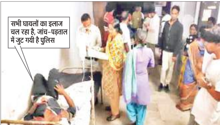
सभी घायलों का इलाज चल रहा है, जांच-पड़ताल में जुट गयी है पुलिस

घटना के बाद तोपचांची पुलिस घटनास्थल पर पहुंचकर आसपास के लोगों से पूछताछ की संवाददाता। तोपचांची (धनबाद)