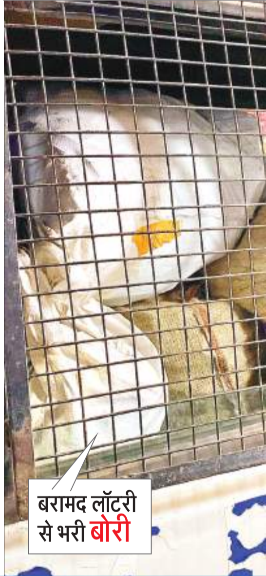
बरामद लॉटरी से भरी बोरी