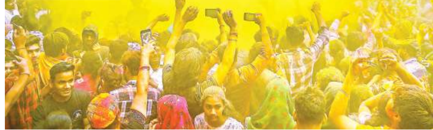
होलियाना मूड में आए लोग : बुधवार को मथुरा के द्वारकाधीश मंदिर में होली उत्सव के दौरान भक्त रंगों के साथ जश्न मनाते हुए.