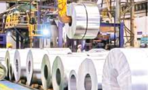
वित्तीय वर्ष 2024 के अप्रैल-दिसंबर के दौरान इस्पात क्षेत्र का प्रदर्शन किसी भी वित्तीय वर्ष के अप्रैल-दिसंबर की तुलना में सबसे अच्छा रहा है।

निर्माण, बुनियादी ढांचे, ऑटोमोबाइल, इंजीनियरिंग और रक्षा जैसे महत्वपूर्ण क्षेत्रों में अहम भूमिका निभाने वाले भारत के स्टील क्षेत्र में वृद्धि दर्ज की गई है। देश में इस्पात के उत्पादन और खपत दोनों में भारी वृद्धि देखी गई है। प्रति व्यक्ति इस्पात की खपत वर्ष 2013-14 में 59 किलोग्राम से बढ़कर वर्ष 2022-23 में 119 किलोग्राम हो गई है। भारत ने वर्ष 2022-23 में 123 मिलियन टन इस्पात का उत्पादन किया है। इस्पात उत्पादन की क्षमता वर्ष 2012-13 में 97 मिलियन टन था जो वर्ष 2023-24 में बढ़कर 171.35 मिलियन टन हो गई है।