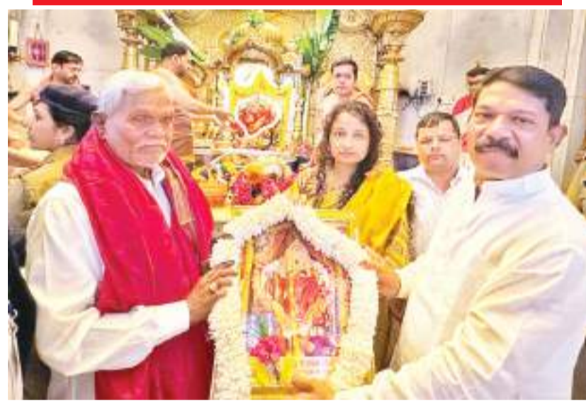
सोमवार की सुबह सीएम चंपाई सोरेन और कल्पना सोरेन ने मुंबई में सिद्धिविनायक के दर्शन किये.