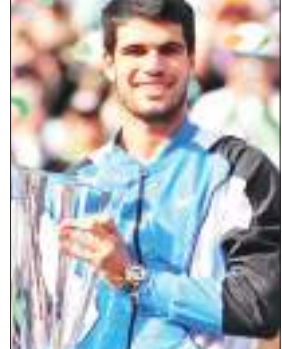
गंवाए, अल्काराज को फरवरी में रियो ओपन के दौरान चोट लगी थी। उन्होंने इंडियन वेल्स में खिताब जीतने के बाद कहा कि मैं हर मैच के बाद बेहतर महसूस कर रहा था। हर मैच