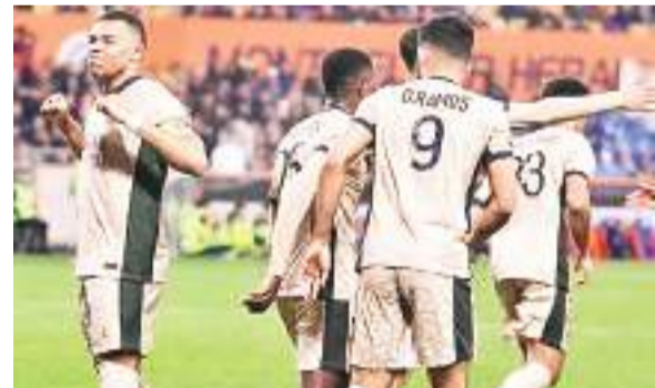
कांग-इन और नूरो मंडेस ने भी गोल किए। रिम्स, मोनाको और रेनेस के साथ डूअ खेलेने के बाद पीएसजी के लिए चार लीग मैचों में यह पहली जीत थी।

किलियन एमबापे की हैट्रिक की मदद से पेरिस सेंट-जर्मेन (पीएसजी) ने लीग वन फुटबॉल में मोटपेलियर को 6-2 से करारी शिकस्त दी। इस जीत के साथ ही पीएसजी ने फ्रांस की शीर्ष घरेलू लीग की तालिका में पहले स्थान पर अपनी स्थिति और मजबूत करते हुए ब्रेस्ट पर 12 अंक की बढ़त बना ली। एमबापे ने मैच के 22वें मिनट में अपना पहला गोल दागा। उन्होंने दूसरे हाफ में दो गोल किये जिससे पीएसजी के लिए उनके गोल की संख्या 250 हो गयी। वह 24 गोल के साथ मौजूद खिलाड़ी हैं। ब्रितीशा ने मैच में पीएसजी का खाता खोला जबकि ली