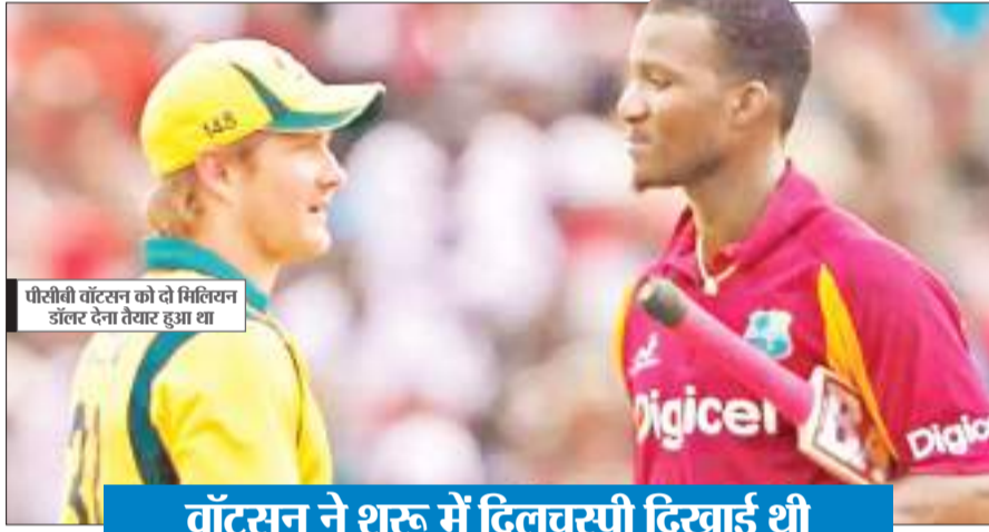
पीसीबी वॉटसन को दो मिलियन डॉलर देना तैयार हुआ था

ऑस्ट्रेलिया-न्यूजीलैंड के पिछले दौर पर क्रिकेट निदेशक के साथ-साथ पाकिस्तान टीम के अंतरिम कोच की जिम्मेदारी निभाई थी। अब डेरेन सैमी ने पाकिस्तान टीम का हेड कोच बनने से पीछे हट गए। सैमी को पाकिस्तान क्रिकेट बोर्ड सीमित ओवरस क्रिकेट में टीम का हेड कोच बनाना था। सैमी ने पीसीबी को बताया कि वह पहले से ही वेस्टइंडीज बोर्ड के साथ सीमित ओवरस की टीम के मुख्य कोच के रूप में अनुबंधित हैं। सैमी की कप्तानी में वेस्टइंडीज ने 2012 और 2016 का टी20 वर्ल्ड कप जीता था। सैमी के इनकार के बाद पाकिस्तान क्रिकेट बोर्ड न्यूजीलैंड के खिलाफ 14 अप्रैल से शुरू होने वाली पांच मैचों की घरेलू टी20 सीरीज के लिए किसी घरेलू कोच को अंतरिम तौर पर नियुक्त कर सकता है।