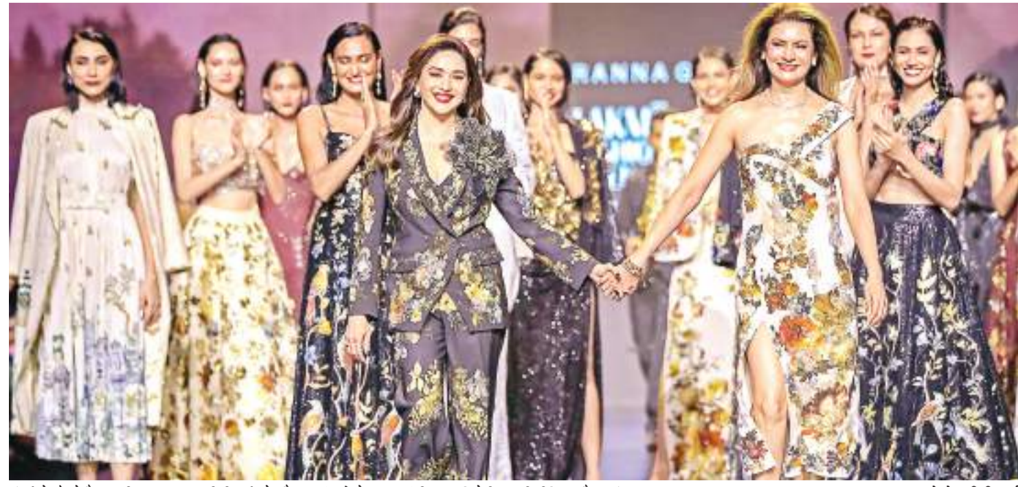
मुंबई में लैकम फैशन वीक 'एक्स एफडीसीआई' के दौरान मॉडलों के साथ बॉलीवुड अभिनेत्री माधुरी दीक्षित और वसुंधरा.

मियामी। हॉटेल में बहती गिराह हिंसक के कारण देश छोड़कर जाने वाले कई अमेरिकी नागरिकों को लेकर एक 'चाटर्' विमान मियामी पहुंच गया है। रविवार को उतरे सरकारी चाटर् विमान में 30 से अधिक अमेरिकी नागरिक थे। इस महीने की शुरुआत में पोर्ट-ऑ-प्रिस में अमेरिकी दूतावास ने हॉटेल में अराजकता के भयंजन अमेरिकी नागरिकों से जितनी जल्दी हो सके हॉटेल को छोड़ने का आग्रह किया था, जिसके बाद अब यह चाटर् विमान मियामी अंतरराष्ट्रीय हवाई अड्डे पर पहुंचा है।