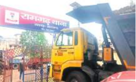
इधर, सभी छह हाईवा की जांच करने के बाद सभी वाहनों को रामगढ़ थाना लाया गया। पुलिस ने खनन विभाग को आगे की कार्रवाई के लिए

जिले में एक ही चालान पर कई हाईवा से कोयला दुलाई का खेल चल रहा है। इस पर लगातार के लिए डीसी के निर्देश पर रामगढ़ पुलिस ने बीती शनिवार रात रांची रोड से नई सराय के बीच छापेमारी अभियान चलाया। इस क्रम में कोयला लदे छह हाईवा को पकड़ा गया। दरअसल, पुलिस को गुप्त सूचना मिली थी कि कुजू रेलवे साइडिंग से एक ही चालान पर कोयला लदे वाहनों का परिवहन हो रहा है।