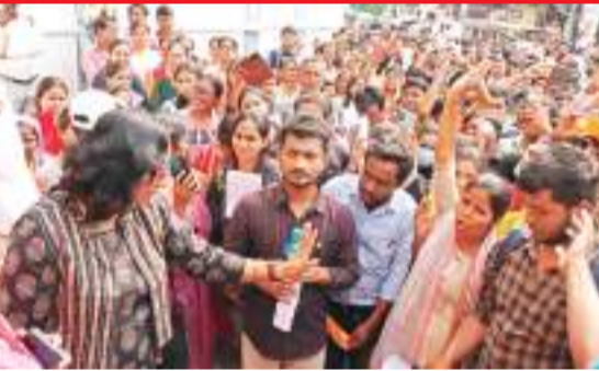
हंगामा कर रहे छात्रों को समझाती एसडीएम.

502 अभ्यर्थियों ने किया परीक्षा का बहिष्कार