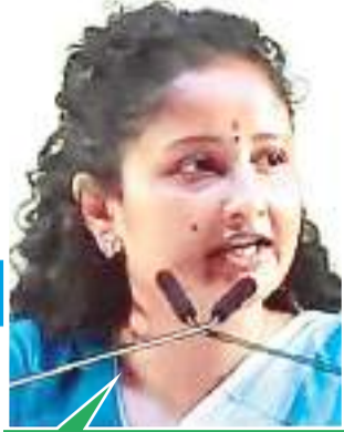
झारखंड झुकेगा नहीं इंडिया झुकेगा नहीं

इंडिया गठबंधन की रैली : शिवाजी पार्क में सभी नेताओं ने लिया संकल्प-लोकसभा चुनाव में मोदी सरकार को उखाड़ फेंकना है