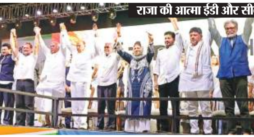
राजा की आत्मा इंडी और सीबीआई में बसती है: राहुल