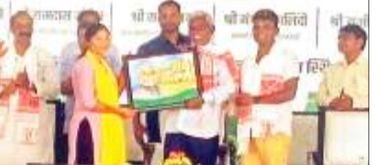
लाभुकों के बीच परिस्फुटियों का भी वितरण किया गया

पोटका प्रखंड कार्यालय मैदान में शुक्रवार को सीएम चंपाई सोरेन ने डिग्री कॉलेज निर्माण कार्य का शिलान्यास किया। सभा में उन्होंने कहा कि पोटका में डिग्री कॉलेज बनने से गांव के बच्चे घर के पास पढ़ सकेंगे। आदिवासी, मूलवासी, दलित, पिछड़े और गरीबों के बच्चों को उच्च शिक्षा प्राप्त होगी। उच्च शिक्षा प्राप्त कर ही झारखंडी बच्चे आगे बढ़ पाएंगे। उन्होंने कहा कि पोटका में सोना और यूरोनियम जैसी धातु निकलती है। झारखंड बनने के 24 वर्ष बाद भी राज्य अपेक्षित विकास नहीं कर पाया। सीएम ने इसके लिए भाजपा को दोषी ठहराया। उन्होंने कहा कि केंद्र सरकार झारखंड के साथ भेदभाव करती है। हमारे हक का आवास नहीं दिया। इसलिए हेमंत सोरेन ने अबूआ आवास योजना शुरू की। राज्य के 3 लाख वंचित लोगों को तीन कमरों का आवास दिया जाएगा। समारोह में पोटका के विधायक संजीव सरदार भी मौजूद थे। पोटका में 39.94 करोड़ की लागत से डिग्री कॉलेज बनेगा। इस योजना के साथ 129 करोड़ की अन्य योजनाओं का शिलान्यास रिमोट दबा कर मुख्यमंत्री ने किया। समारोह में लाभुकों के बीच परिस्फुटियों का भी वितरण किया गया।