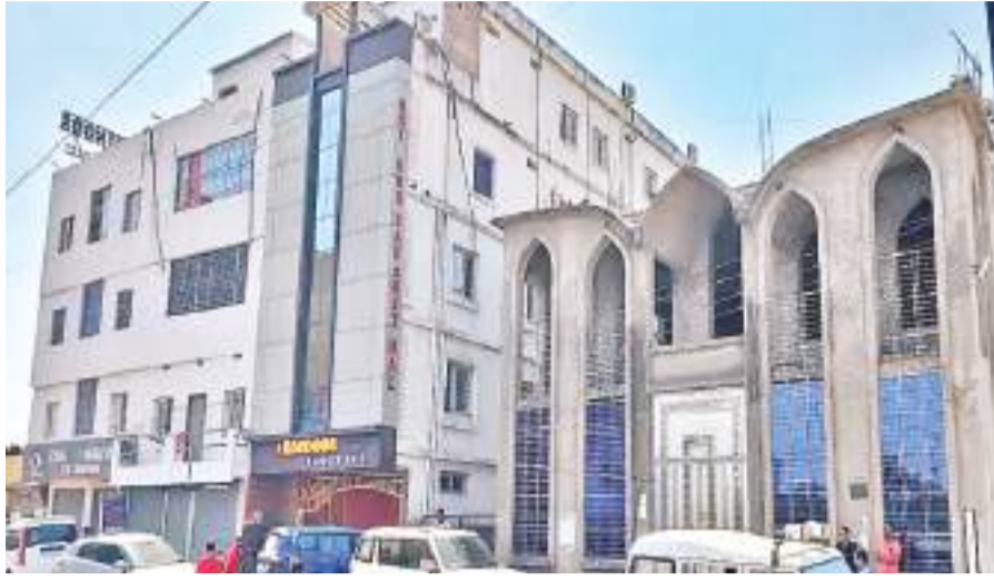
हजारीबाग एसडीपीओ कर रहे परीक्षार्थियों से पूछताछ

जानकारी के अनुसार टेट परीक्षा में शुक्रवार सुबह लोग होटल से निकल कर छात्र जाते, उससे पहले पुलिस को भनक लग गई। परीक्षा में शामिल होनेवाले छात्रों को हजारीबाग लाया गया था। यह बताया जा रहा है कि प्रश्न पत्र छात्रों को उपलब्ध कराने के बाद पिछले दो दिनों से पढ़ाया जा रहा था। शुक्रवार को छात्र अलग-अलग बस से परीक्षा स्थल के लिए रवाना हुए थे। इसी दौरान पुलिस को इनपुट मिला, जिस आधार पर ये ऑपरेशन चलाया गया। सबसे महत्वपूर्ण बात यह है कि इनमें से किसी के परीक्षार्थियों के पास उसका मोबाइल नहीं है। इससे इस बात की पुष्टि हो रही है की अंतरराज्यीय गिरोह इन्हें ऑपरेट कर रहा है। इसलिए इनका मोबाइल जब्त किया गया होगा। इन छात्रों से सदर एसडीपीओ पूछताछ कर रहे हैं।