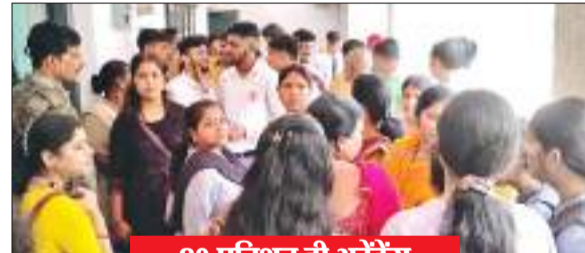
30 प्रतिशत ही अटेंडेंस

साकची स्थित राजेंद्र विद्यालय परिसर में उस वक्त हंगामा मच गया, जब बच्चों को कक्षा में फेल करने पर अभिभावकों का गुस्सा स्कूल प्रबंधन पर टूट पड़ा. परिजन स्कूल पहुंचे और स्कूल प्रबंधन पर आरोप लगाते हुए जमकर हंगामा किया. मामला इतना बढ़ गया कि मौके पर साकची पुलिस पहुंच गई. पुलिस ने आकर मोर्चा संभाला, पर परिजन शांत होने को राजी नहीं थे. अभिभावकों को मांग थी कि बच्चों को अगली कक्षा में प्रमोट किया जाए. बता दें कि स्कूल प्रबंधन ने नौवीं और 11वीं कक्षा के साइंस और कॉमर्स के कुल 102 विद्यार्थियों को फेल किया है.