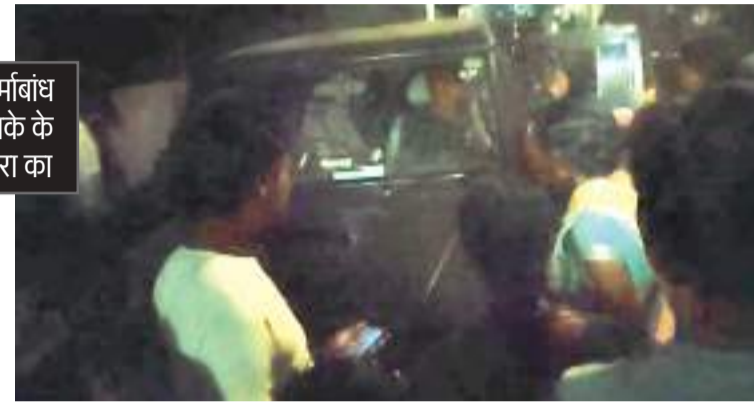
मामला धर्माबांध ओपी इलाके के नीचे देवघरा का