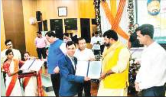
को प्रशिक्षित करने में काफी सुविधा होगी। उन्होंने कहा कि राज्य में विश्व स्तरीय खिलाड़ियों को तैयार करना है। इस दिशा में विभाग के द्वारा अनेक प्रयास किए गए हैं। सरकार ने सारी सुविधा इन केंद्रों में उपलब्ध कराई है।