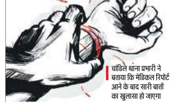
चांडिल थाना प्रभारी ने बताया कि मेडिकल रिपोर्ट आने के बाद सारी बातों का खुलासा हो जाएगा

इस संबंध में लड़की के पिता ने चांडिल थाना में 22 फरवरी को लिखित आवेदन देकर घटना की जांच पड़ताल करते हुए कानूनी कार्रवाई करने का आग्रह किया था। चांडिल थाना कि पुलिस ने अनुसंधान के दौरान घटना के 25 दिनों बाद आरोपी युवक को गिरफ्तार कर जेल भेज दिया। इस मामले पर चार मार्च को बड़ी संख्या में महिलाओं ने चांडिल थाना का घेराव किया था, उस समय ग्रामीण महिलाओं व परिजनों ने आरोप लगाया था कि नाबालिग पीड़िता के साथ सामूहिक दुष्कर्म भी किया गया है। इस संबंध में चांडिल थाना प्रभारी ने बताया कि मेडिकल रिपोर्ट आने के बाद सारी चीजों का खुलासा हो जाएगा। इसके बाद नियमानुसार कार्रवाई होगी। पुलिस घटना के सभी बिंदुओं पर गहन जांच कर रही है।