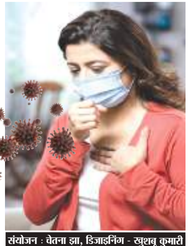
संयोजन - वैतना झा, डिजाइनिंग - खुशबू कुमारी

कोशिश करें कि घर में पर्याप्त हवा की आवाजाही हो। कम से कम दिन के समय खिड़कियां-दरवाजे खोल कर घर के अंदर की हवा को साफ रखें। इससे हवा में मौजूद वायरस की मात्रा कम हो जाती है। सांस संबंधी अन्य समस्या होने पर भी इस उपाय से आराम मिलता है।