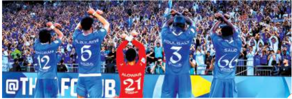
भाषा । जेहा (सऊदी अरब)

सऊदी अरब की टीम अल हिलाल ने लगातार 28वीं जीत दर्ज करके शीर्ष स्तर की फुटबॉल में नया विश्व रिकॉर्ड बनाया. अल हिलाल ने अल इतिहाद को 2-0 से हराकर यह उपलब्धि हासिल करने के साथ ही एशियाई चैंपियंस लीग के सेमीफाइनल में भी प्रवेश किया. इन दोनों टीम के बीच पहले चरण का मैच भी अल हिलाल ने जीता था और इस तरह से उसने अपने घरेलू प्रतिद्वंद्वी अल इतिहाद को 4-0 के कुल अंतर से पराजित किया. सऊदी अरब की घरेलू लीग