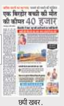
छपी खबर .