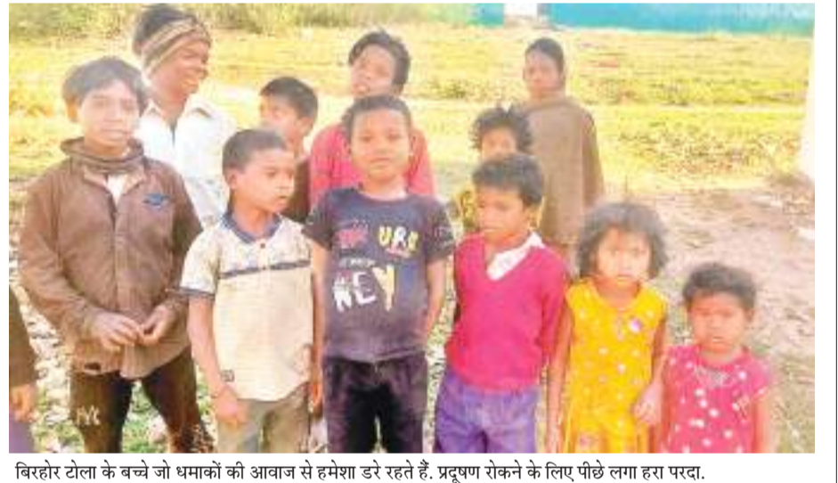
बिरहोर टोला के बच्चे जो धमाकों की आवाज से हमेशा डरे रहते हैं, प्रदूषण रोकने के लिए पीछे लगा हरा पद।

03 साल से चल रही माइंस, स्थानीय विधायक और सांसद ने नहीं ली सुध