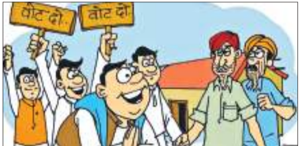
नेताओं और उनके छुटभैये पर आम जनता की राय

इस क्रम में उन्हें मेरु कैंप में संचालित पाठ्यक्रमों के बारे में बताया गया। इस दौरान शारीरिक प्रशिक्षण कोर्सों के पाठ्यक्रम की तैयारी, ब्लॉक पाठ्यक्रम, मूल्यांकन, अंकन प्रक्रिया एवं दोनों संगठनों की आवश्यकता के बारे में चर्चा की गई। दोर के दूसरे दिन बुधवार को संकाय को शारीरिक प्रशिक्षण समूह के अनुदेशकों द्वारा प्रदर्शन दिखाया गया। तत्पश्चात सुबह 10:30 बजे प्रशिक्षण केंद्र के डीआईजी केएस