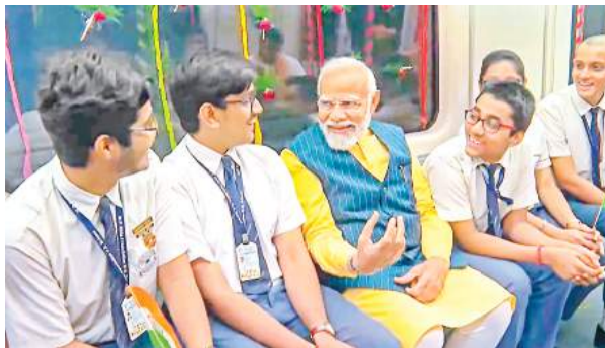
बुधवार को कोलकाता में कई कनेक्टिविटी परियोजनाओं के उद्घाटन के दौरान मेट्रो ट्रेन में स्कूली छात्रों के साथ बातचीत करते प्रधानमंत्री नरेंद्र मोदी।