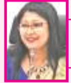
महआ माजी राज्य सभा सदस्य, लखिया

66 इतने वर्षों के संघर्ष, इतने वर्षों की लड़ाई के बाद महिला सशक्तीकरण का अगर एक सूत्र पूछें तो मेरी नजर में यह जागरूकता है. राज्य व केंद्र सरकार की ओर से कई योजनाएं महिलाओं के हित में आईं. कई कानून महिलाओं के हित में बने हैं. अगर महिलाएं जागरूक हों तो अपने हक हासिल कर सशक्त हो सकती हैं. 99