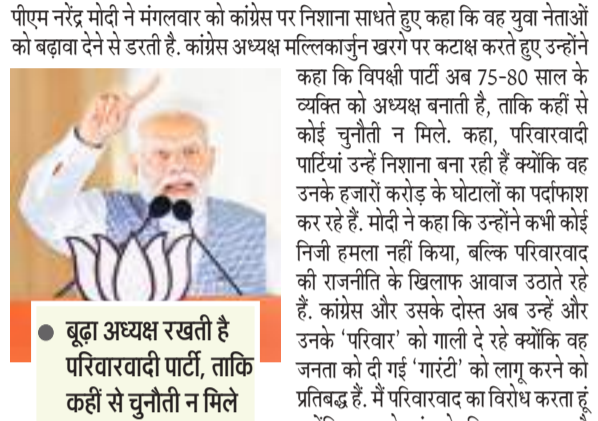
● बड़ा अध्यक्ष रखती है परिवारवादी पार्टी, ताकि कहीं से चुनौती न मिले

पीएम नरेंद्र मोदी ने मंगलवार को कांग्रेस पर निशाना साधते हुए कहा कि वह युवा नेताओं को बढ़ावा देने से डरती है। कांग्रेस अध्यक्ष मल्लिकार्जुन खरगे पर कटाक्ष करते हुए उन्होंने कहा कि विपक्षी पार्टी अब 75-80 साल के व्यक्ति को अध्यक्ष बनाती है, ताकि कहीं से कोई चुनौती न मिले। कहा, परिवारवादी पार्टियां उन्हें निशाना बना रही हैं क्योंकि वह उनके हजारों करोड़ के घाटालों का पर्दाफाश कर रहे हैं। मोदी ने कहा कि उन्होंने कभी कोई निजी हमला नहीं किया, बल्कि परिवारवाद की राजनीति के खिलाफ आवाज उठाते रहे हैं। कांग्रेस और उसके दोस्त अब उन्हें और उनके 'परिवार' को गाली दे रहे क्योंकि वह जनता को दी गई 'गारंटी' को लागू करने को प्रतिबद्ध हैं। परिवारवाद का विरोध करता है क्योंकि यह लोकतंत्र के लिए खतरनाक है और युवाओं को नए अवसर नहीं देता। तो वे इसका जवाब नहीं देते हैं लेकिन कहते हैं कि मोदी का कोई परिवार नहीं है। कांग्रेस पर निशाना साधते हुए कहा कि वह युवाओं को कभी भी पर्दानेति नहीं देते। वे ऐसे व्यक्ति को लाते हैं, जो 75-80 वर्ष का हो, 85 वर्ष का हो। उन्हें डर है कि अगर युवा आगे बढ़ जाएंगे, तो परिवार का क्या होगा।