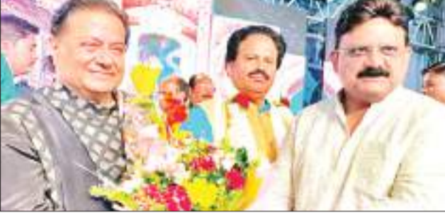
उनकी टीम को माला पहनाकर, पुष्प गुच्छ देकर एवं शॉल ओढ़ाकर सम्मानित किया. साथ ही इन्हें मां गढ़देवी की तस्वीर भी भेंट की. दोनों कलाकारों ने एक से बढ़कर गजल, भजन व लोकगीत प्रस्तुत किया. इनके गीतों पर श्रोता देर रात तक झूमते रहे. मौके पर मंत्री श्री ठाकुर ने कहा

गढ़वा में पांच बड़ी योजनाओं के लोकार्पण के मौके पर आयोजित चार दिवसीय सांस्कृतिक कार्यक्रम के तहत सोमवार की संध्या टाउन हॉल के मैदान में रंगारंग सांस्कृतिक कार्यक्रम का आयोजन किया गया. इस दौरान सुविख्यात गजल व भजन गायक अनूप जलोटा, प्रसिद्ध भोजपुरी लोक गायक भरत शर्मा ने कार्यक्रम की प्रस्तुति की. मौके पर गढ़वा विधायक झारखंड सरकार के पेयजल एवं स्वच्छता व उत्पाद एवं मद्य निषेध विभाग मंत्री मिथिलेश कुमार ठाकुर ने दोनों गायकों व