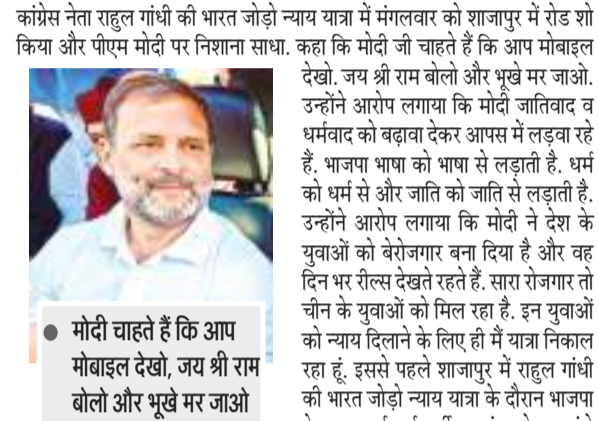
● मोदी चाहते हैं कि आप मोबाइल देखो, जय श्री राम बोलो और भूखे मर जाओ

कांग्रेस नेता राहुल गांधी को भारत जोड़ो न्याय यात्रा में मंगलवार को शाजापुर में रोड़ शो किया और पीएम मोदी पर निशाना साधा। कहा कि मोदी जी चाहते हैं कि आप मोबाइल देखो, जय श्री राम बोलो और भूखे मर जाओ। उन्होंने आरोप लगाया कि मोदी जातिवाद व धर्मवाद को बढ़ावा देकर आपस में लड़वा रहे हैं। भाजपा भाषा को भाषा से लड़ाती है। धर्म को धर्म से और जाति को जाति से लड़ाती है। उन्होंने आरोप लगाया कि मोदी ने देश के युवाओं को बेरोजगार बना दिया है और वह दिन भर रील्स देखते रहते हैं। सारा रोजगार तो चीन के युवाओं को मिल रहा है। इन युवाओं को न्याय दिलाने के लिए ही मैं यात्रा निकाल रहा हूँ, इससे पहले शाजापुर में राहुल गांधी को भारत जोड़ो न्याय यात्रा के दौरान भाजपा के कुछ कार्यकर्ता पार्टी का झंडा लेकर पहुंचे थे, उन्होंने राहुल गांधी का स्वागत मोदी-मोदी नारे लगाकर किया। इसे सुनकर राहुल गांधी खुद गाड़ी से उतरे। भाजपा कार्यकर्ताओं के पास पहुंचे, इस दौरान भाजपा कार्यकर्ताओं ने जय श्री राम के नारे भी लगाए, कुछ भाजपा कार्यकर्ताओं ने राहुल गांधी के हाथ में आलू भी दिए, उनसे कहा कि आलू से सोना बना दीजिए।