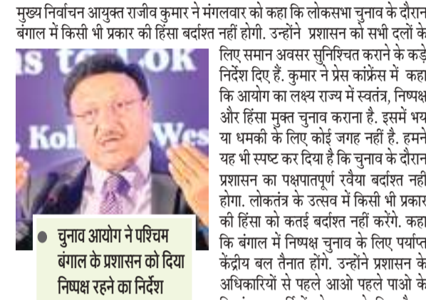
● चुनाव आयोग ने पश्चिम बंगाल के प्रशासन को दिया निष्पक्ष रहने का निर्देश

मुख्य निर्वाचन आयुक्त राजीव कुमार ने मंगलवार को कहा कि लोकसभा चुनाव के दौरान बंगाल में किसी भी प्रकार की हिंसा बर्दाश्त नहीं होगी। उन्होंने प्रशासन को सभी दलों के लिए समान अवसर सुनिश्चित करने के कड़े निर्देश दिए हैं। कुमार ने प्रेस कॉन्फ्रेंस में कहा कि आयोग का लक्ष्य राज्य में स्वतंत्र, निष्पक्ष और हिंसा मुक्त चुनाव करना है। इसमें भय या धमकी के लिए कोई जगह नहीं है। हमने यह भी स्पष्ट कर दिया है कि चुनाव के दौरान प्रशासन का पक्षपातपूर्ण रवैया बर्दाश्त नहीं होगा। लोकतंत्र के उन्मुख में किसी भी प्रकार की हिंसा को कतई बर्दाश्त नहीं करेगी। कहा कि बंगाल में निष्पक्ष चुनाव के लिए पर्याप्त केंद्रीय बल तैनात होगा। उन्होंने प्रशासन के अधिकारियों से पहले आओ पहले पाओ के सिद्धांत पर पार्टियों को प्रचार के लिए मैदान और बैठक स्थानों को अनुमति देने में पारदर्शिता सुनिश्चित करने का निर्देश दिया है। धन-बल और शराब के इस्तेमाल पर अंकुश लगाने के संबंध में उन्होंने शराब बरतानाओं पर कड़ी कार्रवाई करने का भी निर्देश दिया। बंगाल में लोकसभा चुनाव की तैयारियों पर चर्चा करने के लिए निर्वाचन आयोग की पूर्य पीठ फिरोज दो दिनों से कोलकाता में है।