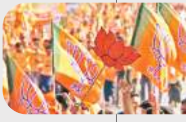
लाभुकों से किया जाएगा संपर्क

इस कार्यक्रम के तहत भाजपा के कार्यकर्ता केंद्र सरकार की उज्ज्वला योजना, स्वच्छ भारत मिशन के तहत शौचालय निर्माण, अटल पेंशन योजना, आयुष्मान योजना, स्वनिधि योजना और प्रधानमंत्री आवास जैसी योजनाओं के लाभुकों से मुलाकात भी करेंगे. इसके जरिये मतदाताओं को यह बताने की कोशिश की जाएगी कि जिस योजना ने उनकी जिंदगी में अहम बदलाव लाया है वह नरेंद्र मोदी सरकार की देन है. इसलिए देश और राज्य के विकास और गति देने के लिए फिर से मोदी की सरकार बनाएं.