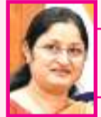
अनुरूपी देवी केंद्रीय शिक्षा मंत्री

66 इतने वर्षों के संघर्ष, इतने वर्षों की लड़ाई के बाद महिला सशक्तीकरण का अगर एक सूत्र पूछें तो मेरी नजर में यह जागरूकता है. राज्य व केंद्र सरकार की ओर से कई योजनाएं महिलाओं के हित में आईं. कई कानून महिलाओं के हित में बने हैं. अगर महिलाएं जागरूक हों तो अपने हक हासिल कर सशक्त हो सकती हैं. 99