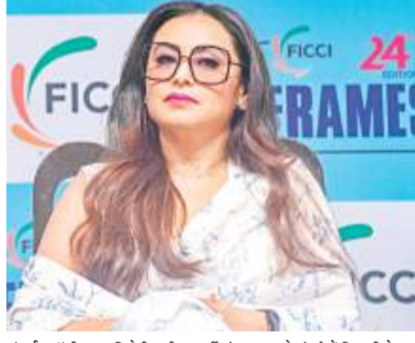
मुंबई। बॉलीवुड अभिनेत्री रानी मुखर्जी मंगलवार को मुंबई में फिक्की फ्रेम्स के 24वें संस्करण के उद्घाटन समारोह में शामिल हुईं.

बता दें कि स्विगी भारत की सबसे बड़ी और सबसे अधिक मूल्यवान ऑनलाइन फूड डिलीवरी ऐप है. इसकी स्थापना 2014 में हुई थी. इस कंपनी का हेडक्वार्टर बेंगलुरु में है. कंपनी का दावा है कि इस समय देश के 100 से भी ज्यादा शहरों में उसकी सेवा मिल रही है. सितंबर 2019 में, स्विगी ने एक्सिट पिचअप और ड्रॉप सेवा स्विगी गो लॉन्च किया है. इस सेवा का उपयोग विभिन्न प्रकार की वस्तुओं के लिए किया जाता है, जिसमें कपड़े धोने और दस्तावेज या पार्सल वितरण से लेकर व्यापारिक ग्राहक और खुदरा ग्राहक शामिल हैं.