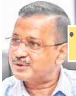
● दिल्ली सरकार का रु. 76,000 करोड़ का बजट पेश

दिल्ली की वित्त मंत्री आतिशी ने सोमवार को विधानसभा में वित्त वर्ष 2024-25 के लिए 76,000 करोड़ रुपए का बजट पेश किया। अपना पहला बजट पेश करते हुए आतिशी ने 'मुख्यमंत्री महिला सम्मान योजना' की घोषणा की, जिसके तहत 18 वर्ष और इससे अधिक आयु की सभी महिलाओं को हर माह 1,000 रुपए मिलेंगे। आतिशी ने कहा कि सरकार राम राज्य के आदर्शों से प्रेरित है। आम चुनाव से पहले राज्य विधानसभा में पेश किए गए बजट में उन्होंने 'बिजनेस ब्लास्टर्स' योजना का विस्तार विश्वविद्यालयों और औद्योगिक प्रशिक्षण संस्थानों (आईटीआई) तक करने की घोषणा की। अभी तक यह योजना स्कूलों में लागू की जा रही थी। पिछले साल सरकार ने वित्त वर्ष 2023-24 के लिए 78,800 करोड़ रुपए आवंटित किए थे और जौ20 की तैयारियों के तहत नौ योजनाओं की घोषणा की थी। दिल्ली सरकार के बजट का आकार वित्त वर्ष 2022-23 में 75,800 करोड़ रुपए और इससे पिछले वित्त वर्ष में 69,000 करोड़ रुपए था।