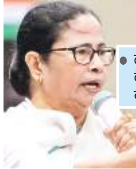
● टीएमसी ने कहां-केंद्रीय बलों पर दबाव न डाला जाए

टीएमसी ने सोमवार को निर्वाचन आयोग से यह तय करने का आग्रह किया कि केंद्रीय एजेंसीयों चुनावी प्रक्रिया को बाधित न करें। टीएमसी के प्रतिनिधिमंडल ने आयोग से यह भी पक्का करने की अपील की कि भाजपा केंद्रीय बलों पर दबाव न डाले। भाजपा नेता शुभेंदु अधिकारी को आदतन अपराधी बताते हुए टीएमसी ने आयोग से उन पर नजर रखने का अनुरोध किया। पार्टी ने मांग की कि बंगाल में 42 सीट पर चुनाव एक ही दिन में कराए जाएं, न कि चरणों में। यहां आयोग की पूर्ण पीठ से मिलने वाले पार्टी प्रतिनिधिमंडल ने कहा कि आयोग को वोट वाले दिन 11 वोटर आईडी पत्र स्वीकार करने चाहिए। मुख्य निर्वाचन आयुक्त राजीव कुमार की अगुवाई में निर्वाचन आयोग की टीम ने दलों के प्रतिनिधियों के साथ बैठके कीं। आयोग का दल प्रशासनिक अधिकारियों के साथ भी बातचीत करेगा। उन्होंने बताया कि वह मुख्य निर्वाचन अधिकारी आरिज आफताब, मुख्य सचिव बीपी गोपालिका और पुलिस महानिदेशक राजीव कुमार से भी मुलाकात करेगा।