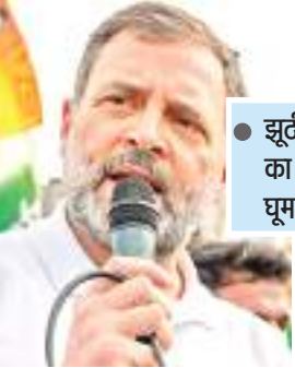
● झूठी गारंटियों का झोला लेकर घूम रहे हैं पीएम

कांग्रेस सांसद राहुल गांधी ने सोमवार को भाजपा पर संविदा व्यवस्था को लगातार बढ़ावा देने का आरोप लगाया और कहा कि विपक्षी गठबंधन इंडिया युवाओं के लिए 'नौकरी के बंद द्वार' खोलेगा। उन्होंने यह भी कहा कि गठबंधन ने सरकारी विभागों में रिक्त पदों को भरने के लिए टोस योजना तैयार की है। राहुल गांधी ने सोशल मीडिया मंच 'एक्स' पर पोस्ट किया कि युवाओं, एक बात नोट कर लो। टोस योजना तैयार की है। राहुल गांधी ने सोशल मीडिया मंच 'एक्स' पर पोस्ट किया कि युवाओं, एक बात नोट कर लो। मोदी की नीयत ही रोजगार देने की नहीं है। नए पद निकालना तो दूर वह केंद्र के खाली पड़े पदों पर भी कुंडली मार बैठे हैं। अगर संसद में पेश किए गए सरकार के आंकड़ों को ही मानें तो 78 विभागों में 9 लाख 64 हजार पद खाली हैं। राहुल ने दावा किया कि रेलवे में 2.93 लाख, गृह मंत्रालय में 1.43 लाख व रक्षा मंत्रालय में 2.64 लाख पद खाली हैं। क्या मोदी के पास इसका जवाब है कि 15 विभागों में 30% से अधिक पद खाली क्यों हैं? झूठी गारंटियों का झोला लेकर घूम रहे मोदी के अपने ही कार्यालय में बड़ी संख्या में पद खाली क्यों हैं?