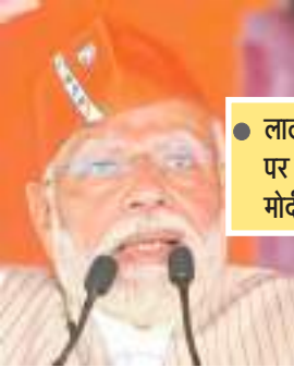
● लालू के परिवार पर हमले के बाद मोदी का पलटवार

पीएम नरेंद्र मोदी ने परिवार ना होने को लेकर राजद सुप्रीमो लालू प्रसाद के हमले पर पलटवार करते हुए सोमवार को पूरे भारत को अपना परिवार करार दिया और अपने जीवन को एक खुली किताब बताते हुए कहा कि लोगों की सेवा करने के सपने के साथ उन्होंने कम आयु में ही घर छोड़ दिया था। एक रैली को संबोधित करते हुए मोदी ने परिवारवादी दलों पर हमला बोला और कहा कि उनके अलग-अलग चेहरे हो सकते हैं, लेकिन झूठ और लूट का उनका चरित्र समान है। राजद के अध्यक्ष लालू प्रसाद ने रविवार को पटना में एक रैली को संबोधित करते हुए मोदी पर कटाक्ष किया था। मोदी ने लालू के इस आरोप पर सोमवार को पलटवार किया और कहा कि भ्रष्टाचार, परिवारवाद और तुष्टीकरण में आकंट डूबे इंडी गठबंधन के नेता बौखलाते जा रहे हैं। उन्होंने हुए, अब इन्होंने 2024 के चुनाव का अपना असली घोषणा पत्र निकाला है। मैं इनके परिवारवाद पर सवाल उठाता हूँ तो इन लोगों ने अब बोलना शुरू कर दिया है कि मोदी का कोई परिवार नहीं है। -पेज 12 भी देखें