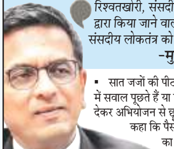
रिश्वतखोरी, संसदीय विशेषाधिकार नहीं है। माननीयों द्वारा किया जाने वाला भ्रष्टाचार और रिश्वतखोरी भारत के संसदीय लोकतंत्र को तबाह कर रहे हैं। -मुख्य न्यायाधीश डीवाई चंद्रचूड़

संविधान पीठ ने 1998 के झामुमो रिश्वतकांड पर दिए अपने फैसले पर पुनर्विचार के संबंध में सुनवाई पूरी कर बीते साल 5 अक्टूबर को अपना फैसला सुरक्षित रख लिया था। अक्टूबर में सुनवाई के दौरान केंद्र सरकार ने सुप्रीम कोर्ट में रिश्वत के बदले वोट के मामले में मिले विशेषाधिकार का विरोध किया था। सरकार ने भी अपनी दलील में कहा था कि रिश्वतखोरी कभी भी मुकदमे से छूट का विषय नहीं हो सकती। संसदीय विशेषाधिकार का मतलब किसी सांसद-विधेयक को कानून से ऊपर रखना नहीं है।