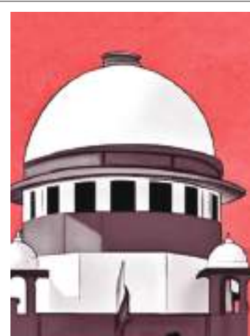
1993 पीवी नरसिम्हा राव सरकार के खिलाफ अविश्वास प्रस्ताव आया

सुप्रीम कोर्ट ने पलटा 1998 का पुराना फैसला