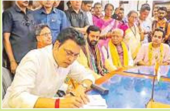
पश्चिम त्रिपुरा। भाजपा उम्मीदवार बिप्लब कुमार देब ने आगामी लोकसभा चुनाव के लिए त्रिपुरा के सीएम माणिक साहा, हरियाणा के सीएम नयब सिंह सेनी, पूर्व सीएम मनोहर लाल खड्ग के सामने नामांकन पत्र दाखिल किया।