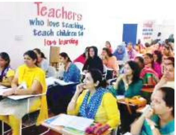
मुद्रक तथा प्रकाशक लगातार इंफोटेकनेट प्राइवेट लिमिटेड द्वारा लगातार इंफोटेकनेट प्राइवेट लिमिटेड के पक्ष में, सिमलिया, रिंग रोड, पीएस-रावू, रांची - 835222 से मुद्रित तथा राजकमल प्लाजा, रूम नंबर 102 जयप्रकाश नगर, डीनोवली स्कूल रोड बरटांड, धनबाद-826001 झारखंड द्वारा प्रकाशित।

बेसिक ट्रेनिंग सर्टिफिकेट कोर्स एक टीचर ट्रेनिंग प्रोग्राम है, जो व्यक्तियों को प्राइमरी स्कूल टीचर बनने के लिए तैयार करता है। इसे डिप्लोमा इन एलीमेंट्री एजुकेशन (डीईएलईईडी) कोर्स के रूप में भी जाना जाता है। यह प्रोग्राम आम तौर पर उन व्यक्तियों द्वारा किया जाता है, जो प्राइमरी स्कूल लेवल यानी कक्षा एक से आठवीं में पढ़ाने की इच्छा रखते हैं। हीटीसी/डीईएलईईडी कोर्स शैक्षिक सिद्धांतों, टीचिंग पोस्टर्स, चाइल्ड साइकोलॉजी और प्रैक्टिकल लर्निंग अनुभव पर केंद्रित है।