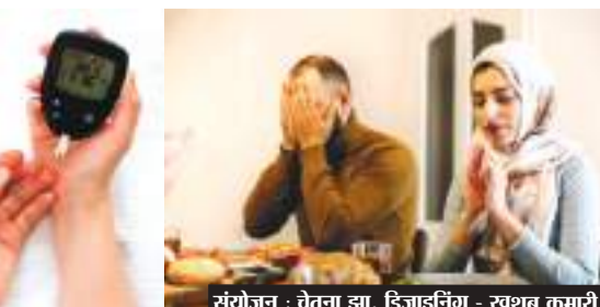
संयोजन - वेतना झा, डिजाइनिंग - खुशबू कुमारी