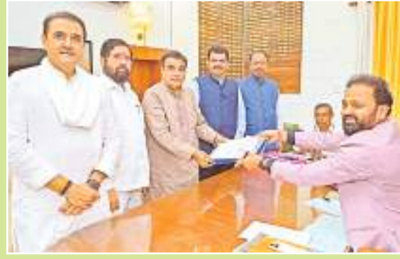
नागपुर। भाजपा उम्मीदवार नितिन गडकरी ने बुधवार को नागपुर में सीएम एकनाथ शिंदे और उपमुख्यमंत्री देवेंद्र फडणवीस की उपस्थिति में आगामी लोकसभा चुनाव के लिए अपना नामांकन पत्र दाखिल किया।