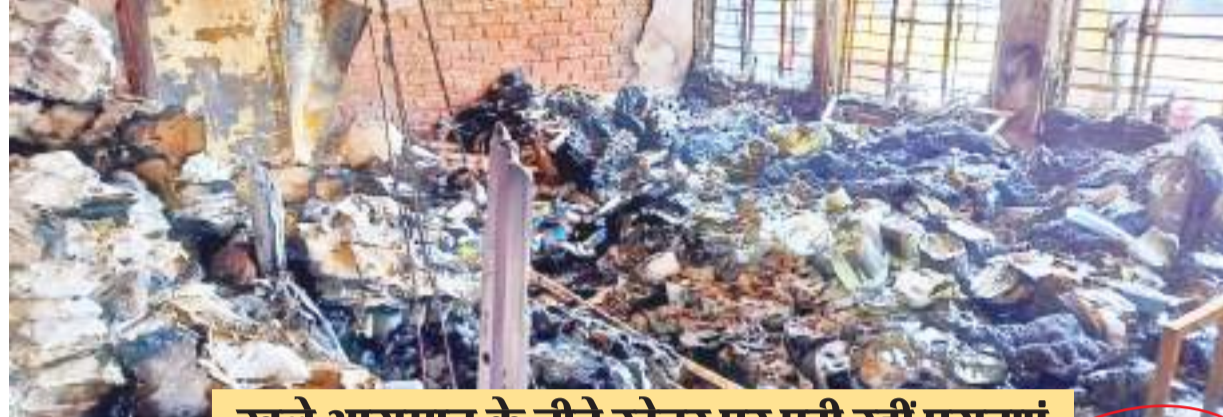
खुले आसमान के नीचे स्ट्रेचर पर पड़ी रहीं प्रसूताएं