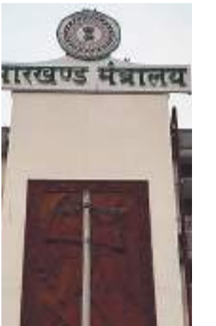
जिला में करना है।

लोकसभा चुनाव की तारीखों की घोषणा 10 मार्च के बाद कभी भी हो सकती है। वहीं प्रशासनिक अधिकारी चुनाव की तैयारी में युद्ध स्तर पर लगे हैं। हालांकि जिन अधिकारियों पर चुनाव कार्यों को संपन्न कराने की जिम्मेवारी होती है, उसमें से कई का तबादला चुनाव आयोग के नये निर्देश पर करना होगा। प्राप्त जानकारी के अनुसार इसकी तैयारी भी विभाग और कार्मिक के स्तर पर की जा रही है। आयोग के नये पत्र के अनुसार सर्किल अफसर रैंक के पुलिस अधिकारी एवं आरओ, एआरओ, डीवाईईओ रैंक के, प्रशासनिक रैंक के पदाधिकारी को एक ही संसदीय क्षेत्र में तबादला नहीं किया जाना है। साथ ही वैसे पदस्थापित पदाधिकारी जिसके लोकसभा क्षेत्र में गृह जिला शामिल है। उनका पदस्थापन दूसरे