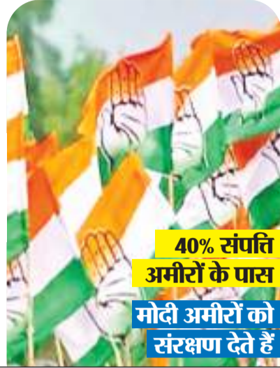
40% संपत्ति अमीरों के पास मोदी अमीरों को संरक्षण देते हैं