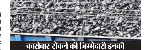
कारोबार रोकने की जिम्मेदारी इनकी संबंधित इलाके के थाना प्रभारी, संबंधित जिले के एसपी और संबंधित क्षेत्र के डीएसपी. प्रशासन : संबंधित जिला के उपपुक्त, संबंधित अनुमंडल के एसडीओ, संबंधित जिला के माइनिंग ऑफिसर और संबंधित इलाके के डीएसओ.

रामगढ़ जिले की कुजू साइडिंग में बड़े पैमाने पर मिक्सिंग का खेल चल रहा है. कोयला कारोबारियों द्वारा कोयला में चारकोल मिलाकर पावर प्लांट में भेजा जा रहा है. यह चारकोल बड़े पैमाने पर रामगढ़ के कुजू और घाटो स्थित इस्पात प्लांट से लाकर साइडिंग में गिराया जाता है. फिर कोयला का वजन बढ़ाने के लिए कोयला में चारकोल को मिलाकर पावर प्लांट भेज दिया जाता है. वहीं दूसरी तरफ साइडिंग का कोयला को स्थानीय प्लांट में खपाया जाता है. जानिए कैसे होती है कोयले की हेराफेरी : साइडिंग से कोयला कारोबारी बिना वैध चालान के कोयला को ट्रांसपोर्टिंग कर रहे हैं. जांच में खुलासा हुआ है कि कोयला कारोबारी साइडिंग के कर्मियों की मदद से बिना कोयला साइडिंग पर कोयला गिराकर पेपर रिसीव करा लेते हैं. फिर कोयला को कुजू ओपी क्षेत्र स्थित स्पंज प्लांट में भेजा जा रहा है और वहां अवैध कोयले का धुल्ले से उपयोग किया जा रहा है. जितना कोयला साइडिंग में बिना