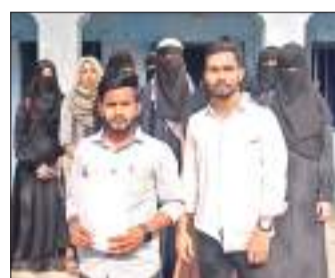
में विषय गलत लिखा हुआ है। परीक्षा भी नजदीक है, जिससे उन्हें परेशानी का सामना करना पड़ रहा है। इसको लेकर कोल्हान यूनिवर्सिटी के रजिस्ट्रार से विषय बदलने का आग्रह किया गया है।