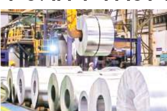
उत्पादन और खपत

निर्माण, बुनियादी ढांचे, ऑटोमोबाइल, इंजीनियरिंग और रक्षा जैसे महत्वपूर्ण क्षेत्रों में अहम भूमिका निभाने वाले भारत के स्टील क्षेत्र में वृद्धि दर्ज की गई है। देश में इस्पात के उत्पादन और खपत दोनों में भारी वृद्धि देखी गई है। प्रति व्यक्ति इस्पात की खपत वर्ष 2013-14 में 59 किलोग्राम से बढ़कर वर्ष 2022-23 में 119 किलोग्राम हो गई है। भारत ने वर्ष 2022-23 में 123 मिलियन टन इस्पात का उत्पादन किया है। इस्पात उत्पादन की क्षमता वर्ष 2012-13 में 97 मिलियन टन था जो वर्ष 2023-24 में बढ़कर 171.35 मिलियन टन हो गई है।