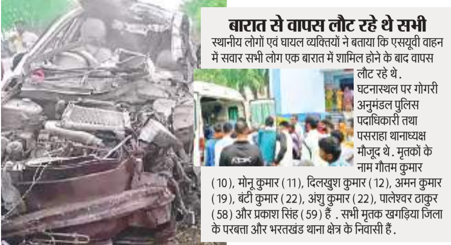
भारत से वापस लौट रहे थे सभी स्थानीय लोगों एवं घायल व्यक्तियों ने बताया कि एसयूवी वाहन में सवार सभी लोग एक बारात में शामिल होने के बाद वापस लौट रहे थे.

सोमवार की सुबह पांच बजकर करीब पंद्रह मिनट पर पसराहा थाना पुलिस को सूचना मिली कि राष्ट्रीय राजमार्ग संख्या 31 पर एक पेट्रोल पंप से लगभग 200 मीटर दूर सड़क दुर्घटना हुई है. बरिष्ठ पदाधिकारियों को सूचित कर पसराहा थाना पुलिस की टीम घटनास्थल पर पहुंची. घटनास्थल के निरीक्षण के दौरान पता चला कि चार पहिया एसयूवी वाहन एवं सीमेंट की बोरियों से लदे एक ट्रैक्टर के बीच टक्कर हो गई और फिर