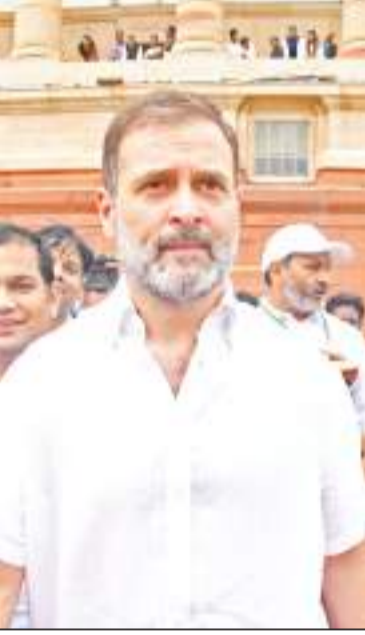
एजेंसी। नयी दिल्ली

राहुल गांधी ने सोमवार को 'एक्स' पर पोस्ट किया, मोदी जी को मेरी बातें अच्छी नहीं लगतीं, किसी न किसी तरह उन्हें घुमा कर वह उनका अर्थ हमेशा बदलने की कोशिश करते हैं क्योंकि वह जानते हैं कि मैंने एक गहरी सच्चाई बोली है। जिस शक्ति का मैंने उल्लेख किया, जिस शक्ति से हम लड़ रहे हैं, उस शक्ति का मुखौटा मोदी जी हैं। उन्होंने कहा, वह एक ऐसी शक्ति है जिससे आज, भारत की आवाज को, भारत की संस्थाओं को, सीबीआई, आयकर विभाग, इंडी, चुनाव आयोग, मीडिया, भारत के उद्योग जगत, और भारत के समूचे संवैधानिक ढांचे को ही अपने चंगुल में