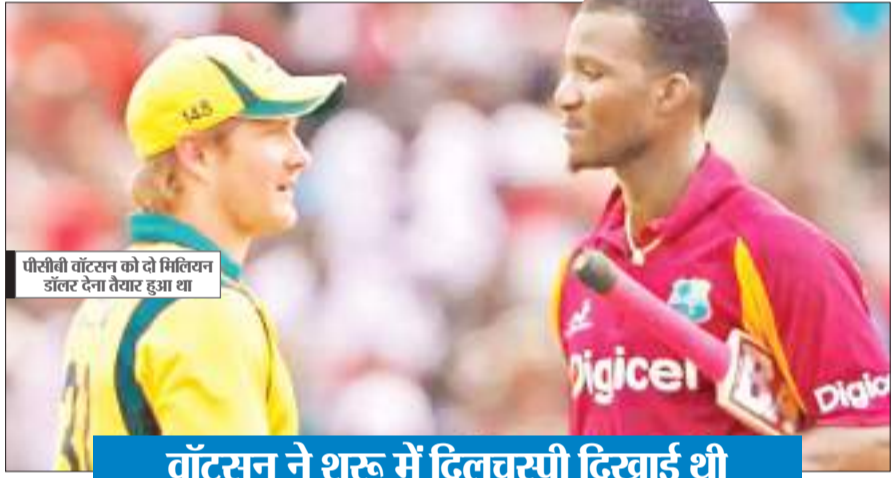
पीसीबी वॉटसन को दो मिलियन डॉलर देना तैयार हुआ था

अब डरेन सैमी ने पाकिस्तान टीम का हेड कोच बनने से पीछे हट गए. सैमी को पाकिस्तान क्रिकेट बोर्ड सीमित ओवरस क्रिकेट में टीम का हेड कोच बनाना था. सैमी ने पीसीबी को बताया कि वह पहले से ही वेस्टइंडीज बोर्ड के साथ सीमित ओवरस की टीम के मुख्य कोच के रूप में अनुबंधित हैं. सैमी की कप्तानी में वेस्टइंडीज ने 2012 और 2016 का टी20 वर्ल्ड कप जीता था. सैमी के इनकार के बाद पाकिस्तान क्रिकेट बोर्ड न्यूजीलैंड के खिलाफ 14 अप्रैल से शुरू होने वाली पांच मैचों की घरेलू टी20 सीरीज के लिए किसी घरेलू कोच को अंतरिम तौर पर नियुक्त कर सकता है.