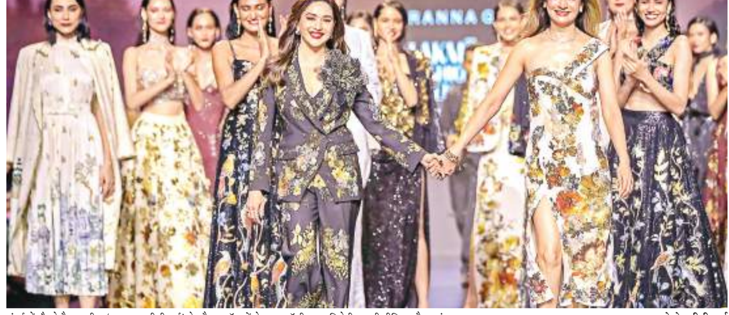
मुंबई में लैकमे फैशन वीक 'एक्स एफडीसीआई' के दौरान मॉडलों के साथ बॉलीवुड अभिनेत्री माधुरी दीक्षित और वसुंधरा.

नागरिकों को लेकर पहला विमान मियामी पहुंचा मियामी। हैती में बढ़ती गिरावट हिंसक के कारण देश छोड़कर जाने वाले कई अमेरिकी नागरिकों को लेकर एक 'चाट्टर' विमान मियामी पहुंच गया है. रविवार को उतरे सरकार चाट्टर विमान में 30 से अधिक अमेरिकी नागरिक थे. इस महीने की शुरुआत में पोर्ट-औ-प्रिंस में अमेरिकी दूतावास ने हैती में अराजकता के घबरेलें अमेरिकी नागरिकों से बितनी जल्दी हो सके हैती को छोड़ने का आग्रह किया था. जिसके बाद अब यह चाट्टर विमान मियामी अंतरराष्ट्रीय हवाई अड्डे पर पहुंचा है.