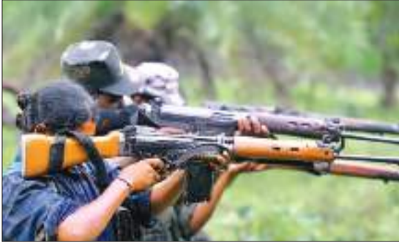
नक्सली होपना मांझी को दबोचने आई पुलिस के साथ यहां नक्सलियों

घोर नक्सल प्रभावित मनियाडीह के बस्ती कुल्ही में शुक्रवार को करीब दो दर्जन नक्सलियों ने बैठक की. इस दौरान नक्सलियों ने पुलिस के लिए एसपीओ का काम करने वालों को चेताया कि यदि वे बाज नहीं आए तो उनका सिर कलम कर दिया जाएगा. नक्सलियों की इस बैठक को चुनाव में माहौल बिगाड़ने की कोशिश के रूप में देखा जा रहा है. बताते चलते कि पूर्व में भी यहां पर कई बड़ी नक्सली वारदातें हो चुकी हैं. हार्डकोर