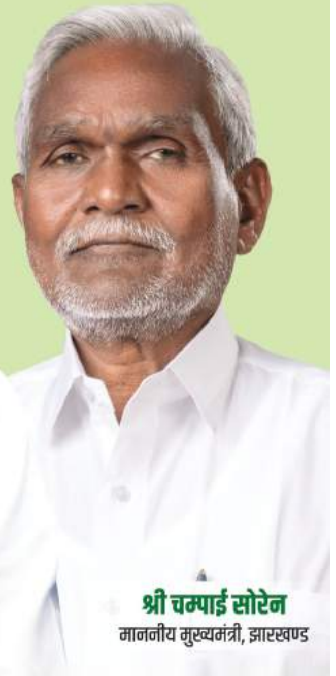
श्री चम्पाई सोरेन माननीय मुख्यमंत्री, झारखण्ड