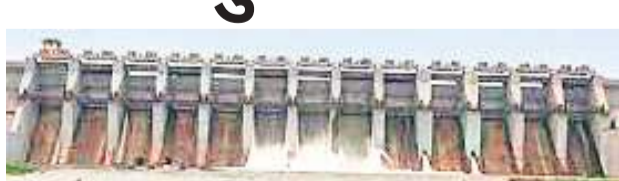
प्रमुख संवाददाता। रांची

जमशेदपुर व समीपवर्ती इलाकों में पीने के लिए शुद्ध पानी की आपूर्ति सीधे चांडिल डैम से होगी। इस बारे में जल संसाधन विभाग के मंत्री बसंत सोरेन स्वयं जमशेदपुर जायेंगे और टाटा स्टील सहित अन्य सक्षम प्राधिकारों के साथ बैठक कर आगे की कार्रवाई करेंगे। यह आश्वासन जल संसाधन विभाग के मंत्री बसंत सोरेन ने विधायक सरयू राय के अल्पसूचित प्रश्न का उत्तर देने के