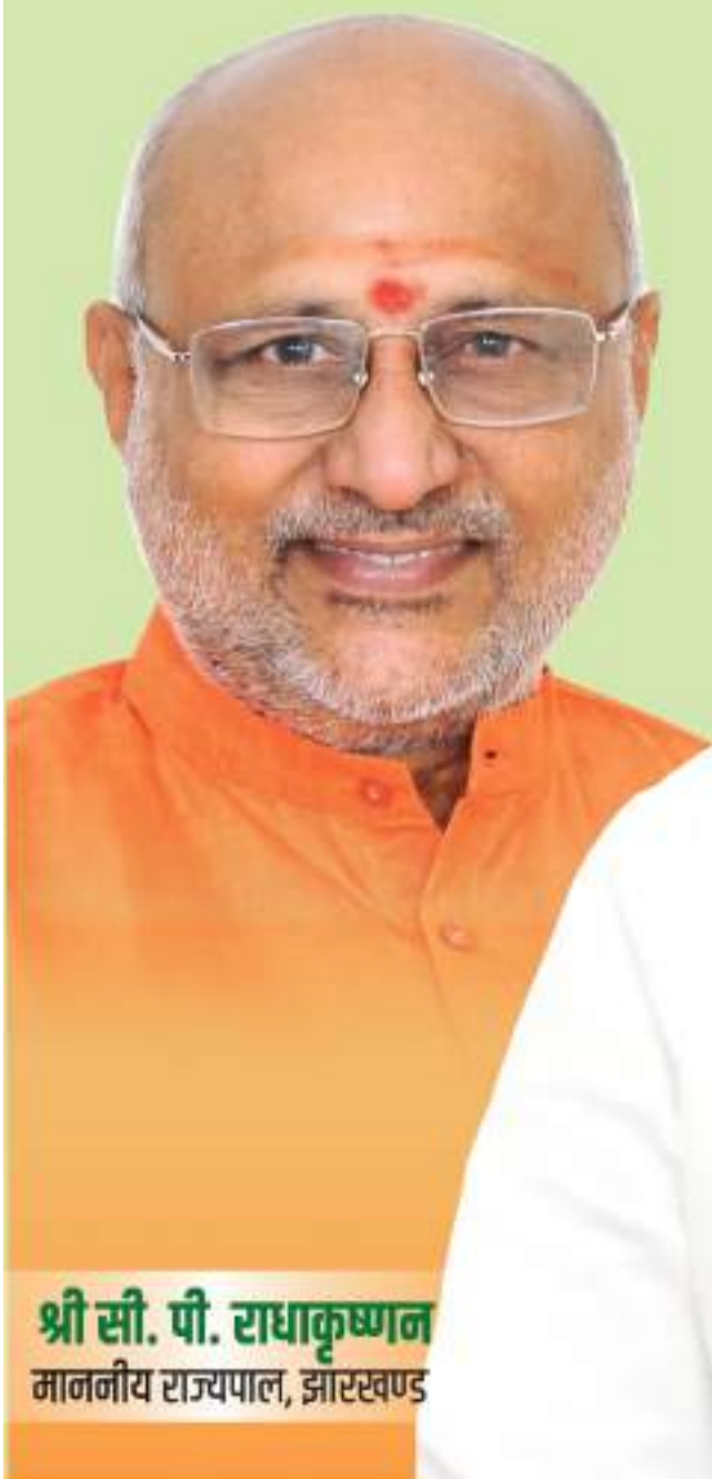
श्री सी. पी. राधाकृष्णन माननीय राज्यपाल, झारखण्ड