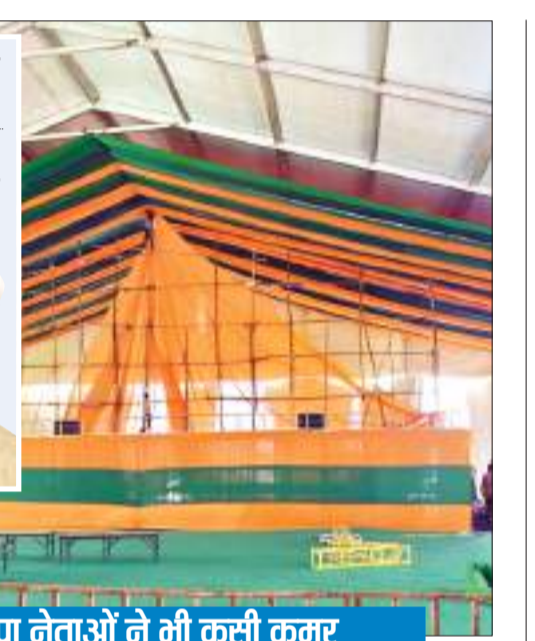
विभिन्न स्थानों पर रहेगी वाहनों की नो इंट्री