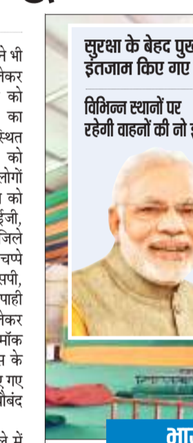
सुरक्षा के बेहद पुख्ता इंतजाम किए गए हैं

संवाददाता । धनबाद जिला प्रशासन, एसपीजी के साथ भाजपा ने भी प्रधानमंत्री नरेंद्र मोदी के कार्यक्रम को लेकर अपनी तैयारी पूरी कर ली है. शुक्रवार को प्रधानमंत्री पहले सिंदरी स्थित हर्ल का उद्घाटन करेंगे, इसके बाद बरवाअड्डा स्थित हवाई अड्डा में एक विशाल जनसभा को संबोधित करेंगे. इस सभा में एक लाख लोगों की भीड़ जुटने की संभावना है. कार्यक्रम को लेकर डीजीपी, चीफ सेक्रेटरी, आईजी, डीआईजी तक चौकस बने हुए हैं. दूसरे जिले आए करीब 8000 पुलिस बल जिले के चपे चपे पर तैनात किए गए हैं. जिसमें 12 एसपी, 58 डीएसपी एवं इंस्पेक्टर से लेकर सिपाही शामिल हैं. पीएम के कार्यक्रम को लेकर शुक्रवार को वायु सेना के हेलीकॉप्टर द्वारा मॉक ड्रिल भी की गयी. पूरे शहर में बैरिकेड्स के साथ साथ विभिन्न स्थानों पर नो एंट्री बनाए गए हैं. पीएम की सुरक्षा को लेकर चाक चौबंद व्यवस्था की गई है.