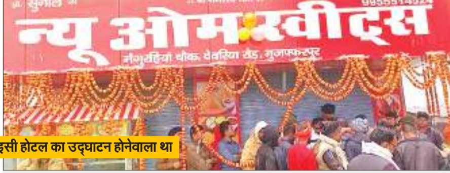
इसी होटल का उद्घाटन होनेवाला था

घटना पारु थाना क्षेत्र स्थित ओम स्वीट्स (लाइन होटल) की है। गोलीबारी से पूरे इलाके में सनसनी फैल गई। वहीं सीसीटीवी के आधार पर पुलिस मामले में आगे की कार्रवाई में जुटी हुई है और अपराधियों की गिरफ्तारी में छापेमारी कर रही है। परिजनों का कहना है कि पुलिस इस मामले को गंभीरता से ले और आरोपियों को