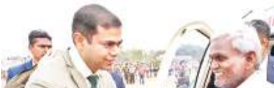
खनिज संसाधनों का नहीं मिल रहा अपेक्षित लाभ

सीएम चंपाई सोरेन ने कहा है कि राज्य के बुनियादी ढांचे को मजबूत करने के लिए सरकार प्रतिबद्ध है. राज्य के सभी औद्योगिक क्षेत्रों में बिजली-पानी, सड़क समेत तमाम आधारभूत संरचनाओं को मजबूत किया जाएगा. यहां औद्योगिक समूहों को सरकार की ओर से कई रियायत तथा सुविधाएं दी जाएंगी. लेकिन तमाम कंपनियों और संस्थानों को यह सुनिश्चित करना होगा कि स्थानीयों को 75 प्रतिशत नौकरी दें. राज्य सरकार ने इस बाबत जो कानून बनाया है, उसका हर हाल में पालन करना होगा. मुख्यमंत्री ने यह भी कहा कि युवाओं को रोजगार देने के लिए राज्य सरकार समुचित कदम उठा रही है. वे बुधवार को सरायकेला-खरसावां के गम्हरिया प्रखंड स्थित अपने पैतृक गांव जिलिंगगोड़ा में मीडिया से बातचीत कर रहे थे.