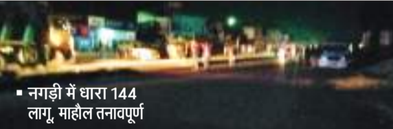
नगड़ी में धारा 144 लागू, माहौल तनावपूर्ण

नगड़ी में मूर्ति विसर्जन करने जा रहे जुलूस पर पथराव हुआ। घटना एक धार्मिक स्थल के पास हुई। शुक्रवार की रात सरस्वती प्रतिमा के साथ मूर्ति विसर्जन के लिए जा रहे जुलूस पर अचानक कुछ शरारती तत्वों ने पथराव कर दिया, जिससे अफरा-तफरी मच गयी। देखते ही देखते स्थिति तनावपूर्ण हो गई और दो पक्षों के लोग आमने-सामने हो गए। घटना की सूचना मिलते ही पुलिस के वरिय अधिकारी समेत सैकड़ों की