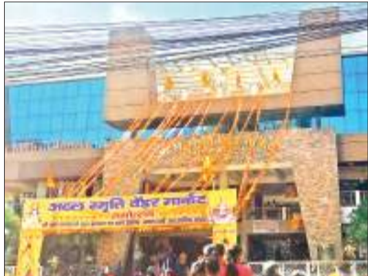
शहर में कहां-कहां वेंडर मार्केट बनाने की है तैयारी

राजधानी रांची में लगभग 13 हजार फुटपाथ दुकानदार हैं, जो शहर के अलग-अलग इलाकों में सड़क किनारे फुटपाथ पर अपनी दुकानें लगा कर जीविकोपार्जन करते हैं। सड़क किनारे जितने बड़े एरिया में दुकानें सजाते हैं, उससे लगभग दुगुना एरिया में ग्राहक व उनके वाहन खड़े रहते हैं, जिससे सड़क संकरी हो जाती है। नतीजतन रुक-रुक कर जाम लगता रहता है। ऐसी स्थिति शहर के हर प्रमुख सड़क की है। एमजी रोड, कचहरी रोड, सरकुल रोड, ओल्ड एचबी रोड, एचबी रोड, डॉ कमिल बुल्के पथ सहित अन्य प्रमुख सड़कें फुटपाथ दुकानदारों की वजह से जाम रहती हैं। एक तो फुटपाथ पर दुकानें, दूसरे सुबह ऑफिस व स्कूल टाइम होने की वजह से वाहनों का दबाव ज्यादा रहता है।