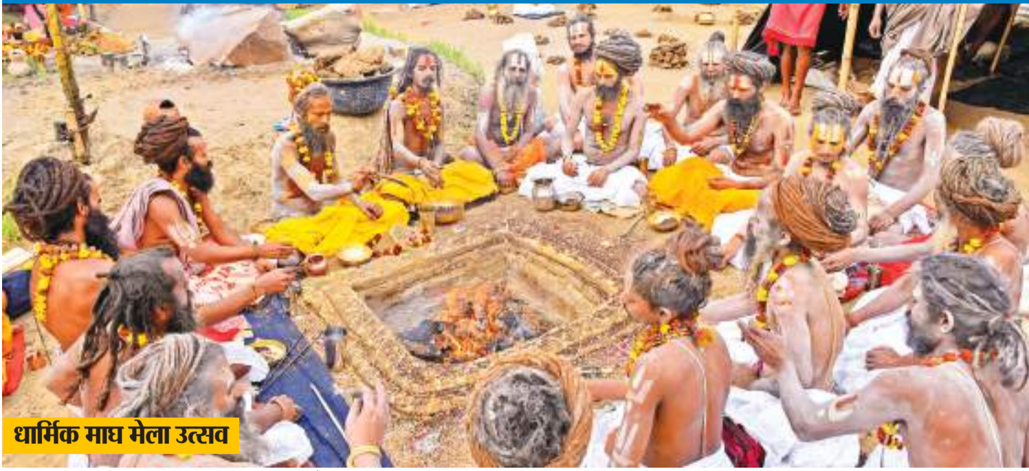
धार्मिक माघ मेला उत्सव

प्रयागराज : संगम में वार्षिक धार्मिक माघ मेला उत्सव के दौरान अचला सप्तमी के अवसर पर हवन करते साधु.