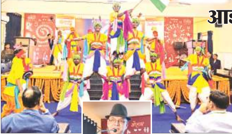
पर्यटन को और आगे बढ़ाने के लिए योजनाओं पर हुआ मंचन