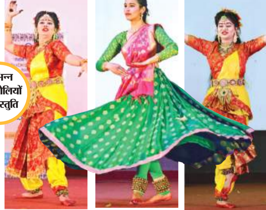
विभिन्न नृत्य शैलियों की प्रस्तुति

इन कॉलेजों से आए छात्रों ने अलग-अलग इवेंट में अपना कौशल दिखाया। इस यूथ फेस्ट के संचालन के लिए छह सदस्यीय कल्चरल कोर कमेटी और प्राध्यापकों की एक दस सदस्यीय समन्वयक टीम बनाई गई है। पहले दिन आर्यभट्ट सभागार में डॉस इवेंट और झारखंड की विभिन्न नृत्य शैलियों की प्रस्तुति दी। वहीं पीएफए डिपार्टमेंट में पोस्टर मेकिंग, रंगोली, मेहंदी जैसे इवेंट में अपना प्रदर्शन किया। आइएएस विभाग में शास्त्रीय संगीत समेत अन्य प्रकार के संगीत के घुन छात्रों ने सजाए। मास कॉम डिपार्टमेंट में काव्य पाठ, डिबेट और स्पाट फोटोग्राफी इवेंट का आयोजन हुआ। 10 फरवरी को रीज़ रंग में विज, वन एक्ट प्ले,स्किट्स, माइम, मिमिक्री, स्पाट पेंटिंग, कोलाज, क्ले मॉडलिंग, इंटरलेसन जैसे इवेंट आयोजित किये जायेंगे।