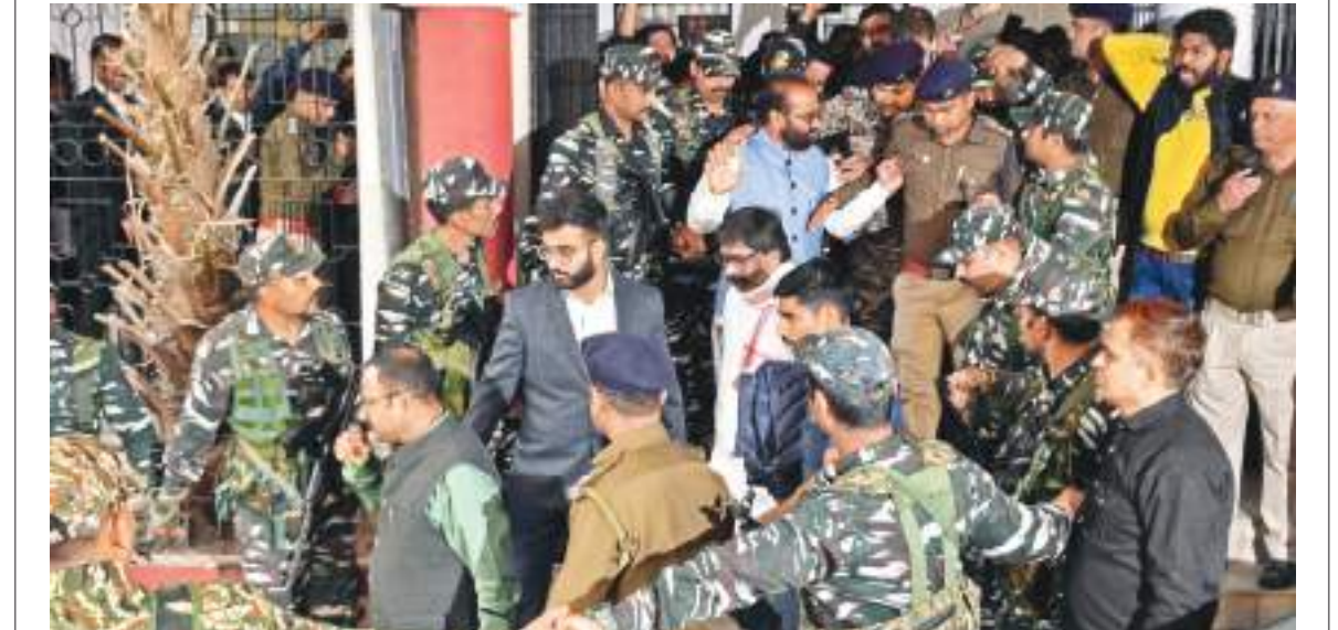
बुधवार को रांची स्थित पीएमएलए कोर्ट परिसर में सुरक्षा बलों के घेरे में आये पूर्व मुख्यमंत्री हेमंत सोरेन। यहां कोर्ट में उनकी ईडी की हिरासत अर्थात् को लेकर सुनवाई हुई। वे इसी तरह परिसर में आए और फिर वापस भी गए।