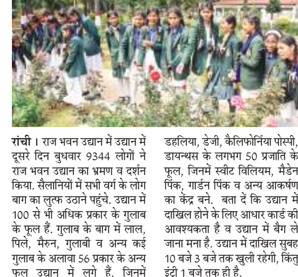
डहलिया, डेजी, कैलिफोर्निया पोस्मी, डायथस के लगभग 50 प्रजाति के फूल, जिनमें स्वीट विलियम, मैडेन पिक, गार्डन पिक व अन्य आकर्षण का केंद्र बने। बता दें कि उद्यान में दाखिल होने के लिए आधार कार्ड की आवश्यकता है व उद्यान में बैग ले जाना मना है। उद्यान में दाखिल सुबह 10 बजे 3 बजे तक खुली रहेगी, किंतु इंद्री 1 बजे तक ही है।

रांची। राज भवन उद्यान में उद्यान में दूसरे दिन बुधवार 9344 लोगों ने राज भवन उद्यान का भ्रमण व दर्शन किया। सैलानियों में सभी वर्ग के लोग का केंद्र बने। बता दें कि उद्यान में 100 से भी अधिक प्रकार के गुलाब के फूल हैं। गुलाब के बाग में लाल, पिले, मैरून, गुलाबी व अन्य कई गुलाब के अलावा 56 प्रकार के अन्य फूल उद्यान में लगे हैं, जिनमें