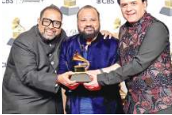
भारतीय फ्यूजन बैंड 'शक्ति' को 'बेस्ट ग्लोबल म्यूजिक एल्बम' का अवार्ड