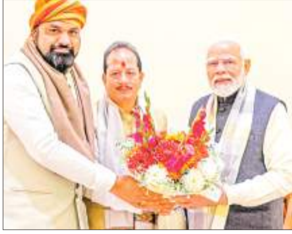
उनका आशीर्वाद एवं मार्गदर्शन प्राप्त किया राष्ट्र की उन्नति को समर्पित

सम्राट चौधरी ने अपने आधिकारिक 'एक्स' हैंडल पर लिखा, देश के यशस्वी प्रधानमंत्री नरेंद्र मोदी जी से मुलाकात कर