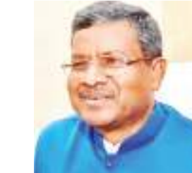
अटल जी के नेतृत्व में भाजपा सरकार ने केवल अलग राज्य नहीं दिया, बल्कि केंद्र में अलग

भाजपा अंत्योदय के संकल्पों के साथ तेजी से आगे बढ़ रही है. भाजपा सरकार की योजनाएं आदिवासी, दलित, पिछड़े वर्ग के कल्याण के लिए समर्पित है, जिसे जनता महसूस कर रही है. प्रधानमंत्री आवास, जन धन योजना, आयुष्मान योजना, उज्जवला योजना, शौचालय निर्माण, पीएम विश्वकर्मा योजना जैसी कल्याणकारी योजनाएं इन्हीं वर्गों को लाभान्वित कर रही हैं.