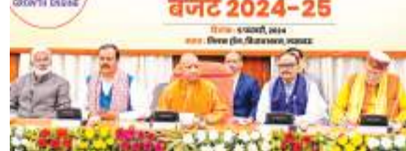
लखनऊ

उत्तर प्रदेश के मुख्यमंत्री योगी आदित्यनाथ ने सोमवार को कहा कि राज्य विधानसभा में पेश किया जाने वाला राज्य का बजट नये उत्तर प्रदेश में 'रामराज्य' की नींव रखेगा. मुख्यमंत्री योगी ने सोमवार को सोशल