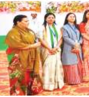
एचईसी बचाओ मजदूर जन संघर्ष समिति ने राहुल गांधी से की मुलाकात