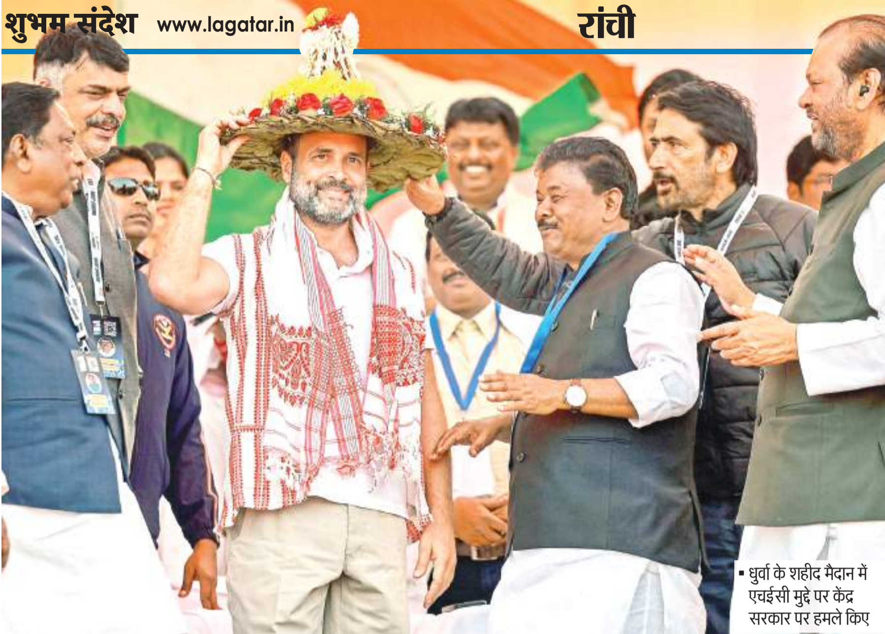
धुर्वा के शहीद मैदान में एचईसी मुद्दे पर केंद्र सरकार पर हमले किए