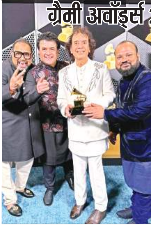
शुभम संदेश डेस्क

दुनिया के सबसे सम्मानित म्यूजिक अवार्ड्स कहे जाने वाले 66वें ग्रेमी अवार्ड्स 2024 का आयोजन लॉस एंजिल्स के क्रिस्टो डॉट कॉम एरीना में 5 फरवरी को संपन्न हुआ. ग्रेमी अवार्ड्स 2024 में भारत की झोली में दो अवार्ड्स आये. भारतीय फ्यूजन बैंड 'शक्ति' को उनके लेटेस्ट म्यूजिक एल्बम 'दिस मोमेंट के लिए' 'बेस्ट ग्लोबल म्यूजिक एल्बम' का अवार्ड मिला. 'शक्ति' बैंड ने 45 साल बाद अपना पहला एल्बम रिलीज किया था. इस बैंड में शंकर महादेवन, जॉन मैकलॉलिन, जाकिर हुसैन, वी सेल्वागणेश और गणेश राजगोपालन जैसे टैलेन्टेड कलाकार हैं. इसके अलावा बांसुरी वादक राकेश चौरसिया ने भी दो ग्रेमी अवार्ड्स जीते हैं.