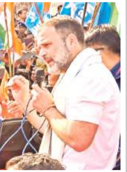
भारत जोड़ो न्याय यात्रा : रोड शो के दौरान धनबाद में लोगों को संबोधित करते कांग्रेस नेता राहुल गांधी,