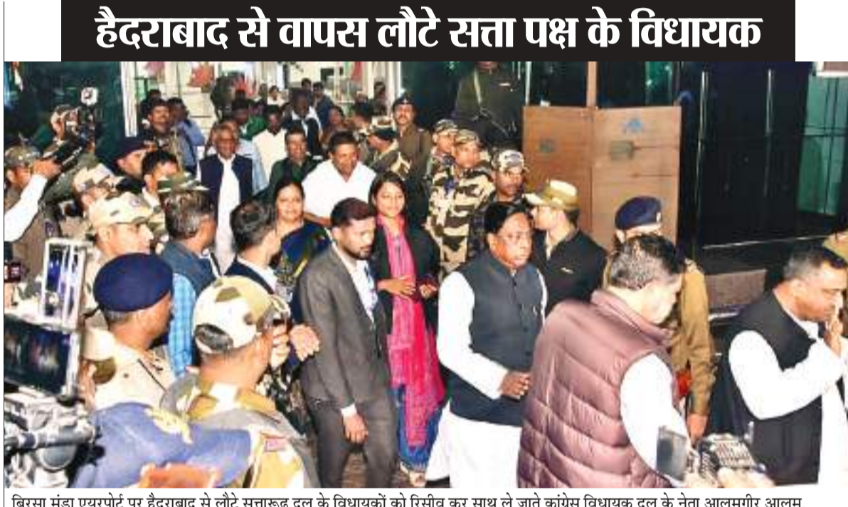
हैदराबाद से वापस लौटे सत्ता पक्ष के विधायक