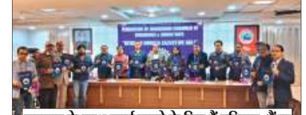
सरकार के साथ कार्य करने के लिए हैं प्रतिबद्ध: चैंबर