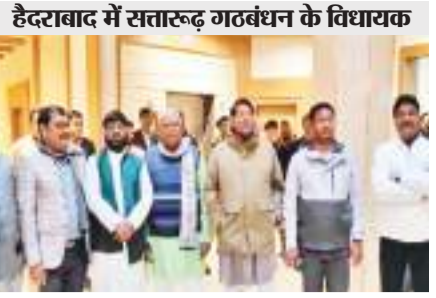
हैदराबाद में सतारूढ़ गठबंधन के विधायक

परिंदा भी नहीं मार सकता पर चप्पे-चप्पे पर पुलिस के जवान हैं तैनात