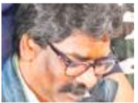
सौरभ सिंह/विनीत उपाध्याय | रांची

पूर्व सीएम हेमंत सोरेन को कोर्ट से फ्लोर टेस्ट के लिए सोमवार को होने वाली वोटिंग में शामिल होने की कोर्ट से अनुमति मिल गयी है. दरअसल 5 फरवरी (सोमवार) को फ्लोर टेस्ट में हेमंत के शामिल होने को लेकर पीएमएलए कोर्ट में अर्जी दाखिल की गयी. अर्जी में कहा गया कि राज्यपाल ने सोमवार को सुबह 11 बजे चंपई सोरेन सरकार के विश्वास मत के लिए समय तय किया है. हेमंत अभी ईडी की न्यायिक हिरासत में हैं. इसलिए उन्हें 5 फरवरी को 11 बजे एक घंटे के लिए विधानसभा सत्र में विश्वास मत के दौरान उपस्थित रहने की अनुमति दी जाए. इस अनुमति के लिए हेमंत सोरेन के अधिवक्ता ने कोर्ट में पूर्व में पारित किये गये कई आदेश पेश किये. ईडी के विशेष जज दिनेश राय की कोर्ट ने अर्जी पर सुनवाई करते हुए हेमंत को विश्वास मत के दौरान सुबह 11 बजे विधानसभा में उपस्थिति सुनिश्चित करने का निर्देश दिया. हेमंत की ओर से महाधिवक्ता राजीव रंजन ने पक्ष रखा. बताते चलें कि हेमंत पांच दिनों के ईडी के रिमांड पर हैं. ईडी ने हेमंत सोरेन को 31 जनवरी को रात गिरफ्तार किया था.