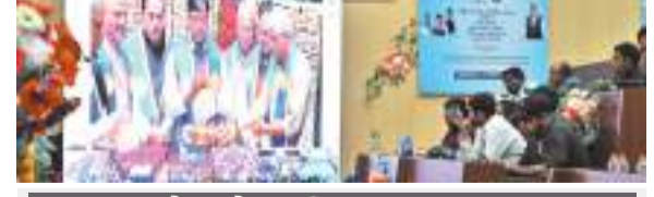
इन सेवाओं का किया गया उद्घाटन

अखिल भारतीय आयुर्विज्ञान संस्थान (एम्स) देवघर दिन प्रतिदिन अपनी सेवाओं के विस्तार में तत्परता से लगा हुआ है। इसी क्रम में शनिवार को एम्स देवघर स्थित महिला छात्रावास (गर्ल्स हॉस्टल), एमआरआई (3 टेस्ला) व रोगी आहार सेवाओं का उद्घाटन केंद्रीय स्वास्थ्य मंत्री डॉ. मनसुख मंडविया ने वचुअल माध्यम से किया। गर्ल्स हॉस्टल एक ओर जहां छात्राओं को आवास की सुविधा प्रदान करेगा। वहीं दूसरी ओर एमआरआई व रोगी आहार सेवाओं की शुरुआत होने से मरीजों को इसका लाभ मिलेगा।