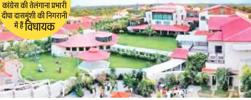
कांग्रेस की तेलंगाना प्रभारी दीपा दासमुंशी की निगरानी में हैं विधायक

शुभम संदेश नेटवर्क। रांची/ हैदराबाद झारखंड के विधायकों को हार्स ट्रेडिंग से बचाने के लिए हैदराबाद के रिजॉर्ट में रखा गया है। यहां उनके खानपान के लिए अलग स्थान रखा है। कमरों की पहरेदारी की खातिर जवान तैनात किये गए हैं। विधायक 2 फरवरी को रांची से विशेष विमान से यहां पहुंचे थे, उन्हें शाम 9 बजे के लियोनिया होलिस्टिक रेस्टोरेशन ले जाया गया। सप्ताह के 37 विधायकों को कांग्रेस की तेलंगाना प्रभारी दीपा दासमुंशी की निगरानी में ओ बिज ब्लॉक में ठहराया गया है। अनधिकृत प्रवेश को रोकने के लिए व्यापक तैयारी की गई है। रिजॉर्ट में जिस तल पर विधायकों का ठहराया