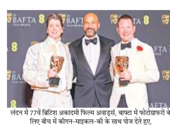
लंदन में 77वें ब्रिटिश अकादमी फिल्म अवार्ड्स, बाफ्टा में फोटोग्राफरों के लिए बीच में कोगन-माइकल-की के साथ पोज देते हुए.

223.68 लाख टन चीनी का हुआ उत्पादन नई दिल्ली। देश में चालू चीनी विपणन वर्ष 2023-24 में 15 फरवरी, 2024 तक चीनी का उत्पादन 223.68 लाख टन रहा है. पिछले चीनी विपणन वर्ष के दौरान 229.37 लाख टन चीनी उत्पादन हुआ था. एक साल पहले की समान अवधि की तुलना में चीनी के उत्पादन में 5.69 लाख टन की गिरावट आई है. चीनी मिलों के संगठन इंडियन शुगर मिल एसोसिएशन (इस्मा) ने सोमवार को जारी बयान में बताया कि चीनी