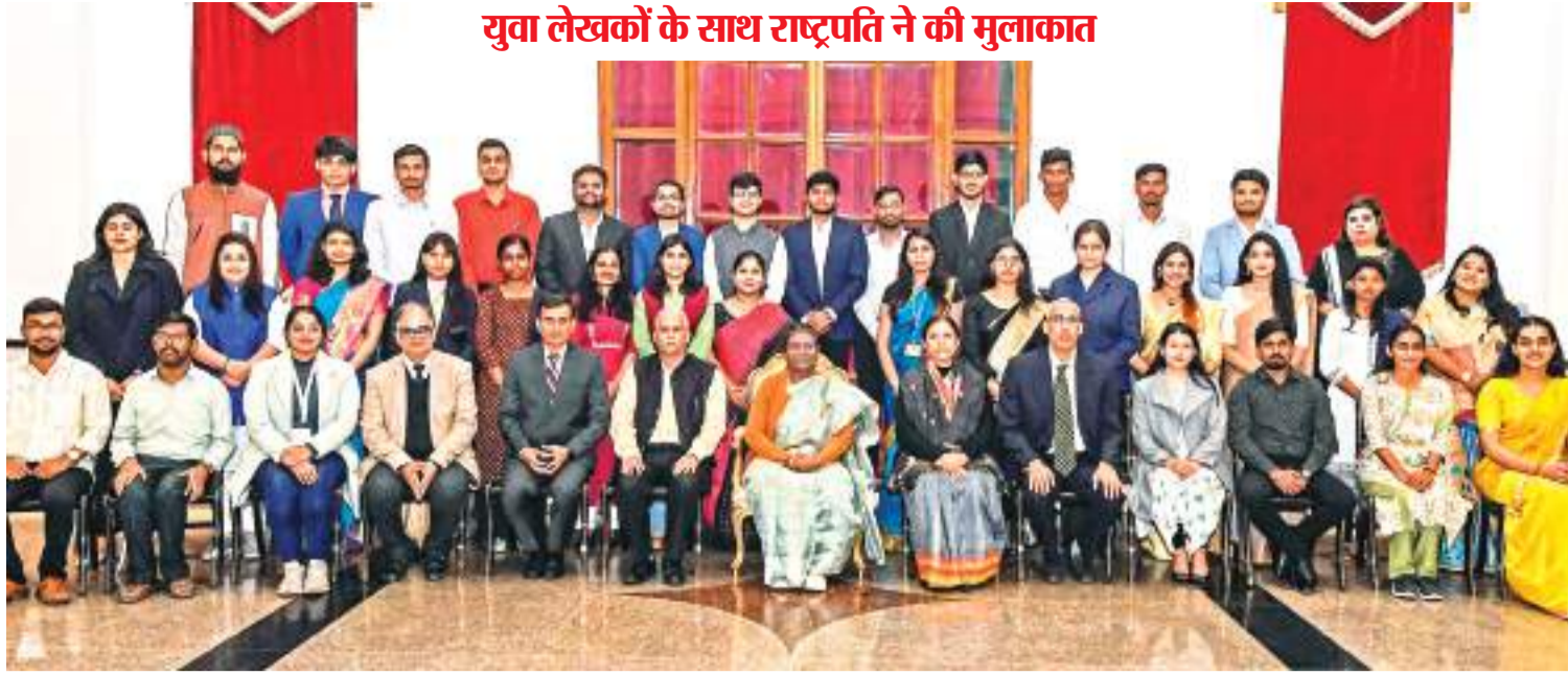
लेखकों से मुलाकात : राष्ट्रपति द्रौपदी मुर्मू ने नयी दिल्ली में पीएम युवा लेखकों के साथ मुलाकात.