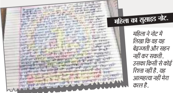
महिला का सुसाइड नोट.