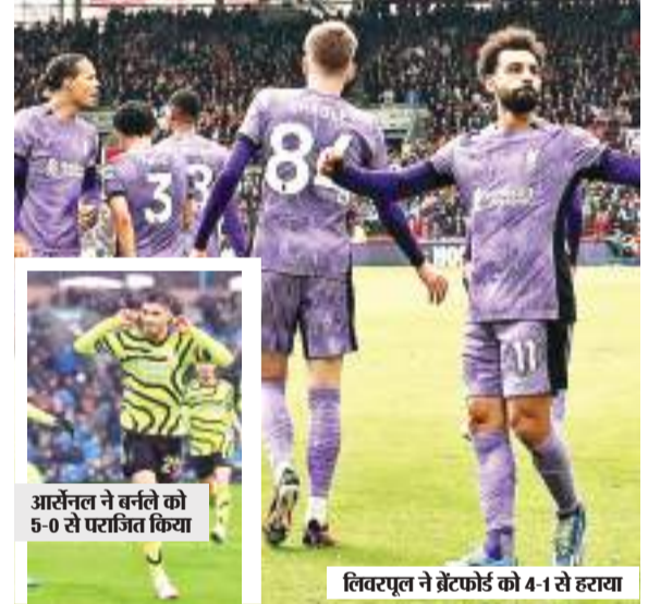
आर्सेनल ने वर्नले को 5-0 से पराजित किया