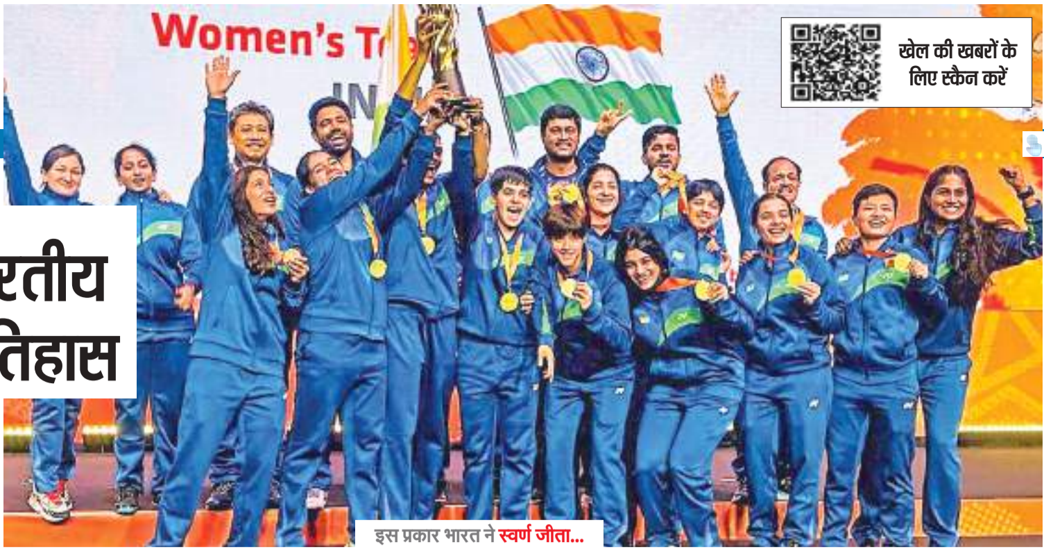
इस प्रकार भारत ने स्वर्ण जीता...

उसका चीन के चेंगदू में 28 अप्रैल से 5 मई तक होने वाले उबर कप के लिए मनोबल बढ़ेगा. भारत ने इससे पहले इस प्रतियोगिता में दो पदक जीते थे. भारतीय पुरुष टीम ने 2016 और 2020 में कांस्य पदक हासिल किए थे. थाईलैंड हालांकि अपनी दो चोट्टी की खिलाड़ियों विश्व में नंबर 13 रतचानोक इंतानोन और विश्व में नंबर 16 पोर्नपावी चोचुवोंग के बिना इस प्रतियोगिता में उतरा था जिसका भारत को फायदा मिला.