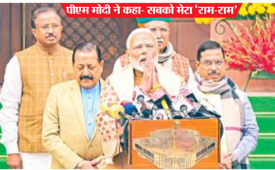
पीएम मोदी ने कहा- सबको मेरा 'राम-राम'

लोकतांत्रिक मूल्यों को बिगाड़ने वाले आत्मनिरीक्षण करें : प्रधानमंत्री ने विपक्षी सांसदों पर संसदीय कार्यवाही को बार-बार बाधित करने का आरोप लगाते हुए कहा कि जो लोग हंगामा करने और लोकतांत्रिक मूल्यों को बिगाड़ने के आदी हैं, उन्हें आगामी चुनाव से पहले हो रहे इस अंतिम सत्र के दौरान आत्मनिरीक्षण करना चाहिए. उन्होंने कहा कि आदतन हुड़दंग करना जिनका स्वभाव बन गया है और जो लोकतांत्रिक मूल्यों का आदतन चौराहण करते हैं, ऐसे सभी सांसदों को आत्मनिरीक्षण करना चाहिए.