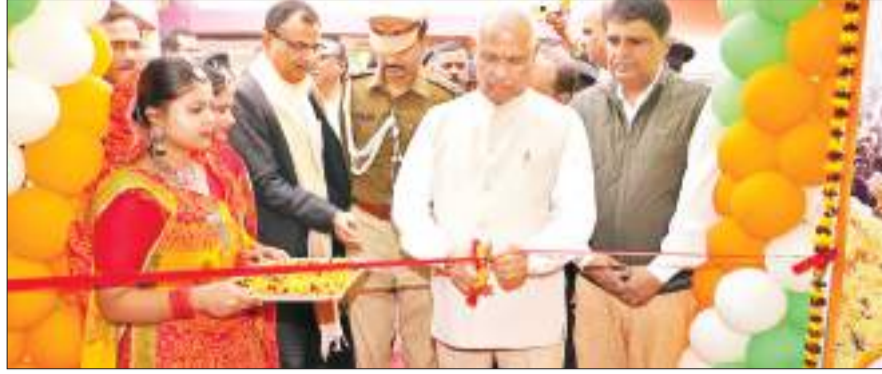
रहा है और हमारी मुद्रा मजबूत हो रही है. आत्मनिर्भरता के लिए स्वदेशी वस्तुओं का उपयोग अत्यंत आवश्यक है. भारत को विकसित व आत्मनिर्भर बनाने के लिए राष्ट्रीय शिक्षा नीति,

युवाओं के परिश्रम, ऊर्जा और प्रतिभा से ही वर्ष 2047 तक भारत विकसित बनेगा. आनेवाला कल हमारे युवाओं पर ही निर्भर है. वे देश का वर्तमान भी बना रहे हैं और भविष्य भी बनायेंगे. राज्यपाल राजेंद्र विश्वनाथ आलेंकर ने रवीन्द्र भवन में नेहरू युवा केंद्र संगठन द्वारा आयोजित राज्य स्तरीय युवा उत्सव के उद्घाटन के अवसर पर उक्त बातें कहीं. उन्होंने कहा कि भारत को विकसित बनने के लिए इसे आत्मनिर्भर बनना होगा. इसके लिए हमारी अर्थव्यवस्था व मुद्रा मजबूत होनी चाहिए. यह प्रसन्नता की बात है कि अनेक देशों के साथ हमारे देश का व्यापार यहाँ की मुद्रा 'रुपया' में हो