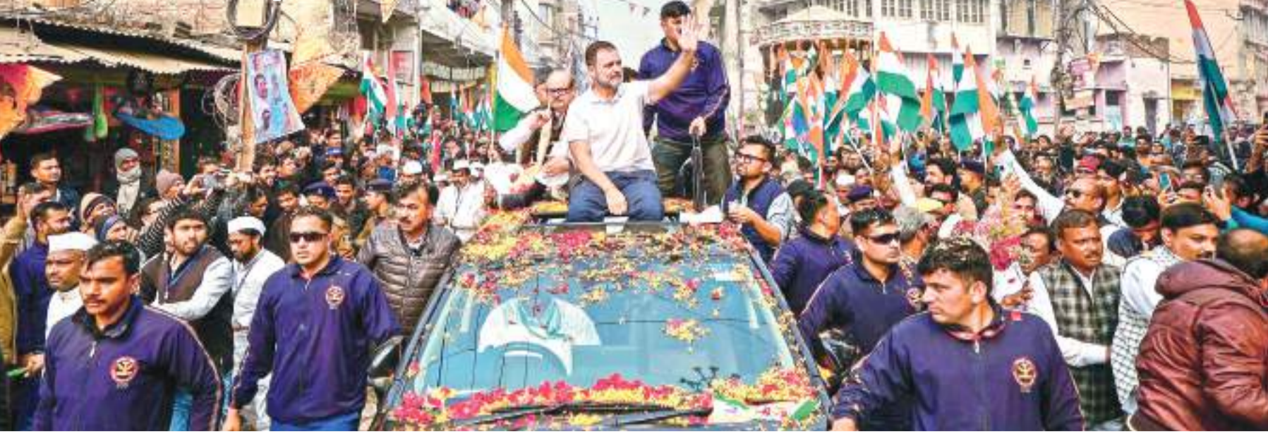
बुधवार को बिहार के कटिहार में भारत जोड़ी न्याय यात्रा के दौरान समर्थकों का अभिवादन करते हुए कांग्रेस नेता राहुल गांधी. इस दौरान राहुल गांधी के समर्थन में सड़क पर कांग्रेस समर्थकों की भारी भीड़ दिखी.