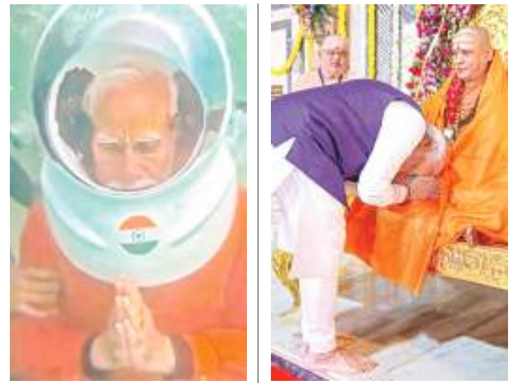
प्रधानमंत्री नरेंद्र मोदी ने गुजरात के द्वारका में उस स्थान पर पानी के भीतर पूजा की, जहाँ द्वारका शहर डूबा हुआ है.