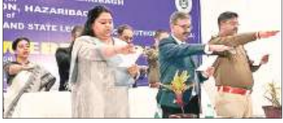
लाभुकों के बीच परिसंपत्तियों का वितरण