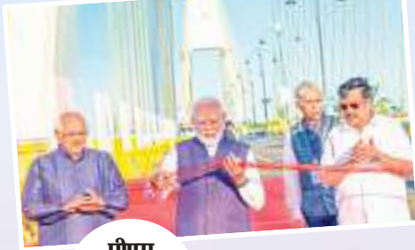
पीएम मोदी ने किया उद्घाटन