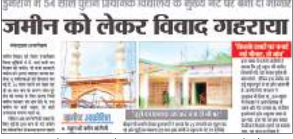
भार निरीक्षण में जरूर आए थे, पर कोई संज्ञान नहीं लिया गया था.

इचाक प्रखंड के डुमरौन में उर्दू प्राथमिक विद्यालय के मुख्य गेट पर गांव के ही कुछ लोगों द्वारा अपना मीनार बनाकर कर 30 फीट का मीनार बनाने का मामला सामने आया था. इस मामले में स्कूल के शिक्षक ने इचाक बीईओ को तीन बार आवेदन दिया था. लेकिन शिक्षा विभाग के द्वारा कोई कार्रवाई नहीं की गई. हालांकि आवेदन देने के बाद बीईओ दो-तीन