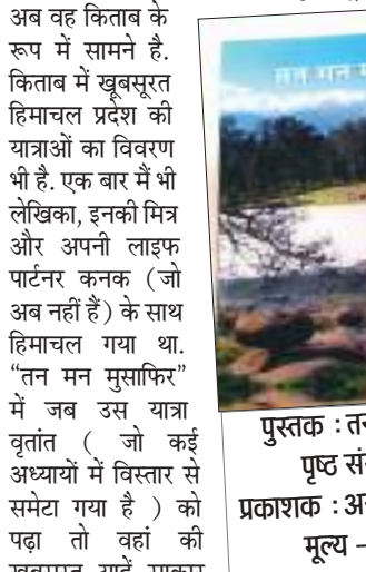
पुस्तक : तन मन मुसाफिर पृष्ठ संख्या : 176 प्रकाशक : अनुज्ञा बुक्स, दिल्ली मूल्य - 299 रुपये