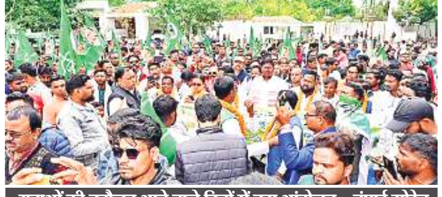
युवाओं की बढ़ती आने वाले दिनों में बड़ा आंदोलन : चंपाई सोरेन