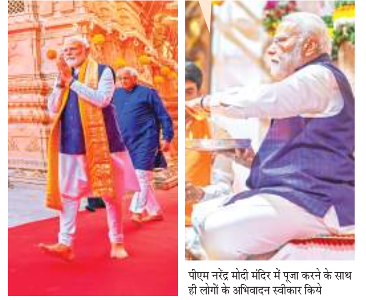
पीएम नरेंद्र मोदी मंदिर में पूजा करने के साथ ही लोगों के अभिवादन स्वीकार करते