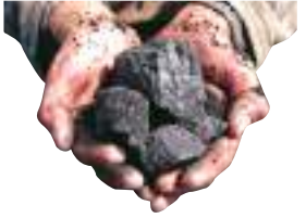
प्रमुख संवाददाता | रांची

1000 करोड़ की कंपनी जेईएमसीएल ने जारी किया टेंडर 12 मार्च को खुलेगा टेंडर जेईएमसीएल को दी गई है बड़ी जिम्मेवारी