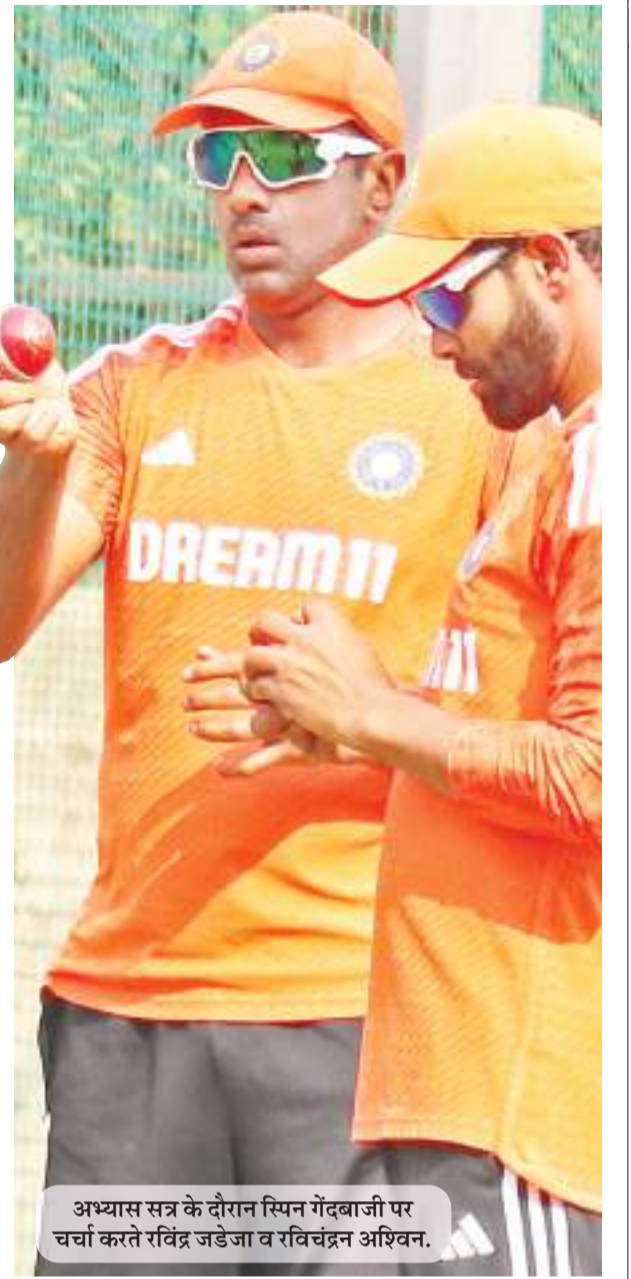
अभ्यास सत्र के दौरान स्पिन गेंदबाजी पर चर्चा करते रविंद्र जडेजा व रविचंद्रन अश्विन.

इंग्लैंड की टीम की ओर से बल्लेबाज ओली पोप ने प्रेस वार्ता की. ऑलीपोप ने कहा कि दो मैच में हार के बाद इस मैच में टीम पूरी तैयारी के साथ उतरेगी और सभी खिलाड़ी अच्छे मानसिकता के साथ खेलेंगे. इंग्लैंड की टीम ने पिच का जायजा लिया और उन्होंने कहा कि रांची की पिच पर काफी दरार है, जिसे देखते हुए लगता है कि स्पिनरों को पिच से काफी मदद मिलेगी. हमने महसूस किया है कि जडेजा, अश्विन और कुलदीप स्पिन लेती पिचों पर खतरा पैदा कर सकते हैं इसलिए हमारा सर्वश्रेष्ठ प्रयास उन्हें दबाव में बनाये रखना होगा जैसा हमने हैदराबाद में दूसरी पारी में किया था. अगर पिच वैसे ही स्पिन करती है तो टेस्ट से पहले हमारा मनोबल काफी बढ़ा हुआ होगा.