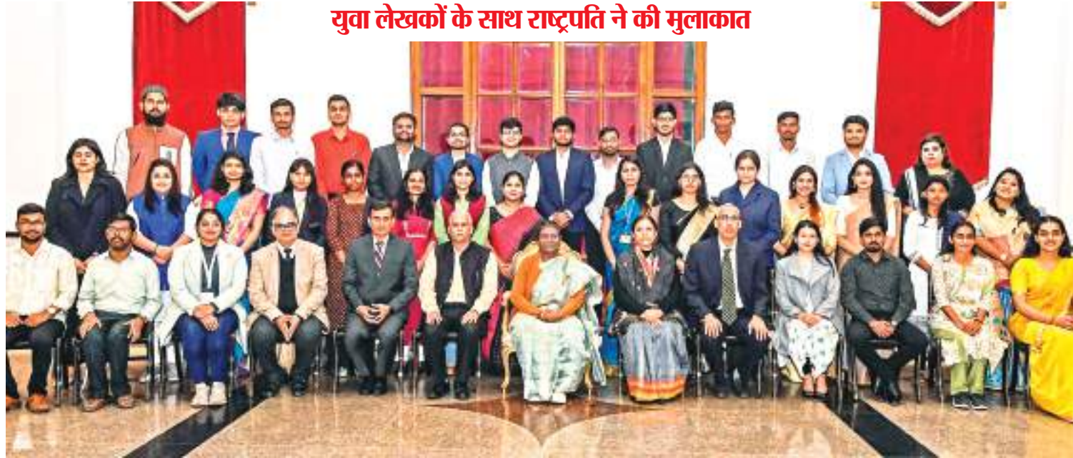
लेखकों से मुलाकात : राष्ट्रपति द्रौपदी मुर्मू ने नयी दिल्ली में पीएम युवा लेखकों के साथ मुलाकात.