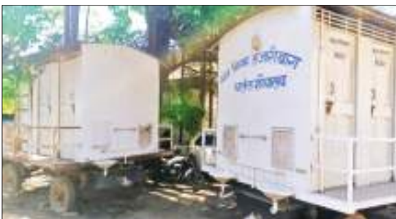
कोर्ट परिसर में पड़ा चलंत शौचालय और मेन रोड में बायो शौचालय की टंकी का उखड़ा हुआ ढक्कन व आसपास फैला कचरा।

दूसरी ओर इस मिशन का एक और लक्ष्य था कि हर घर में शौचालय की सुविधा हो। इसके लिए सरकार ने करोड़ों रूपए खर्च किए और शहर से गांव तक कई स्थानों पर शौचालय बनाए गए। जहां जगह का अभाव था, वहां फाइबर शौचालय उपलब्ध कराया गया। इसके लिए ग्रामीण इलाके में 12000 रुपये की सहयोग राशि प्रति लाभुक दिया गया। वहीं, शहरी क्षेत्र में भी जगह-जगह शौचालय बनाए गए। नगर निगम क्षेत्र में बाजार, चौक चौराहों में चलंत शौचालय का सुविधा महैया कराया गई और फिर कई जिलों को खुले में शौच मुक्त यानी ओडीएफ घोषित किया गया। लेकिन, समय बीतने के साथ पीएम के सपने पर पलती लगती जा रहा है। ऐसा ही मामला हजारीबाग नगर निगम क्षेत्र में देखने को मिल रहा है।