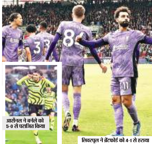
आर्सेनल ने बर्नले को 5-0 से पराजित किया