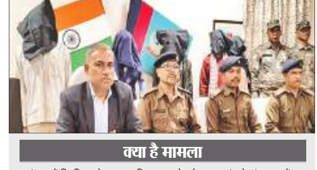
यहां है मामला

ठेकेदार ने कहा कि उन्हें स्वास्थ्य केंद्र बनाने के लिए एनओसी मिल गया है. इसके बाद ही उन्होंने काम शुरू किया है. काम शुरू करते समय जमीन पर मालिकाना हक जतानेवालों ने कुछ दिनों काम रोकने को कहा था, मैं कुछ दिनों तक रुका भी रहा, फिर कोई आया ही नहीं.