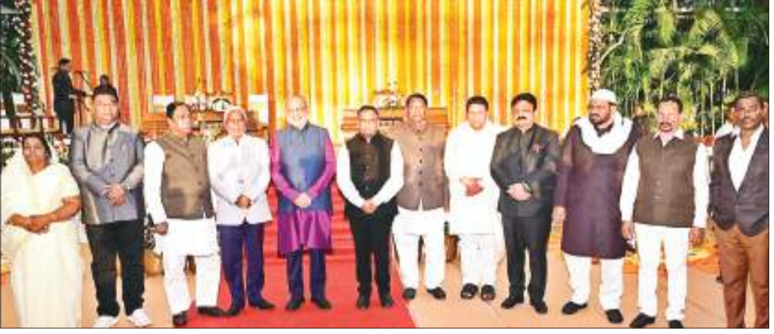
राजभवन में शुक्रवार को आयोजित शपथ ग्रहण समारोह के बाद राज्यपाल के साथ मुख्यमंत्री चंपाई सोरेन और उनकी नई कैबिनेट के सदस्य।