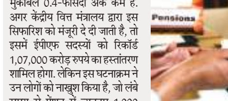
वर्ष 2023-24 के लिए भविष्य निधि (पीएफ) जमा में 0.1-प्रतिशत-हिंदू की बढ़ोतरी के लिए कर्मचारी भविष्य निधि संगठन (ईपीएफओ) के केंद्रीय न्यासी बोर्ड की सिफारिश हैरतअंगोज नहीं लगनी चाहिए, क्योंकि यह बढ़ोतरी ईपीएफओ के पिछले साल के कदम के ही अनुरूप है. हालांकि, 8.25 फीसदी की अनुसूचित उदर 2023-24 की भांति चुनाव पूर्व वाले वर्ष 2018-19 में लागू किए गए दर के मुकाबले 0.4-फीसदी अंक कम है.

आवश्यक बजटीय समर्थन में 'भारी बढ़ोतरी' का हवाला देते हुए न्यूनतम पेंशन राशि को दोगुना करने के प्रस्ताव का खारिज कर दिया था. बजटीय सहायता में एक और घटक है जो प्रति माह 15,000 रुपये की राशि तक के वेतन के 1.16 फीसदी के केंद्र सरकार के योगदान को इंगित करता है. वित्तीय वर्ष 2024-25 के लिए, वित्त मंत्रालय ने बजटीय सहायता के रूप में चालू वर्ष के 9,760 करोड़ रुपये के संशोधित अनुमान के मुकाबले 10,950 करोड़ रुपये राशि का अनुमान लगाया है. वित्त मंत्रालय की गणना है कि न्यूनतम पेंशन में शूल-प्रतिशत की बढ़ोतरी कुल बजटीय सहायता में आनुपातिक बढ़ोतरी से ज्यादा होगी, क्योंकि 2014 तक कई पेंशनभोगियों को मासिक पेंशन के रूप में 1,000 रुपये से काफी कम प्राप्त हुआ था. ईपीएस को 'निर्दिष्ट योगदान- निर्दिष्ट लाभ' वाली सामाजिक सुरक्षा योजना के रूप में निरूपित करते हुए, सरकार ने राज्यसभा में कहा कि सभी लोगों का भुगतान योगदान के जरिए हासिल हुए संघर्ष से किया गया था और 31 मार्च, 2019 तक फंड के मूल्यांकन के मुताबिक, उसमें 'एक बीमार्थिक घाटा' था. हालांकि, ईपीएफओ की वार्षिक रिपोर्ट (2022-23) में इस तर्क को लगभग ध्वस्त कर दिया गया है. (दहिंदू)