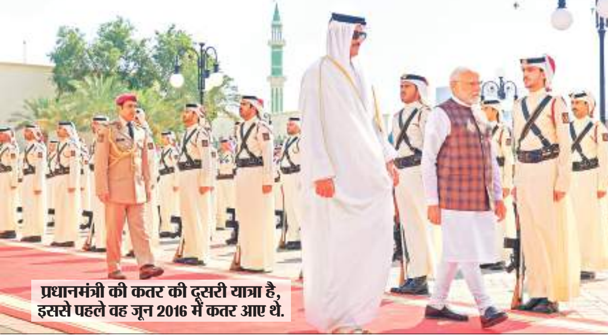
प्रधानमंत्री की कतर की दूसरी यात्रा है, इससे पहले वह जून 2016 में कतर आए थे।

एक खेल या पीटीआई शिक्षक के कर्तव्यों में छात्रों को खेल खेलना, राष्ट्रीय शारीरिक शिक्षा परीक्षा का प्रशासन करना, छात्रों की प्रगति की निगरानी करना, सिखाने और शारीरिक रूप से दिव्यांग छात्रों की शारीरिक जरूरतों को पूरा करने, छात्रों के प्रदर्शन को ग्रेड करना और शिक्षकों और माता-पिता के साथ संवाद करना शामिल है। खेल या पीटीआई शिक्षकों को मजबूत संचारक होने और विभिन्न तरह की कक्षाओं का नेतृत्व सहजता पूर्वक करने की आवश्यकता है। पीटीआई टीवर विभिन्न खेलों के कोच भी हो सकते हैं। चूंकि ये शिक्षक अक्सर लंबी अवधि तक काम कर सकते हैं, इसलिए इन्हें एथलेटिक गतिविधियों की निगरानी के लिए स्कूल अवधि के बाद भी विद्यालय के खेल मैदान में रहने की जरूरत होती है।