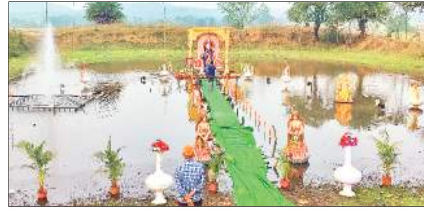
दिलीप कुमार। चांडिल

बसंत पंचमी के अवसर पर सरस्वती पूजा के अवसर पर लेगडीह में तालाब के अंदर स्थापित प्रतिमा आकर्षण का केंद्र बना हुआ है, चारों ओर पानी से घिरे प्रतिमा के आसपास आकर्षक साज-सज्जा भी किया गया है, एसबीसी लेगडीह की ओर से प्रतिवर्ष नए-नए तरीके से पूजा का आयोजन किया जाता है, इसके अलावा अनुमंडल क्षेत्र के विभिन्न स्थानों पर बने आकर्षक पूजा पंडाल लोगों के कौतूहल का