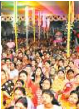
● महाराज ने बाल कृष्ण के हर लीला का रहस्य बताया ।