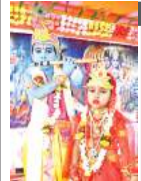
● बाल गोपाल की झांकी देखकर श्रद्धालु भावविभोर हो गए ।