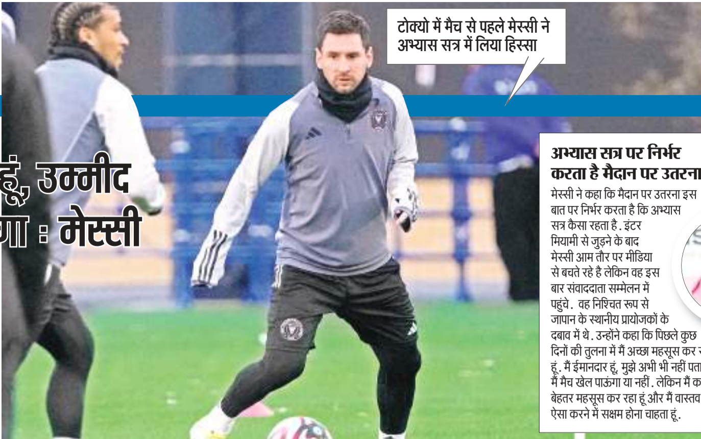
टोक्यो में मैच से पहले मेस्सी ने अभ्यास सत्र में लिया हिस्सा

की तीखी प्रतिक्रिया का सामना करना पड़ा था। इस बहुचर्चित प्रदर्शनी मैच के दौरान प्रशंसकों ने इंटर मियामी के सह मालिक डेविड बेकहम की आलोचना की और पैसे वापसी की मांग की क्योंकि मेस्सी पैर की मांसपेशियों में खिंचाव के कारण एक स्थानीय टीम के खिलाफ मैच के दौरान पूरे 90 मिनट बेंच पर बैठे रहे। इंटर मियामी टीम के उनके साथी खिलाड़ी तुईस सुआरेज भी इस मुकाबले के दौरान बेंच पर रहे।