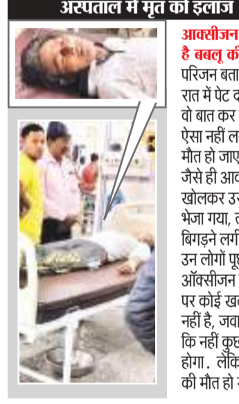
अस्पताल में मृत को इलाज