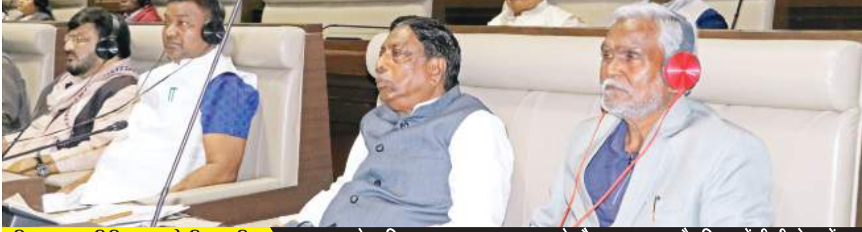
विधानसभा अनिश्चितकाल के लिए स्थगित राज्यपाल के अभिभाषण पर धन्यवाद प्रस्ताव के दौरान सत्ता पक्ष और विपक्ष में तीखी नोकझोंक

झारखंड विधानसभा में सीएम चंपाई सोरेन के फ्लोर टेस्ट के लिए आहत विशेष सत्र का समापन हो गया। स्पीकर ने विधानसभा की कार्यवाही को अनिश्चितकाल के लिए स्थगित कर दिया है। मंगलवार को सदन में राज्यपाल के अभिभाषण पर चर्चा के दौरान मुख्यमंत्री चंपाई सोरेन ने कहा कि पूर्व सीएम हेमंत सोरेन ने जो योजनाएं बनाई हैं, हम उन योजनाओं को आगे बढ़ाने के लिए हेमंत सरकार का पार्ट-2 है। हम इसे स्वीकार करते हैं। बाबूलाल मरांडी पर निशाना साधते हुए उन्होंने कहा कि आज जो खुद को भाजपा का बड़ा हिस्सा बताते हैं वह पहले मुख्यमंत्री थे, भाजपा ने उन्हें अयोग्य घोषित कर 2 साल में चैन कर दिया। उस समय तो कोई राजनीतिक परिस्थिति पैदा नहीं हुई थी।