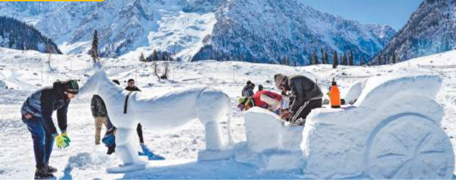
गांदरबल : शनिवार को गांदरबल जिले के सोनमगं में कलाकार बर्फ की छोड़ा-गाड़ी की मूर्ति को अंतिम रूप देते हुए।