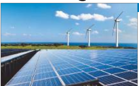
44 प्रतिशत ऊर्जा गैर-जीवाश्म ईंधन से हासिल होती

भारत का विदेशी मुद्रा भंडार इस हफ्ते बढ़कर 622.469 अरब डॉलर हो गया है, जो बीते एक महीने का उच्चतम स्तर है। 2 फरवरी को खतम हुए पिछले हफ्ते के मुकाबले ये 5.736 अरब डॉलर बढ़ा है। रिजर्व बैंक के साप्ताहिक डाटा के अनुसार, भारत के विदेशी मुद्रा भंडार में सबसे बड़ा हिस्सा विदेशी मुद्रा संपत्ति का रहा, जो 5.186 अरब डॉलर बढ़कर 551.331 अरब डॉलर हो गया है। विदेशी मुद्रा संपत्तियों में रिजर्व बैंक द्वारा विदेशी मुद्रा संपत्ति का उपयोग करके खरीदी गई यूएस ट्रेजरी बिल जैसी संपत्तियां हैं। विदेशी मुद्रा भंडार में सबसे बड़ा हिस्सा विदेशी मुद्रा संपत्ति