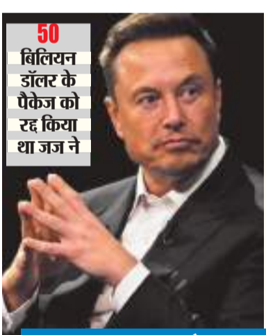
50 बिलियन डॉलर के पैकेज को रद्द किया था जज ने

टेस्ला और एक्स के मालिक एलन मस्क के फैसले पर दुनिया की नजर होती है और वह चर्चा का विषय बनती है। इस बार उनकी कंपनी न्यूरालिंक के शिफ्टिंग को लेकर है। दरअसल मस्क ने ब्रेन इंफ्लॉट पर काम करने वाली अपनी कंपनी न्यूरालिंक के ऑफिशियल बिजनेस को डेलावेयर से करीब 4,100 किलोमीटर दूर नेवाडा शिफ्ट कर लिया है। मस्क ने यह फैसला टेस्ला में उनकी सैलरी और टिवटर की खरीद से जुड़ी कानूनी कार्रवाइयों से नाराज होकर लिया है। न्यूरालिंक के बाद मस्क ने टेस्ला को भी डेलावेयर से ऑफिशियली हटाने का ऐलान किया है। कंपनी की ओर से शेयरधारकों को भेजे गए एक नोटिस के मुताबिक, मस्क ने न्यूरालिंक के ऑफिस को 8 फरवरी को शिफ्ट किया। इस बात की जानकारी ब्लूमबर्ग ने दी है। नोटिस में कंपनी के शेयरहोल्डर्स को बताया गया है कि डेलावेयर कॉर्पोरेशन में उनके बकाया शेयर अब नेवाडा कॉर्पोरेशन में शिफ्ट कर दिए जाएंगे। इससे उनके शेयरों या कंपनी में होल्डिंग पर कोई असर नहीं होगा।