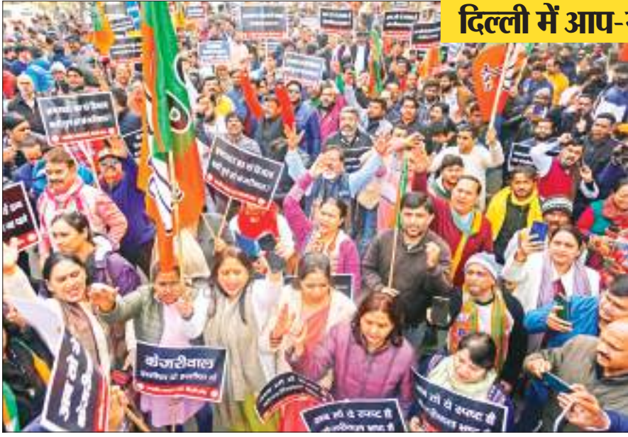
शुक्रवार को नयी दिल्ली में आम आदमी पार्टी के खिलाफ विरोध-प्रदर्शन के दौरान भाजपा समर्थकों ने नारे लगाए.