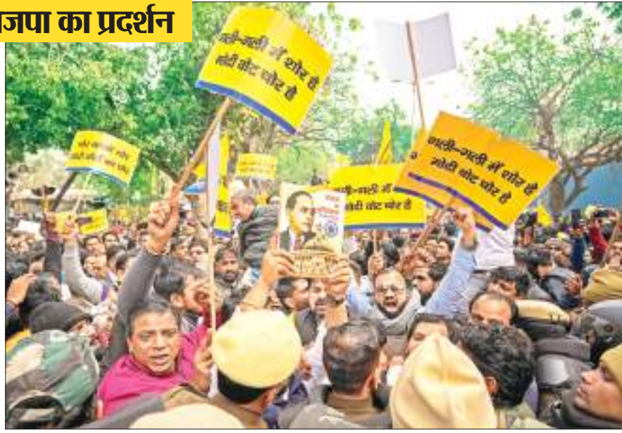
नयी दिल्ली में शुक्रवार को बीजेपी के विरोध-प्रदर्शन के दौरान पुलिस कर्मियों ने आप समर्थकों को रोका.