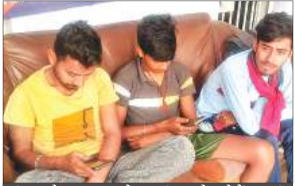
मांगुर लदे 30-35 ट्रक रोजाना बंगाल से आते हैं झारखंड