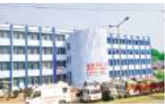
संवाददाता । धनबाद

धनबाद जिला के सबसे बड़े सरकारी अस्पताल एसएनएमएमसीएच में सर्जन, मेडिसिन व इंटरनी समेत अन्य विभाग के दो दर्जन से अधिक सीनियर और विशेषज्ञ डॉक्टर हैं। सूत्रों के अनुसार सरकार की ओर से उन्हें 3 से 3.50 लाख रुपये वेतन भी मिलता है। तीन से साढ़े तीन लाख रुपये वेतन लेनेवाले अधिकतर चिकित्सक या तो नर्सिंग होम चला रहे हैं या फिर मोटी रकम लेकर कई मेडिकल दुकानों, क्लिनिक व बड़े निजी अस्पतालों में मरीजों का इलाज कर रहे हैं। वहीं दूसरी ओर सीनियर डॉक्टरों से इलाज कराने की आस लेकर एसएनएमएमसीएच के ओपीडी व इनडोर में जानेवाले मरीजों को रेंजिडेंट मिलता है, जिससे वे अपना इलाज कराते हैं। ये रेंजिडेंट मेडिकल कॉलेज से एमबीबीएस की पढ़ाई पूरी करने के बाद प्रशिक्षण के तौर पर मरीजों का इलाज करते हैं। जिसमें इंटरन, जूनियर रेंजिडेंट व सीनियर रेंजिडेंट होते हैं। इन्हें सरकार की ओर से 17 हजार 500 रुपये, 54 हजार 500 रुपये और 80 हजार रुपये मानदेय दिया जाता है। सीनियर डॉक्टर कभी