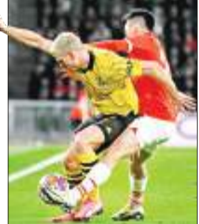
दूसरे स्थान पर रहकर पहली बार चैंपियंस लीग के राउंड 16 में जगह बनाने में सफल रहा.

लुक डि जोंग के पेनल्टी से किए गए गोल की बदीलत पीएसवी आइंडहोवेन ने चैंपियंस लीग राउंड-16 मुकाबले के पहले चरण में बोरूसिया डोर्टमंड से 1-1 से ड्रा खेला. डोनिल मालेन के 24 वें मिनट में किये गये गोल से बोरूसिया डोर्टमंड ने बढ़त बना ली थी, लेकिन मंगलवार को लुक डि जोंग ने अपने पूर्व साथी के गोल की बढ़त को खत्म कर दिया. दूसरे चरण का मैच 13 मार्च को डोर्टमंड में खेला जायेगा. पीएसवी ग्रुप बी में आसेनल के पीछे