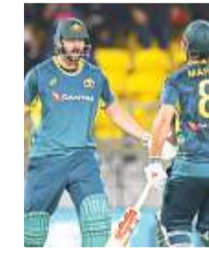
छक्के) और रचिन रविंद्र (35 गेंद पर 68 रन, दो चौके, छह छक्के) ने अर्धशतक जमाए जबकि सलामी बल्लेबाज फिन एलेन ने 17 गेंद पर 32 रन का योगदान दिया. ऑस्ट्रेलिया को लक्ष्य तक पहुंचाने में

टिम डेविड ने मैच की आखिरी गेंद पर चौका लगाकर ऑस्ट्रेलिया को न्यूजीलैंड के खिलाफ बुधवार को यहां पहले टी-20 अंतरराष्ट्रीय क्रिकेट मैच में छह विकेट से रोमांचक जीत दिलाई. न्यूजीलैंड ने पहले बल्लेबाजी करते हुए तीन विकेट पर 215 रन बनाए, जिसमें 13 छक्के और 10 चौके शामिल हैं. उसकी तरफ से डेविड कॉनवे (46 गेंद पर 63 रन, पांच चौके, दो