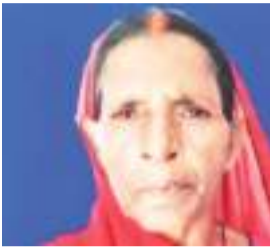
मृतका का देवी।

उग्रवादियों की तबाही से आज कई घर सने हो गए हैं। उस वक्त को आज भी कई लोग भुला नहीं पा रहे हैं। कई परिवार बेघर हो चुके हैं। कोई रोजगार के लिए दर-दर की ठोकें खा रहा है, तो कई लोगों ने गांव को ही छोड़ कर शहर में आशियाना बना लिया है। अब वह गांव में भी जाने से कतराते हैं। कुछ अपनी प्रॉपर्टी की देखरेख के लिए गांव तो जाते हैं पर वह यादों में खो जाते हैं। उन्हें गांव छोड़ने का सदमा होता है। कहा कि उग्रवादी के मारे हुए परिवार आज भी अपने बिखरा हुआ परिवार को जुटा नहीं पा रहा है।