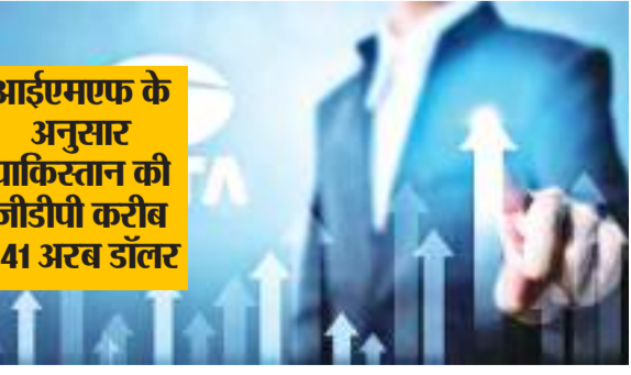
आईएमएफ के अनुसार पाकिस्तान की जीडीपी करीब 341 अरब डॉलर

देश के दिग्गज कारोबारी समूह टाटा का मार्केट कैप पड़ोसी मुल्क पाकिस्तान की घरेलू उत्पाद (जीडीपी) से आगे निकल गया है. समूह की कंपनियों का बाजार पूंजीकरण (मार्केट कैप) 365 अरब डॉलर (30 लाख करोड़ रुपये) से अधिक है. अंतरराष्ट्रीय मुद्रा कोष (आईएमएफ) के अनुमान के अनुसार आर्थिक और राजनीतिक संकट में फंसे पाकिस्तान की जीडीपी लगभग 341 अरब डॉलर ही है. एक रिपोर्ट के मुताबिक नमक से लेकर हवाई जहाज तक का कारोबार संभालने वाली टाटा समूह की कंपनियों के शेयर में हाल के दिनों में