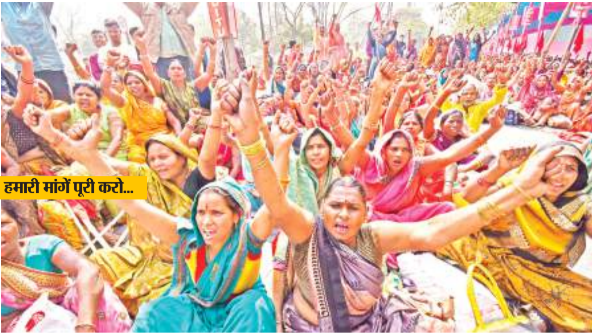
हमारी मांगें पूरी करो...

औरंगाबाद। जिले के ओबरा थाना क्षेत्र के एक गांव में नाबालिग बच्ची के साथ सामूहिक दुष्कर्म की घटना हुई है. बताया जा रहा है कि दो मनचलों ने सामूहिक दुष्कर्म की घटना को अंजाम दिया. नाबालिग का इलाज सदर अस्पताल में चल रहा है. पीड़िता की मां ने बताया कि रिवाज की देर रात गांव में बारात आई थी जिसे देखने वह गई थी. बारात लगने के बाद जब वह देर रात घर पहुंची तो देखा कि ब्लाईडिंग हो रही है. इसके बाद इलाज के लिए सदर अस्पताल लाया गया. वहीं, होश में आने के बाद बच्ची ने बताया कि बारात से लौटने के बाद जब वह घर लौट रही थी तभी दो लड़कों ने उसे पकड़ लिया.