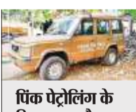
पिक पेट्रोलिंग के लिए खाका तैयार किया है।