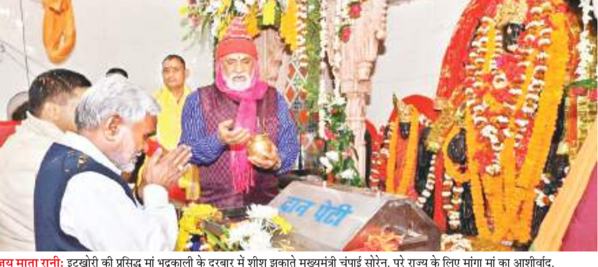
जय माता रानी: इटखोरी की प्रसिद्ध मां भद्रकाली के दरबार में शोश शुकतावे मुख्यमंत्री चंपाई सोरेन, पूरे राज्य के लिए मांगा मां का आशीर्वाद।

50 वर्ष से अधिक उम्र की सभी महिलाओं को पेंशन देने का काम हो रहा है 20 लाख लोगों के लिए अबुआ आवास योजना की मंजूरी दी 15 हजार किलोमीटर सड़क का निर्माण किया जा रहा है