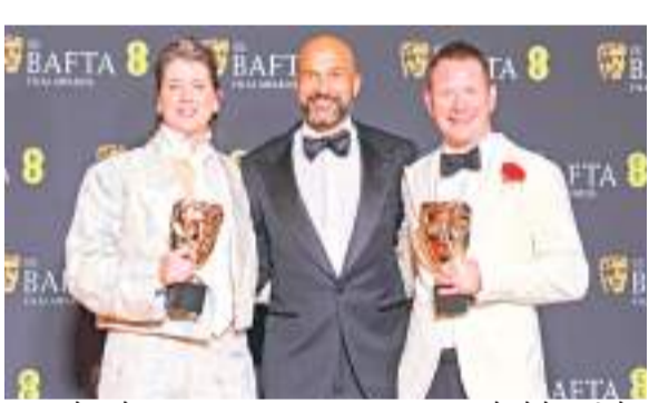
लंदन में 77वें ब्रिटिश अकादमी फिल्म अवार्ड्स, बाफ्टा में फोटोग्राफरों के लिए बीच में कीगन-माइकल-की के साथ पोज देते हुए.

बता दें कि भारत के बीमा उद्योग में 57 बीमा कंपनियां हैं. इसमें 24 जीवन बीमा व्यवसाय में हैं, जबकि 33 सामान्य बीमाकर्ता हैं. जीवन बीमा कंपनियों में, जीवन बीमा निगम एकमात्र सार्वजनिक क्षेत्र की कंपनी है. गैर-जीवन बीमा क्षेत्र में छह सार्वजनिक क्षेत्र के बीमाकर्ता हैं. इनके अलावा, एक एकमात्र राष्ट्रीय पुनर्बीमाकर्ता है, जिसका नाम जनरल इंश्योरेंस कॉर्पोरेशन ऑफ इंडिया (जीआईसीआई) है. भारतीय बीमा बाजार में अन्य हितधारकों में एजेंट, दवाला, सर्वेक्षणकर्ता और स्वास्थ्य बीमा दावों की सेवा करने वाले तीसरे पक्ष के प्राथमिक शामिल हैं. इंडिया ब्रॉड इक्विटी फाइंडिंग द्वारा भारत में बीमा उद्योग में पिछले दो दशकों में निजी क्षेत्र की अधिक भागीदारी और वितरण क्षमताओं में सुधार के साथ-साथ परिवारालन दक्षता में प्रगतिशीली विकास दर देखी है.