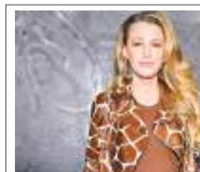
न्यूयॉर्क फैशन वीक

दोपहिया वाहन खंड में जनवरी में अच्छी वृद्धि देखी गई और ग्रामीण बाजार में सुधार जारी है। उन्होंने कहा कि हालांकि जनवरी 2024 में वाणिज्यिक वाहन क्षेत्र में वृद्धि नहीं हुई, लेकिन चालू वित्त वर्ष के अगले दो महीनों में इसमें अच्छी मांग की संभावना है। तिपहिया वाहनों की थोक बिक्री जनवरी में नौ प्रतिशत की वृद्धि के साथ 53,537 इकाई रही, जबकि जनवरी 2023 में यह 48,903 इकाई थी। सियाम के महानिदेशक