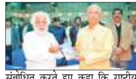
संबोधित करते हुए कहा कि राष्ट्रीय शिक्षा नीति, 2020 में भारतीय ज्ञान परंपरा का समावेश है। उन्होंने कहा कि व्यक्ति का समग्र विकास ही शिक्षा का उद्देश्य है तथा इसका वर्णन तैत्तिरीय उपनिषद् में विस्तार से किया गया है। कला, खेल और संगीत की शिक्षा बच्चों के लिए अत्यंत आवश्यक है।