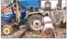
रेलवे पटरी पर अवैध रूप से बीच में फंसे ट्रैक्टर को चालक ने काफी देर तक फंसे पहिया निकालने का प्रयास किया, लेकिन सफल नहीं हुआ। देखते देखते वहां लोगों की काफी भीड़ जमा हो गई। ट्रैक्टर फंसने से रेल परिचालन 15 मिनट तक बाधित रहा। रेलवे अधिकारी के पहुंचने से पहले ही लोगों ने ट्रैक्टर को निकाल लिया और फिर वहां से ट्रेन

जिले में बुधवार को ट्रैक्टर चालक की लापरवाही के कारण एक बड़ा हादसा हो सकता था। स्थानीय लोगों के द्वारा लाल कपड़ा दिखाकर ट्रेन रोकी गई। बता दें कि पूरा मामला नवादा जिले के बुंदेलखंड क्षेत्र के सद्भावना चौक पुल के नीचे का है। रेलवे लाइन पर अवैध रूप से पार कर रहा एक ट्रैक्टर फंस गया। इस दौरान गया से क्यूल जाने वाली रामपुरहाट पैसेंजर ट्रेन इस लाइन पर आ रही थी। स्थानीय लोगों की मदद से लाल कपड़ा दिखाकर ट्रेन रोकी गई।