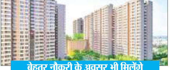
बेहतर नौकरी के अवसर भी मिलेंगे

भाषा। नयी दिल्ली ऊंची आर्थिक हैसियत वाले लोग (एचएनआई) अब लक्जरी आवासीय इकाइयों को खरीदने में ज्यादा दिलचस्पी दिखा रहे हैं। यही वजह है कि पिछले साल देश के सात प्रमुख शहरों में चार करोड़ रुपये या उससे अधिक दाम के घरों की बिक्री में 75 प्रतिशत की भारी वृद्धि देखी गयी। रियल एस्टेट सलाहकार कंपनी सीबीआरई ने बुधवार को जारी एक रिपोर्ट में यह जानकारी दी। इसके मुताबिक, सात प्रमुख शहरों में से दिल्ली-एनसीआर में सबसे अधिक तेजी रही और यहां लक्जरी घरों की बिक्री में लगभग तीन गुना उछाल आया। इस रिपोर्ट के मुताबिक, कैलेंडर वर्ष 2023 में चार करोड़ रुपये या उससे अधिक कीमत के 12,935 घरों की बिक्री हुई जबकि साल 2022 में यह संख्या 7,395 इकाई थी। इस तरह लक्जरी घरों की बिक्री में 75 प्रतिशत का बड़ा उछाल देखा गया।