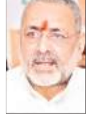
केंद्रीय मंत्री गिरिराज सिंह ने कहा है कि तेजस्वी यादव एक ऐसे नेता हैं जो बोलते कुछ हैं करते कुछ और हैं। भगवान ने चिकना और अच्छा बनाया है। लेकिन इस चिकनी जुबान में मोदी जी को गाली देते-देते गुजरातियों को गाली देने लगते हैं। फिर जब कोर्ट का समय

विशेष संवाददाता। पटना आता है तो माफ़ी भी मांगने लगते हैं। यह लोग दोहरे चेहरे और दोहरे चरित्र के हैं, जिनका यह चेहरा सामने आ रहा है कि वोट के लिए गाली देते हैं और कोर्ट में जाकर माफ़ी मांगते हैं। जातीय गणना में यादव की संख्या अधिक बताएं जाने पर गिरिराज सिंह ने कहा कि लालू यादव 'माई' समीकरण बनाएं या बाप समीकरण बना लें, देश और बिहार की जनता ने नरेंद्र मोदी के प्रति अपना समर्पण दिखाया है, तेजस्वी यादव आदि नीकरी के बंद शेर फिर आल्टाइम जो लेवल तक गिर गए।