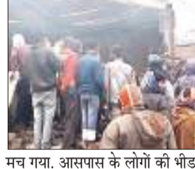
मच गया। आसपास के लोगों की भीड़ लग गई। घटना के बाद पुलिस मौके पर पहुंची और छानबीन में जुट गई। स्थानीय लोगों ने बताया कि रात करीब 12 बजे मधेपुरा की तरफ से आ रही एक कोयला लोड ट्रक रेशना चौक पर 4-5 दुकान को तोड़ते हुए बिजली पोल से जा टकरा गई।

मधेपुरा में भीषण सड़क हादसे में एक युवक जिंदा जल गया। घटना ग्वालपाड़ा प्रखंड अंतर्गत अरार औपी क्षेत्र के रेशना बाजार की है। मंगलवार की देर रात कोयला लोड ट्रक अनियंत्रित हो गया और पांच दुकानों को रौंदते हुए बिजली के पोल से टकरा गया। टक्कर इतनी जबरदस्त थी कि ट्रक में आग लग गई। देखते ही देखते आग ने पूरे ट्रक को ही मालमते में चार लोगों को हिरासत में लिया था। वहीं, अगले ही दिन पुलिस ने हत्याकांड में शामिल तीनों मुख्य आरोपी को गिरफ्तार कर लिया है। दरअसल, एआईएमआईएम नेता हत्याकांड मामले में पुलिस ने सात नामजद आरोपियों में से तीन मुख्य आरोपी को गिरफ्तार कर न्यायिक हिरासत में भेज दिया है। वहीं, अन्य चार फरार नामजद आरोपियों की गिरफ्तारी के लिए छापेमारी की जा रही है। पुलिस ने आपसी रंजिश में हत्या की बात कही है।