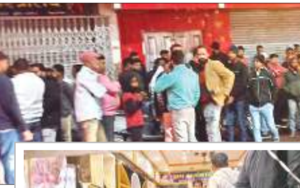
घटना के बाद लगी भीड़.

अपराधियों की गिरफ्तारी के लिए पुलिस कर रही छापेमारी, जल्द पकड़ने का किया दावा