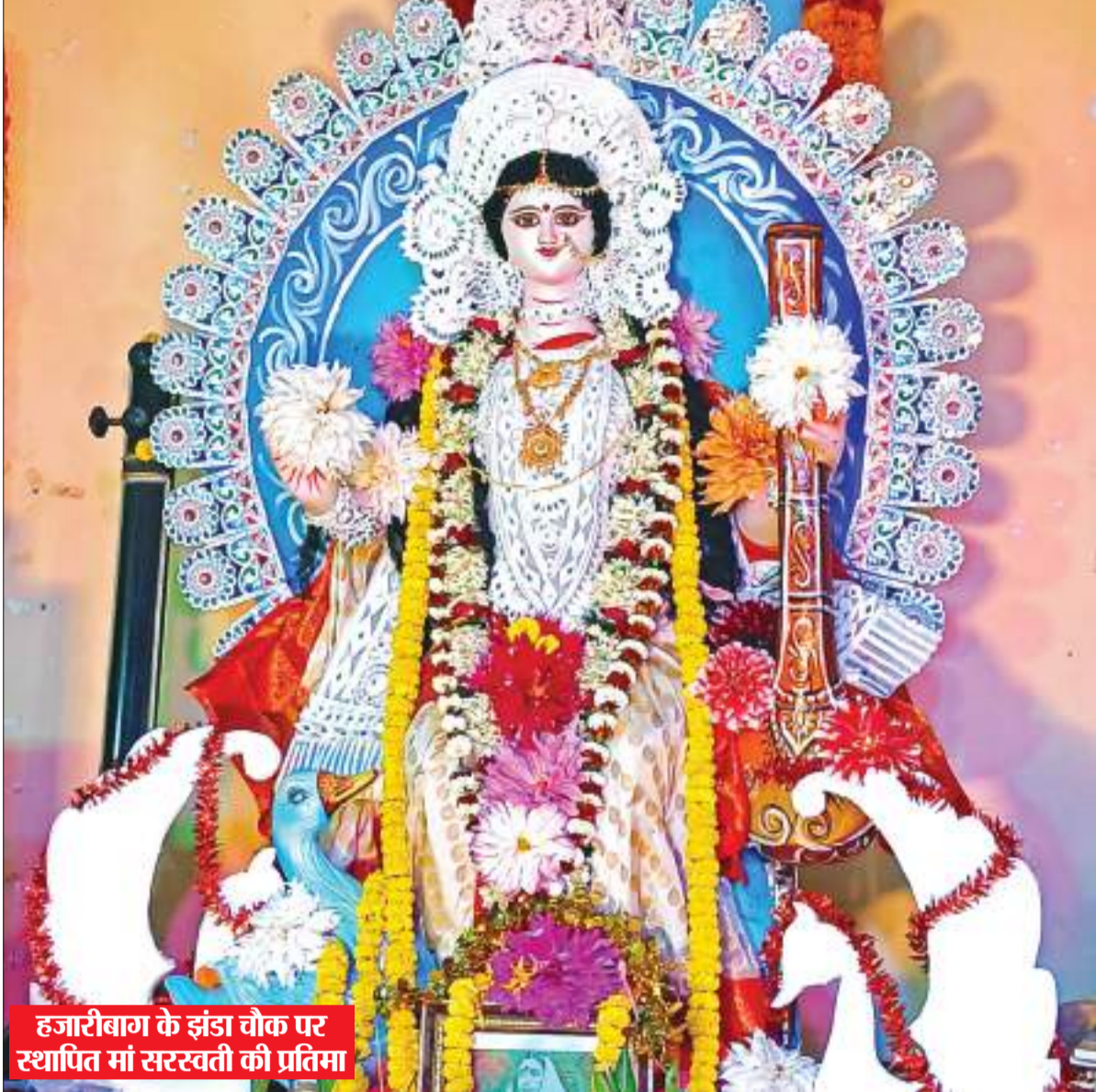
हजारीबाग के झंडा चौक पर स्थापित मां सरस्वती की प्रतिमा