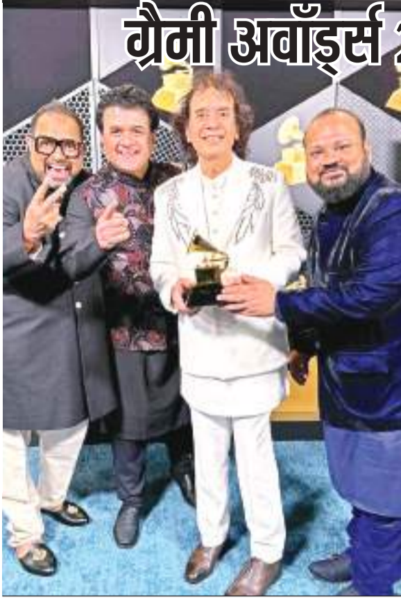
शुभम संदेश डेस्क