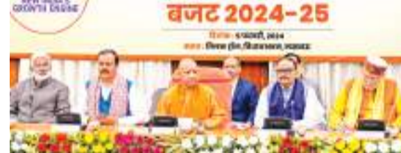
लखनऊ

उत्तर प्रदेश के मुख्यमंत्री योगी आदित्यनाथ ने सोमवार को कहा कि राज्य विधानसभा में पेश किया जाने वाला राज्य का बजट नये उत्तर प्रदेश में 'रामराज्य' की नींव रखेगा. मुख्यमंत्री योगी ने सोमवार को सोशल