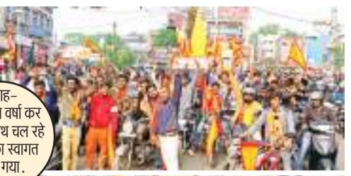
जगह-जगह पुष्प वर्षा कर रथ के साथ चल रहे भक्तों का स्वागत किया गया.

मेन रोड में चंद्रशेखर आजाद दुर्गा पूजा समिति की ओर से वैदिक मंत्रोच्चार के बीच पुरोहितों ने रथ को अगुवानी की. इसके बाद रथ थड़पखना, लालपुर, कोकर से होकर बूटी मोड़ पहुंचा. जहां पर राम भक्तों ने रथ पर विराजमान श्रीराम परिवार का चंदन-वंदन किया. जयकारे के बीच रथ को श्रीधाम अयोध्या के लिए विदा किया गया. रथ के साथ पिछले 70 दिन से कई प्रमुख तीर्थस्थल की यात्रा कर चुके, संतों की टोली ने रांचीवासियों द्वारा किए गए अभिनेदन के लिए साधुवाद दिया. संतों ने बताया कि श्रीतुलसी पीठाधीश्वर पद्मविभूषण जगदगुरु स्वामी रामभद्राचार्य महाराज के सान्निध्य में श्री हनुमान सेना वाराणसी की देखरेख में अमृत यात्रा रथ का देश के प्रमुख तीर्थस्थलों का भ्रमण कार्यक्रम चल रहा है. रांची से भेजा गया अक्षत स्वामी रामभद्राचार्य महाराज के सान्निध्य में अयोध्या में 14 जनवरी से होने वाले श्रीराम कथा और एक हजार कुंडीय श्री हनुमन् महायज्ञ अनुष्ठान में शामिल किया जायेगा.