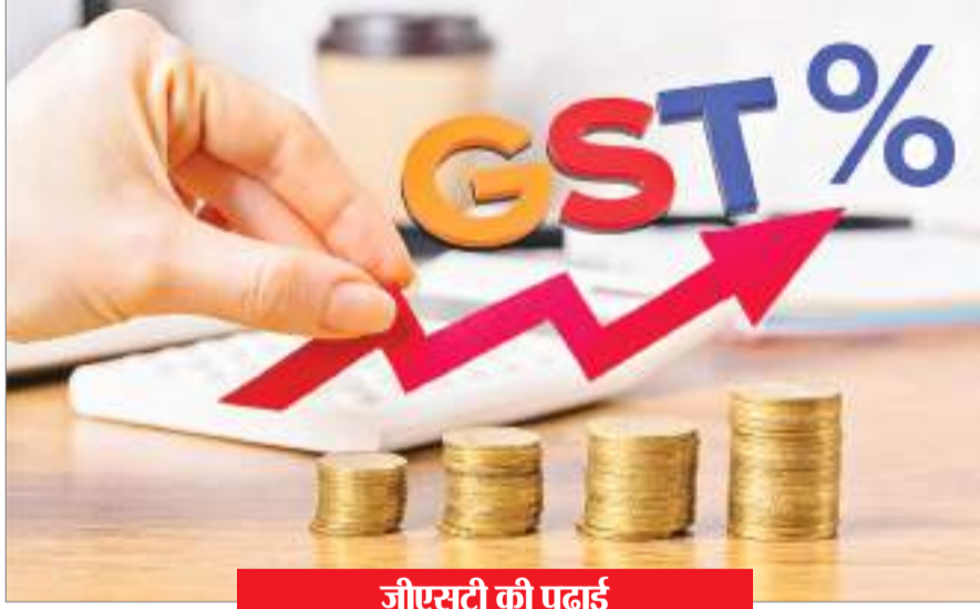
जीएसटी की पढ़ाई

जीएसटी एक प्रकार का इनडायरेक्ट टैक्स है, जिसे भारत में 1 जुलाई 2017 को लागू किया गया था. जीएसटी का फुल फॉर्म गुड्स एंड सर्विस टैक्स है. जिसका हिंदी में अर्थ 'वस्तु और सेवा कर' होता है. वस्तु और सेवा कर अधिनियम एक्ट द्वारा 29 मार्च 2017 को पारित किया गया, उसके बाद से अब तक जीएसटी ही भारत में चल रही है. यहां गुड्स एंड सर्विसेज (जीएसटी) के बारे में कुछ महत्वपूर्ण जानकारी को संक्षिप्त में बताया जा रहा है, जिन्हें आप नीचे दिए गए बिंदुओं में देख सकते हैं-