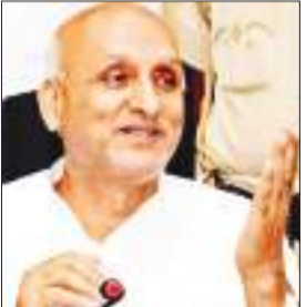
सावित्रीबाई फुले की जयंती के उपलक्ष्य में डेहरी अॉन सोन में आयोजित समारोह में उद्घाटन का सौभाग्य प्राप्त हुआ...