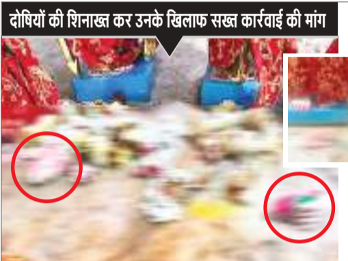
दोषियों की शिनाख्त कर उनके खिलाफ सख्त कार्रवाई की मांग