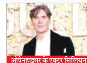
ओपेनहाइमर के एक्टर सिलियन मर्फी को बेस्ट एक्टर का अवार्ड