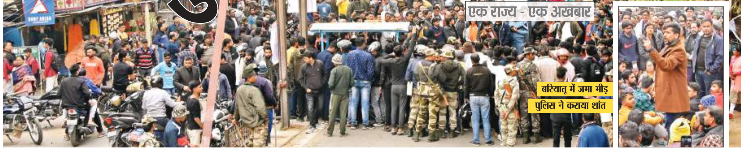
एक राज्य - एक अखबार

बरियातु में जमा भीड़ पुलिस ने कराया शांत