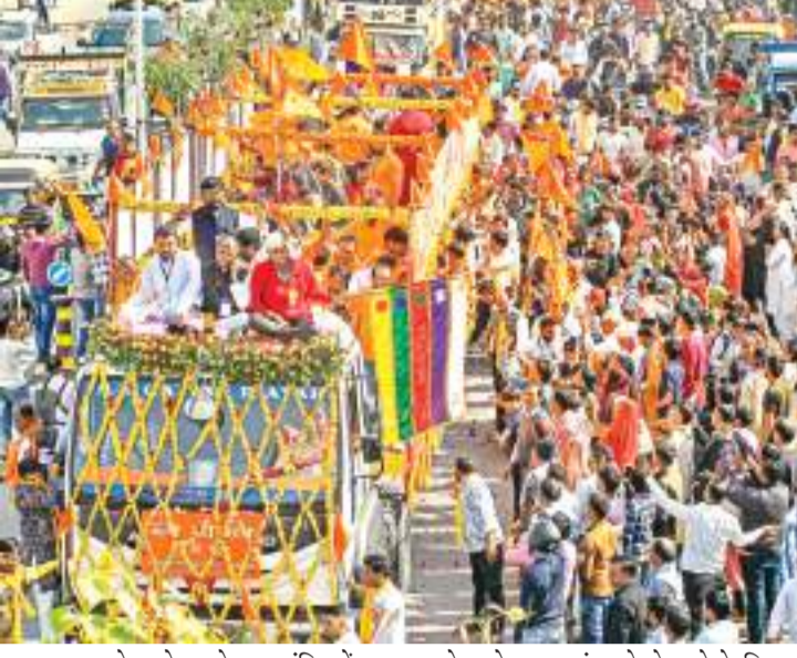
अहमदाबाद से अयोध्या के राम मंदिर में लाए जाने वाले ध्वज स्तंभ को ले जाने के लिए निकाले गए जुलूस में संकड़ों श्रद्धालुओं ने लिया हिस्सा।