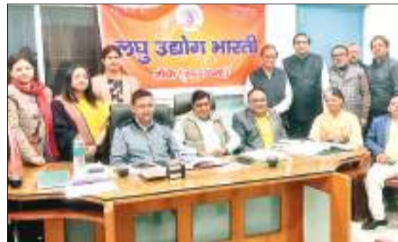
लघु उद्योग भारती रांची महानगर इकाई की बैठक में कई विषयों पर चर्चा।

बरियातू रोड स्थित श्री महावीर विकलांग सहायता समिति के प्रांगण में लघु उद्योग भारती रांची महानगर इकाई की बैठक हुई, बैठक में मुख्यतः स्थानीय उद्यमियों के समक्ष आ रही चुनौतियों और समस्याओं पर विस्तृत रूप से चर्चा हुई, इस मौके पर संस्था के सदस्यों ने सबसे गंभीर समस्या के रूप में सरकारी विभागों, उपक्रमों द्वारा विपत्र भुगतान में असाधारण विलंब को चिन्हित किया, सरकारी विभाग यथा रिस्स, सदर अस्पताल, पीएचडी, पीडब्लूडी, नगर निगम आदि विभागों में विपत्र भुगतान की गति अत्यंत धीमी है, जिसके कारण