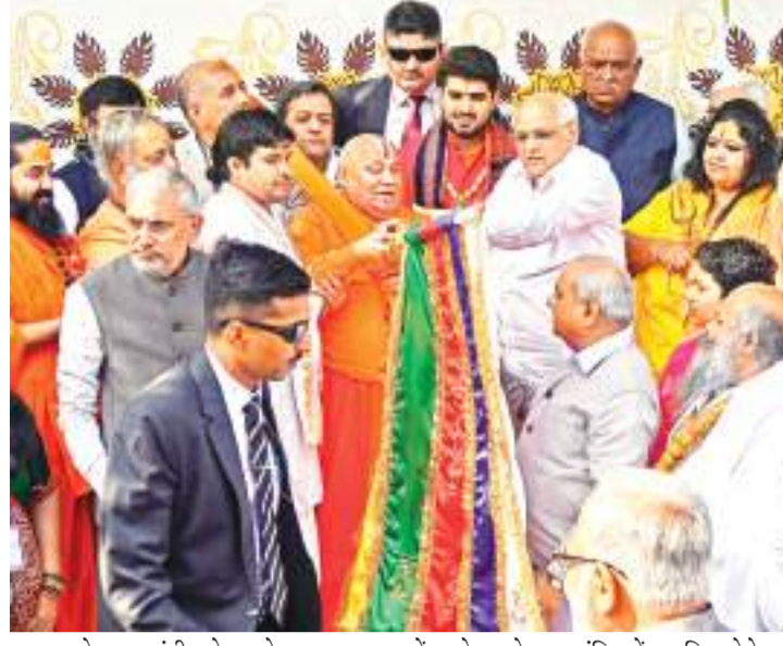
गुजरात के मुख्यमंत्री भूपेंद्र पटेल अहमदाबाद में अयोध्या के राम मंदिर में स्थापित होने वाले ध्वज स्तंभ को ले जाने के लिए निकाले गए जुलूस को हरी झंडी दिखायी।