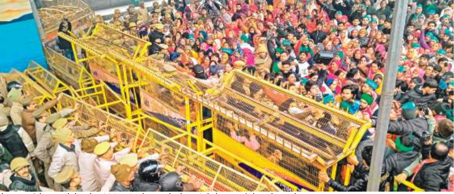
नोएडा : किसानों ने शुक्रवार को नोएडा में एनटीपीसी कार्यालय के पास अपने विरोध प्रदर्शन के दौरान पुलिस बैरिकेड्स को पार करने का प्रयास किया।