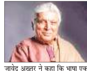
जावेद अख्तर ने कहा कि भाषा एक क्षेत्र की होती है और इसका धर्म से कोई लेना-देना नहीं है। पूर्ववर्ती पूर्वी पाकिस्तान के बंगाली कहते थे 'हम मर जाएंगे लेकिन उर्दू नहीं पढ़ेंगे, हमें अन्य देश (बांग्लादेश) चाहिए, ये 10 करोड़ लोग कौन थे, क्या वे उर्दू बोलते थे? जावेद अख्तर ने कहा, क्या पश्चिम एशिया में अरब उर्दू बोलते हैं? उर्दू केवल भारतीय उपमहाद्वीप की भाषा है। इसका मजहब से कोई लेना-देना नहीं है।