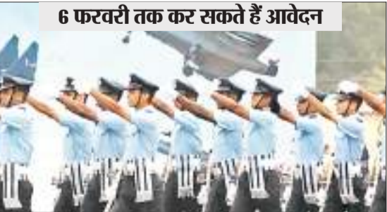
6 फरवरी तक कर सकते हैं आवेदन

ज्वॉइन इंडियन एयरफोर्स ने अग्निवीर एयर इंटैक की विस्तृत अधिसूचना (नोटिफिकेशन) जारी कर दी है। इस वायु सेना भर्ती के लिए इच्छुक पुरुष व महिला उम्मीदवार 17 जनवरी को 11 बजे से रजिस्ट्रेशन कर सकते हैं। ऑनलाइन आवेदन भरने की अंतिम तिथि 6 फरवरी है। वहीं परीक्षा शुल्क जमा करने की भी अंतिम तिथि 6 फरवरी है। परीक्षा 17 मार्च को आयोजित की जाएगी। इसकी जानकारी कमान अधिकारी विंग कमांडर ए प्रदीप रेड्डी ने दी है। 12 से 23 जनवरी तक जागरूकता और प्रेरणा सत्र का आयोजन : स्कूलों और कॉलेजों के लिए 12 से 23 जनवरी तक जागरूकता और प्रेरणा सत्र