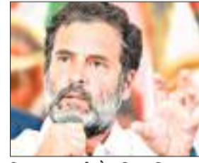
विचार करना ही होगा कि आखिर क्या होगा हमारे सपनों के भारत की पहचान? जीवन की गुणवत्ता या सिर्फ भावुकता? उत्तेजक नारे लगाता युवा या राजगार प्राप्त युवा? मोहब्बत या नफरत? कांग्रेस के पूर्व अध्यक्ष ने दावा किया कि आज वास्तविक मुद्दों से नजरें फेर कर भावनात्मक मुद्दों का राजनीतिक दुरुपयोग किया जा रहा है, जो देश की जनता के साथ छल है।

कांग्रेस के पूर्व अध्यक्ष राहुल गांधी ने शुक्रवार को दावा किया कि मौजूदा समय में वास्तविक मुद्दों से नजरें फेर कर भावनात्मक मुद्दों का राजनीतिक दुरुपयोग किया जा रहा है, जो देश की जनता के साथ छल है। राहुल गांधी ने 'राष्ट्रीय युवा दिवस' के अवसर पर सोशल मीडिया मंच 'एक्स' पर पोस्ट किया, देश के युवाओं! आज 'राष्ट्रीय युवा दिवस' पर हमें स्वामी विवेकानंद के विचारों को फिर से याद करने की जरूरत है। उन्होंने युवाओं की ऊर्जा को ही एक समृद्ध देश का आधार कहा और पीड़ित एवं निर्धन की सेवा को ही सबसे बड़ी तपस्या बताया था। उन्होंने कहा, युवाओं को