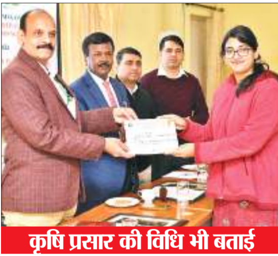
कृषि प्रसार की विधि भी बताई