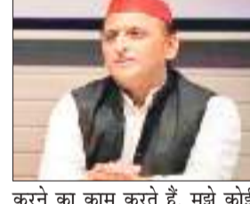
करने का काम करते हैं। मुझे कोई निमंत्रण नहीं मिला है। जब हम कोई कार्यक्रम करते हैं तो अपने परिचित को ही निमंत्रण देते हैं। हम किसी राह चलते को निमंत्रण नहीं देते। हमें कोई निमंत्रण नहीं दिया गया है। इस पर एक पत्रकार ने कहा कि सपा प्रमुख को निमंत्रण कुरियर से भेजा गया है। इस पर अखिलेश ने कहा, अब यह बात सामने आ रही है मुझे कुरियर से निमंत्रण भेजा गया है।

समाजवादी पार्टी के अध्यक्ष अखिलेश यादव ने शुक्रवार को कहा कि उन्हें अयोध्या में होने जा रहे भगवान राम के प्राण प्रतिष्ठा कार्यक्रम का निमंत्रण न तो व्यक्तिगत रूप से और न ही कुरियर से मिला है। उन्होंने यह भी कहा कि अगर उन्हें निमंत्रण कुरियर से भेजा गया है तो उसकी रसीद उन्हें दिखा दी जाये, ताकि यह पता चल सके कि निमंत्रण सही पते पर ही भेजा गया है या नहीं। राजधानी में समाजवादी पार्टी कार्यालय में शुक्रवार को पत्रकारों से बातचीत में अखिलेश ने अयोध्या में प्राण प्रतिष्ठा कार्यक्रम में आमंत्रित किये जाने के सवाल पर कहा, यह (भाजपा) अपमानित