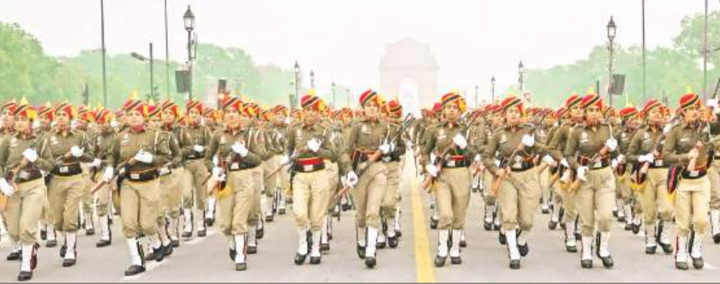
नयी दिल्ली में बुधवार की सर्द सुबह में कोहरे के बीच आगामी गणतंत्र दिवस परेड के लिए रिहर्सल के दौरान दिल्ली पुलिस की महिलाकर्मों टीम।