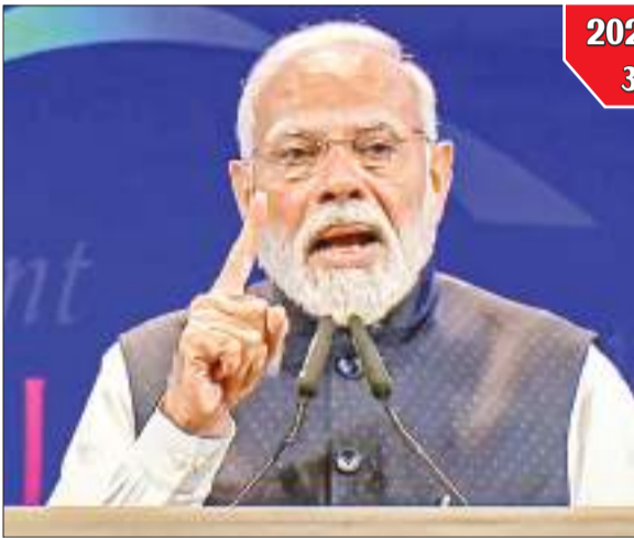
वाइब्रेट गुजरात ग्लोबल समिट 2024 के दौरान संबोधित करते पीएम।

उन्होंने कहा कि दुनिया भारत को स्थिरता के एक महत्वपूर्ण स्तंभ के रूप में देखती है। भारत एक ऐसा मित्र है, जिसपर भरोसा किया जा सकता है, एक ऐसा साझेदार है, जो जन-केंद्रित विकास में विश्वास करता है और एक ऐसी आवाज है, जो वैश्विक भलाई में विश्वास करता है और वह 'ग्लोबल साउथ' की भी एक आवाज है। उन्होंने कहा कि दुनिया आज भारत को वैश्विक अर्थव्यवस्था में वृद्धि का एक इंजन, समाधान खोजने के लिए एक प्रौद्योगिकी केंद्र और प्रतिभाशाली युवाओं के पावरहाउस के रूप में देखती है। प्रधानमंत्री ने यह भी कहा कि ऐसे समय में जब दुनिया कई तरह की अनिश्चितताओं से घिरी हुई है, तब भारत दुनिया में विश्वास की एक 'नयी किरण' बनकर उभरा है। उन्होंने कहा कि तेजी से बदलती विश्व व्यवस्था में भारत 'विश्व मित्र' के रूप में आगे बढ़ रहा है। भारत ने दुनिया को उम्मीद दी है