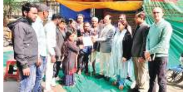
संवाददाता । रांची