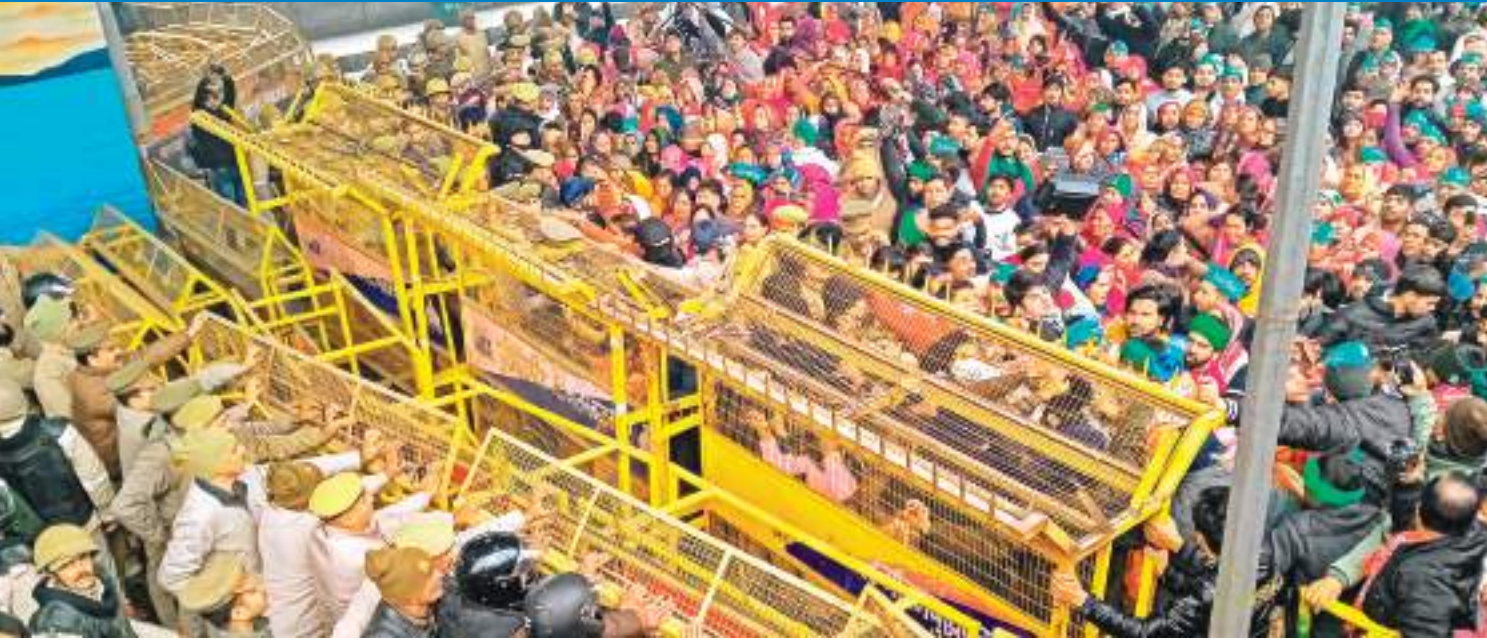
नोएडा : किसानों ने शुक्रवार को नोएडा में एनटीपीसी कार्यालय के पास अपने विरोध प्रदर्शन के दौरान पुलिस बैरिकेड्स को पार करने का प्रयास किया।