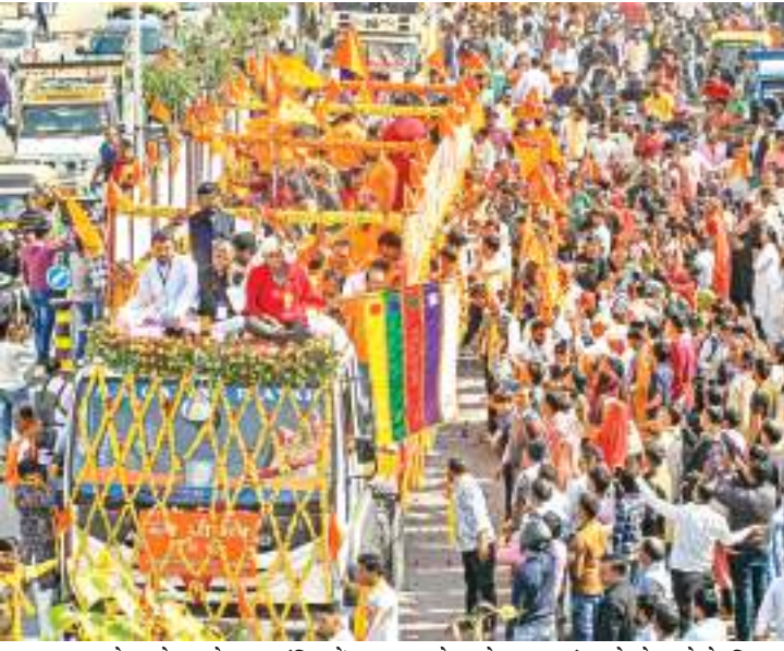
अहमदाबाद से अयोध्या के राम मंदिर में लाए जाने वाले ध्वज स्तंभ को ले जाने के लिए निकाले गए जुलूस में सैकड़ों श्रद्धालुओं ने लिया हिस्सा।