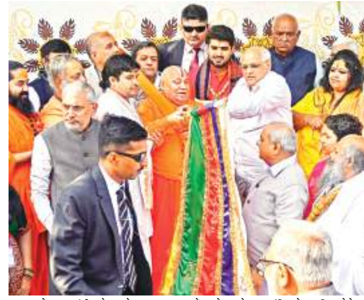
गुजरात के मुख्यमंत्री भूपेन्द्र पटेल अहमदाबाद में अयोध्या के राम मंदिर में स्थापित होने वाले ध्वज स्तंभ को ले जाने के लिए निकाले गए जुलूस को हरी झंडी दिखायी।