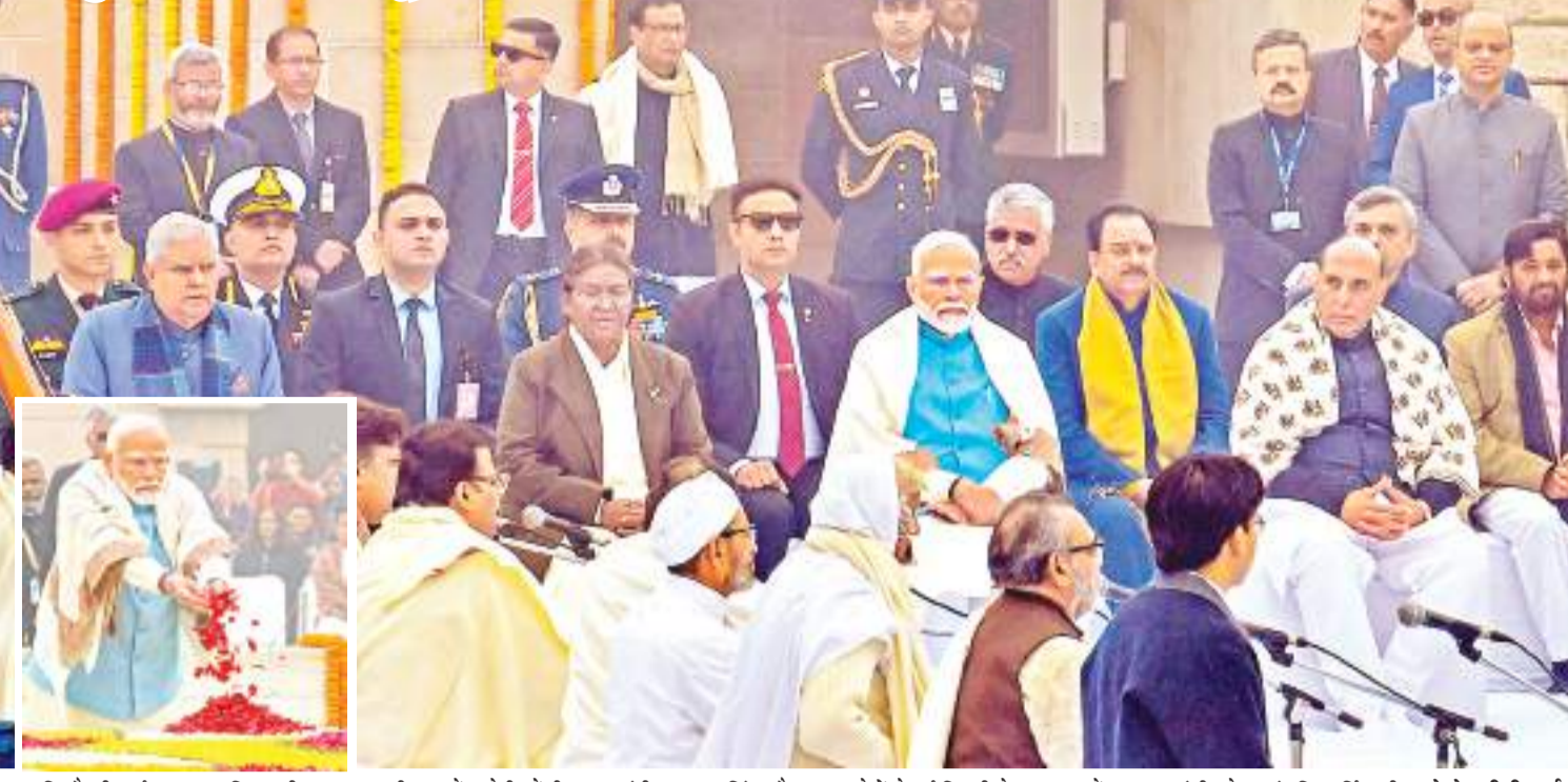
राष्ट्रपति द्रौपदी मुर्मू, उपराष्ट्रपति जगदीप धनखड़, पीएम नरेंद्र मोदी, केंद्रीय रक्षा मंत्री राजनाथ सिंह और अन्य लोगों ने नई दिल्ली के राजघाट में महात्मा गांधी को श्रद्धांजलि अर्पित की.