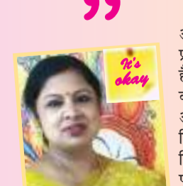
इंदु प्रसाद कलकत्ता हाई स्कूल, बालोली एसएल टीएच

आज भी महिलाओं का प्रतिशत प्रबंधकीय या प्रशासनिक पदों पर कम है. संभवतः शिक्षा के कम अवसर मिलने की वजह से. ऐसे विशेष प्रावधान उन्हें और उनके परिवारों को पहुंचने-पहुँचने के लिए प्रेरित करेंगे जो अच्छे समाज के निर्माण में सहायक होगा. महिलाएं परिवार में प्राथमिकता के अनुसार खर्च करती हैं. महिलाओं के हाथ में अधिक पैसे देकर उनकी भावना और प्रयास को सकारात्मक सहयोग दे सकते हैं.