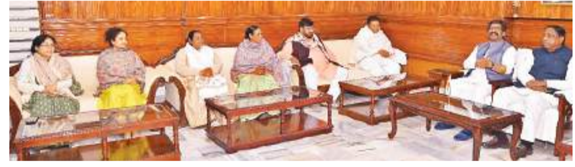
शुभम संदेश टीम। रांची

सियासी हलचल के बीच मंगलवार की रात कांके रोड स्थित सीएम आवास में हेमंत सोरेन की अध्यक्षता में सत्ता पक्ष के विधायकों की बैठक हुई। दो घंटे तक चली बैठक में वर्तमान राजनीतिक हालात पर चर्चा हुई और आगे की रणनीति पर मंथन किया गया। हालांकि बैठक में क्या निर्णय लिये गये यह स्पष्ट रूप से बाहर नहीं आ पाया है। दोपहर एक बजे ईडी की टीम के सीएम आवास पहुंचने से पहले पहले बुधवार को दिन के साढ़े 11 बजे से सत्ता पक्ष के विधायकों की फिर बैठक होगी। बैठक के बाद भी एकजुटता प्रदर्शित करने के लिए मंत्री व विधायक सीएम आवास में ही मौजूद रहेंगे। इससे पूर्व मंगलवार दोपहर सीएम ने सत्ता पक्ष के विधायकों के साथ बैठक की थी। बैठक के बाद सभी एकसाथ मोरहावादी स्थित बापू वाटिका में महात्मा गांधी को श्रद्धांजलि अर्पित करने पहुंचे थे। शाम को दोबारा हुई बैठक में सत्ता पक्ष के दो-तीन