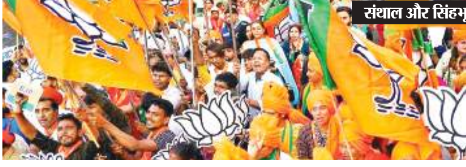
संथाल और सिंहभूम में नियुक्त 12 में से सिर्फ एक पदाधिकारी आदिवासी

भाजपा मिशन 2024 को लेकर झारखंड में संगठनिक फेरबदल कर रही है। प्रदेश अध्यक्ष बाबूलाल मरांडी ने पहले 44 प्रदेश पदाधिकारियों की अपनी टीम बनाई। इसके बाद सभी लोकसभा सीटों के लिए लोकसभा प्रभारी, संयोजक और सह संयोजक बनाये गये। भाजपा की नजर मुख्य रूप से झारखंड के एसटी सुरक्षित 5 लोकसभा और 28 विधानसभा सीटों पर है। इसे देखते हुए बाबूलाल मरांडी ने अपनी 44 सदस्यीय नई टीम में आदिवासी नेताओं को तरकीब दी। लेकिन लोकसभा प्रभारी, संयोजक और सह संयोजक (42 पदाधिकारियों) के चयन में आदिवासी नेताओं को दरकिनारा कर दिया गया। 14 में से एक भी प्रभारी और संयोजक