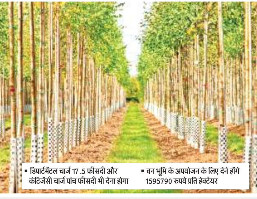
डिपार्टमेंटल चार्ज 17.5 फीसदी और कंटिजेंसी चार्ज पांच फीसदी भी देना होगा

प्रतिपूरक वनरोपण करने में अब निजी कंपनियों को अब 96775 रुपए देने होंगे। इसमें डिपार्टमेंटल चार्ज 17.5 फीसदी और कंटिजेंसी चार्ज पांच फीसदी देना होगा। इसमें पौधारोपण के लिए 54000 रुपए देने होंगे, पहले साल के लिए मेंटेनेंस के लिए 9100 रुपए, दूसरे साल मेंटेनेंस के लिए 5700 रुपए, तीसरे साल मेंटेनेंस के लिए 3600, चौथे साल 3400 रुपए, पांचवें साल 3200 रुपए देने होंगे।