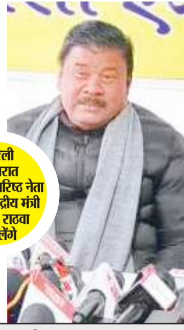
महारैली में गुजरत कांग्रेस के वरिष्ठ नेता और पूर्व केंद्रीय मंत्री नारायण राठवा भाग लेंगे