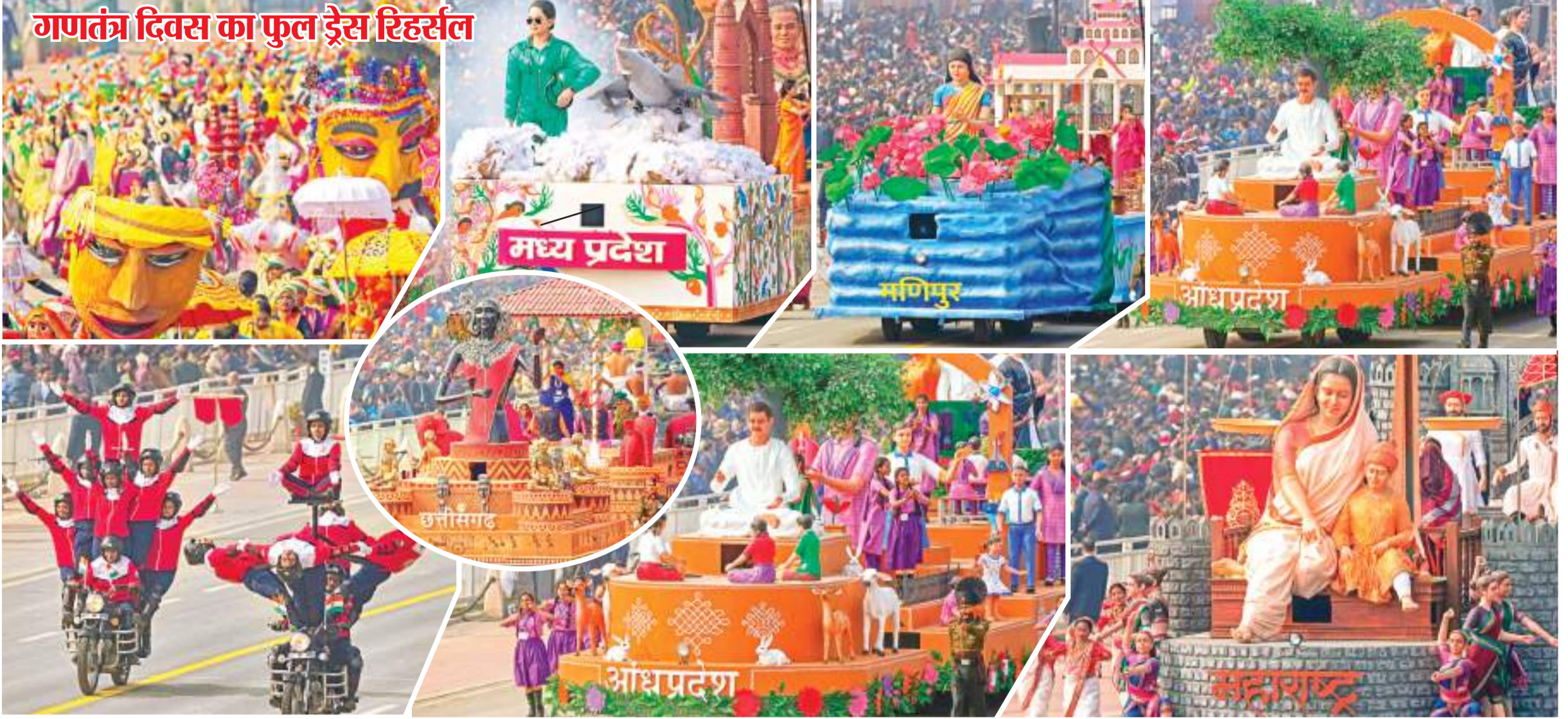
मंगलवार को गणतंत्र दिवस समारोह की तैयारी को लेकर फुल एंड फाइनल ड्रेस रिहर्सल किया गया. इसमें विभिन्न राज्यों व केंद्र शासित प्रदेशों की झांकियां भी निकलीं. समारोह में मुख्य अतिथि के रूप में फ्रांस के राष्ट्रपति मौजूद रहेंगे. इस बार महिला सशक्तीकरण पर विशेष जोर रहेगा.