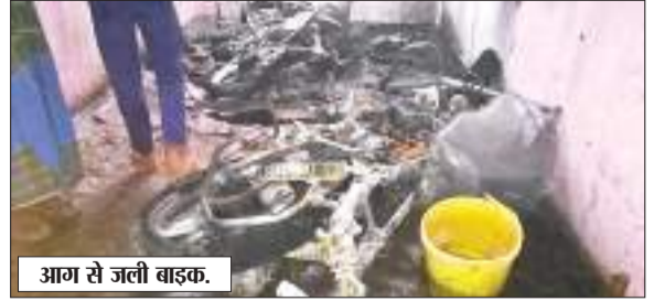
आग से जली बाइक.

अयोध्या में रामलला के प्राण प्रतिष्ठा के पावन अवसर पर सोमवार को पूरे देश में माहोत्सव मनाया गया। लोग अपने-अपने घर और प्रतिष्ठानों में दीपोत्सव मनाए। आतिशबाजी की और प्रभु श्रीराम का अभिषेक किया। लेकिन ईचागढ़ प्रखंड क्षेत्र के गुडमा गांव में जरा सी चूक होने के कारण दो बाइक जल कर राख हो गयीं।