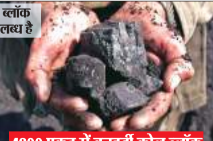
4600 एफडू में बनहर्दी कोल ब्लॉक

पतरातू प्लांट के लिए आवंटित बनहर्दी कोल ब्लॉक लातेहार के चंदवा में 4600 एफडू में है. पूरा परिया 18 वर्ग किलोमीटर में है. इसमें 10 वर्ग किलोमीटर में ड्रिलिंग हो चुकी है. जिसमें 900 मिलियन टन कोयला का अनुमान लगाया गया है. शेष 8 वर्ग किलोमीटर में 600 मिलियन टन कोयला का अनुमान है. हरियाणा की साउथ वेस्ट पिपाकल कंपनी ने इस ब्लॉक की ड्रिलिंग की है.