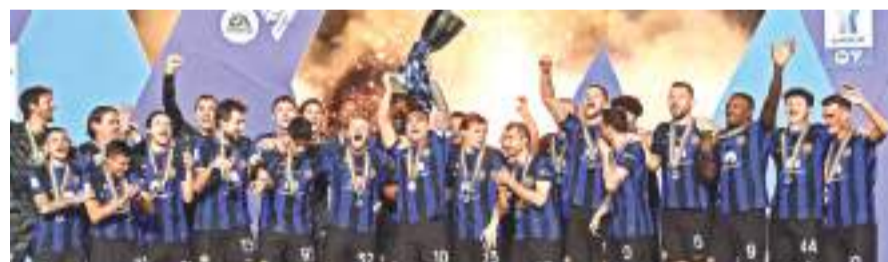
रियाद

लुगोरो मार्टिनेज ने रियाद में नेपोली पर 1-0 की रोमांचक जीत में मैच विजयी गोल करके इंटर मिलान का लगातार तीसरा इटालियन सुपर कप