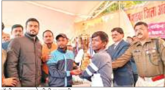
ट्रॉफी प्रदान करते डीसी व एस्पि