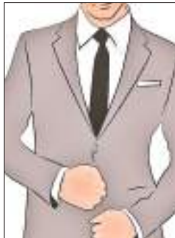
राज्य बनने के तुरंत बाद ही दिखने लगा था जलवा

किए जाते थे, पहले तो सलाम बंदगी 'साहब बहादुरों' को ही करना पड़ता था, अपना मल्ला इनके दर पर जब टिकता था, तो आगे बढ़ने का पासपोर्ट जारी होता था, इनका रुतबा देखने और सुनने लायक होता था, मजाल है कि कोई इनकी इजाजत के बगैर 'सरकार बहादुर' से मिल ले? मंत्रालय में इनकी इच्छा के बगैर एक पत्ता भी नहीं हिल सकता था, 'साहब बहादुरों' की धमक और हनक मंत्रालय और सचिवालय से लेकर ब्लॉक के हाकिमों तक हुआ करती थी, इनकी कोई हुक्म उड़ली नहीं कर सकता था।