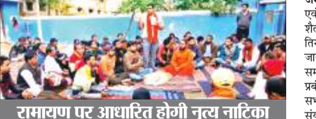
रामायण पर आधारित होगी नृत्य नाटिका