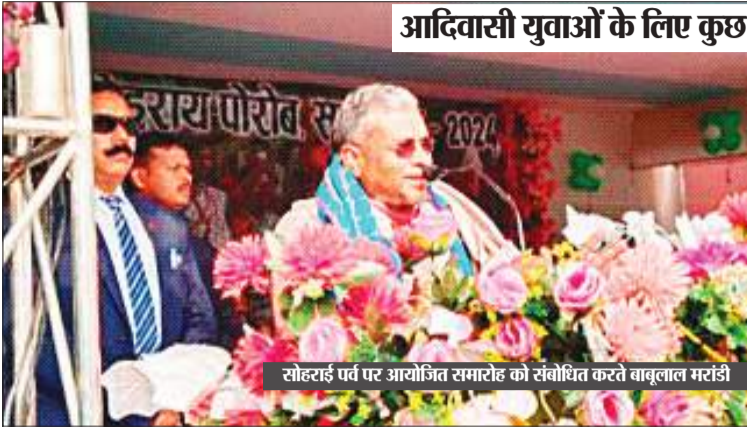
सोहराई पर्व पर आयोजित समारोह को संबोधित करते बाबूलाल मरांडी