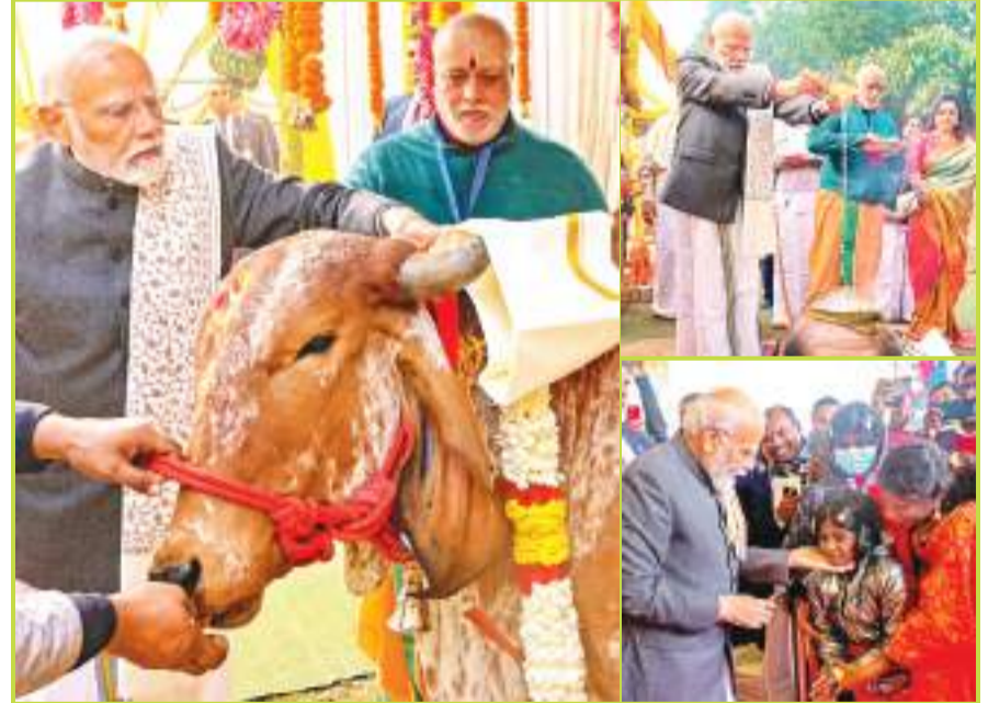
नयी दिल्ली में पोंगल के मौके पर कार्यक्रम का आयोजन किया गया, जिसमें पीएम मोदी ने गो-सेवा की, पूजा अर्चना भी की।