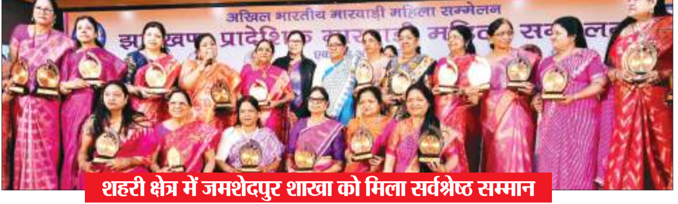
शहरी क्षेत्र में जमशेदपुर शाखा को मिला सर्वश्रेष्ठ सम्मान